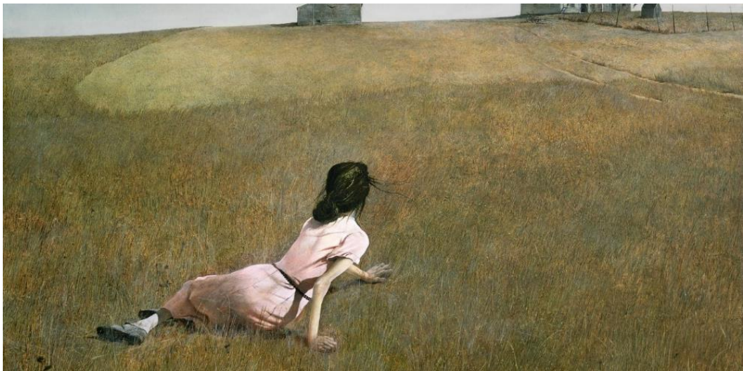
Slika 3 - Andrew Wyeth: Christina's World (1948).

Uzme li se u obzir dubina slike i Christinina pozicija tijela, Wyethovo djelo postaje priča o čežnji, samoći i otuđenosti, što nas je inspiriralo za našu scenu i motiviralo na daljnje istraživanje. Saznali smo da je slikar Wyeth imao najbolju prijateljicu, Christinu, koja je imala dječju paralizu i nije mogla pomicati noge. Budući da je često provodio vrijeme s njom, postali su jako dobri prijatelji. Jednog je dana s prozora svoje kuće vidio kako Christina vuče donji dio tijela po svom dvorištu, što mu je i poslužilo kao inspiracija za poznatu sliku. Najviše nas je dirnula činjenica da je prije svoje smrti rekao da želi biti pokopan uz nju. Wyethova je slika uklopljena i u plakat naše predstave, postavljena kao pozadina iza slike fotografa A. Jurline.