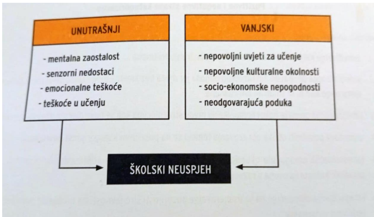
Slika 1. Činitelji školskog neuspjeha