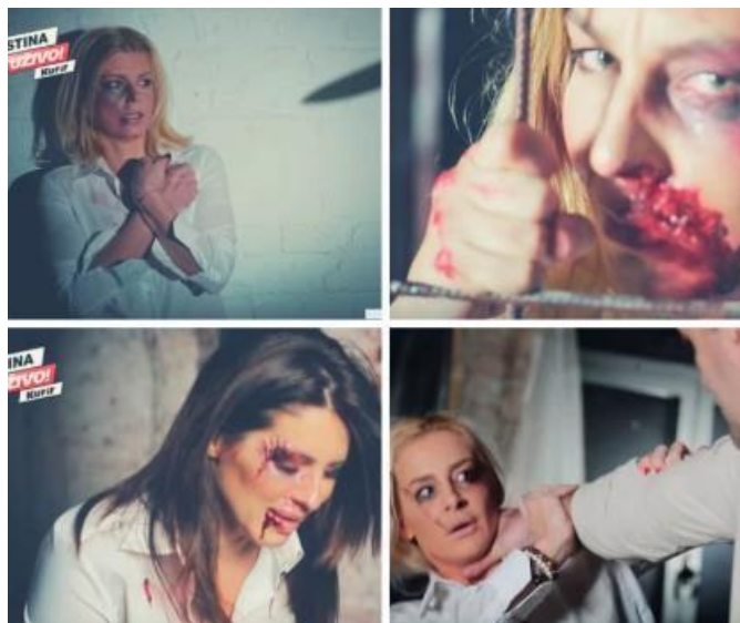
Slika 7 Četiri videa kampanje „STOP NASILJU“, na kojima su prikazane poznate ličnosti koje su bile zaštitna lica kampanje, u situaciji nasilja