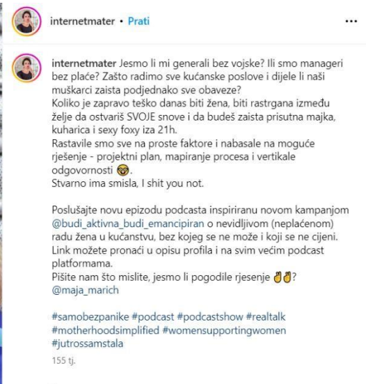
Slika 8 Objava na profilu @internetmater