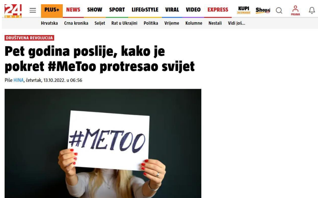
Slika 4 Članak sa portala 24sata.hr

Osim stranih portala, o #MeToo pokretu izvještavali su i Hrvatski mediji. U prikazanom članku navodi se kako je taj pokret prerastao u društvenu revoluciju povijesne važnosti. Osim toga, navodi se kako je sam pokret imao i protureakciju tj. da su se pojavljivale optužbe da se ljude „otkazuje“ bez potrebne istrage. Sve u svemu, pokret i dalje promovira svoju poruku i zadaću, poticanje društvenih promjena.