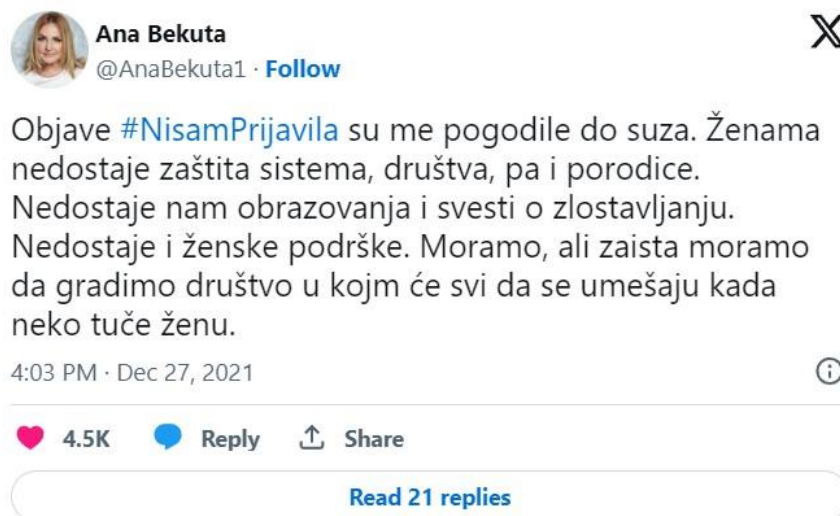
Slika 6 Objava na X profilu Ane Bekute

Jedan je od virtualnih pokreta koji je započet na prostorima Balkana #NisamPrijavila pokret koji je postao popularan na Twitteru (danas X) krajem 2021. godine. Prema istraživanju Sonje Marković, u nekoliko dana skupilo se oko 16.000 objava na Twitteru (danas X) s hashtagom , gdje su žene dijelile svoje priče o tome zašto nisu prijavili nasilje koje su doživjeli. „Najveći je razlog neprijavlivanja nepovjerenje u institucije koje posramljuju žrtve, ne pomažu im i time ih stavljaju u još goru situaciju.“ (Marković, 2023:18). Kako navodi, sve je krenulo od objave srpske influencerice i politologinje Nine Stojković, koja je pisala o tome kako je prijavila partnera njezine sestre za psihičko i fizičko zlostavljanje i da nisu dobile pomoć jer nisu postojali dokazi protiv počinitelja. „Potaknuta objavom, srpska aktivistkinja Dejana ‘Dexi’ Stošić na svojem Twitter profilu objavila je svoju ispovijest pod hashtagom : „#NisamPrijavila niti rekla bilo kome jer me je bilo sramota i jer mu je majka advokat.“ Ubrzo je, nakon njezine objave Twitter planuo s ispovijestima, a kampanja se proširila na susjedne zemlje i šire.“ (Marković, 2023:18). Također, navodi kako se jedan dio tvitova odnosi na žene koje nisu imale povjerenje u institucije ili su se obratile, a naišle na osudu. Osim influencera , pokret su podržale poznate pjevačice i glumice s područja Balkana.