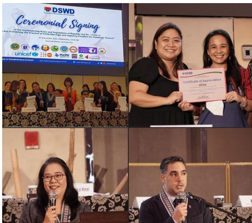
Slika 5. Azijski influenceri u projektu „ The Creating Spaces “