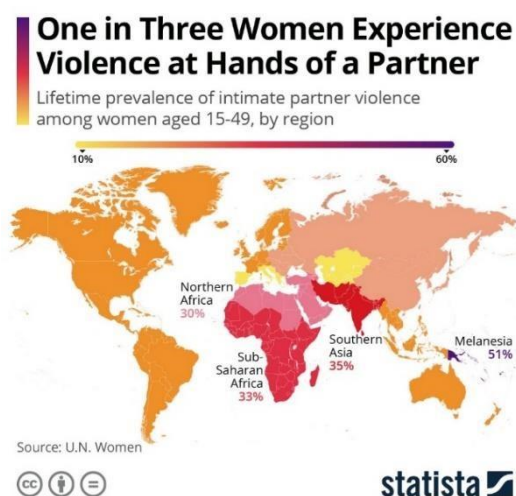
Slika 1. Statistički prikaz problematike nasilja nad ženama od strane partnera na globalnoj razini

Svjetska zdravstvena organizacija (2024.) također navodi kako je većina tog oblika nasilja nasilje od strane intimnog partnera. „Diljem svijeta, gotovo jedna trećina (27%) žena u dobi od 15 do 49 godina koje su bile u vezi izjavljuje da su bile izložene nekom obliku fizičkog i/ili seksualnog nasilja od strane svog intimnog partnera. Također, naglašavaju kako nasilje može negativno utjecati na tjelesno, mentalno, seksualno i reproduktivno zdravlje žena te može povećati rizik od dobivanja HIV-a.“ (Svjetska zdravstvena organizacija, 2024.).