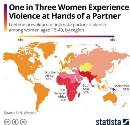
Slika 1. Statistički prikaz problematike nasilja nad ženama od strane partnera na globalnoj razini

Svjetska zdravstvena organizacija (2024.) također navodi kako je većina tog oblika nasilja nasilje od strane intimnog partnera. „Diljem svijeta, gotovo jedna trećina (27%) žena u dobi od 15 do 49 godina koje su bile u vezi izjavljuje da su bile izložene nekom obliku fizičkog i/ili seksualnog nasilja od strane svog intimnog partnera. Također, naglašavaju kako nasilje može negativno utjecati na tjelesno, mentalno, seksualno i reproduktivno zdravlje žena te može povećati rizik od dobivanja HIV-a.“ (Svjetska zdravstvena organizacija, 2024.).