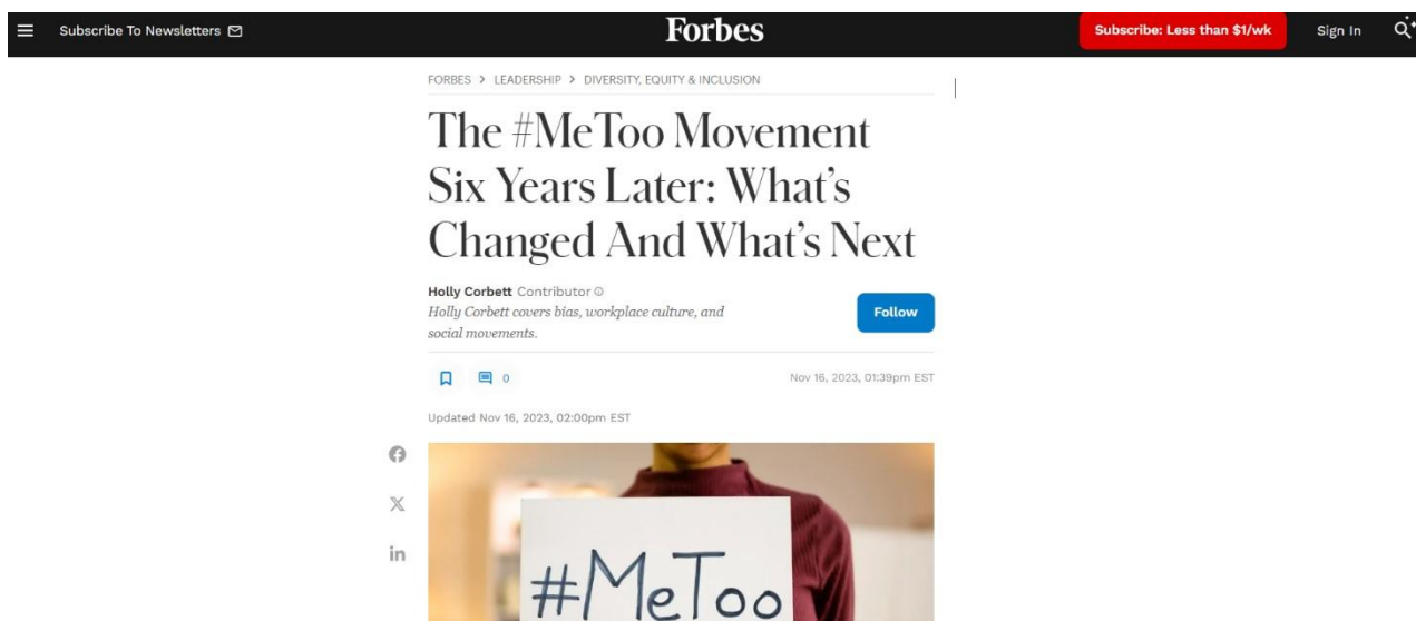
Slika 3 Članak sa portala forbes.com