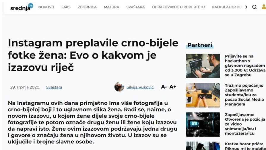
Slika 2 Članak sa portala srednja.hr