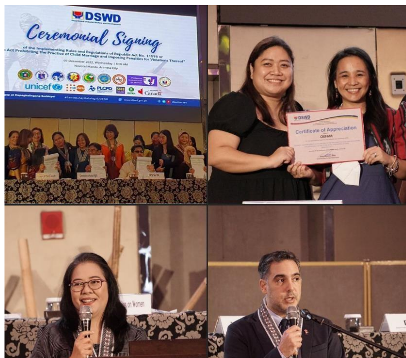
Slika 5. Azijski influenceri u projektu „ The Creating Spaces “