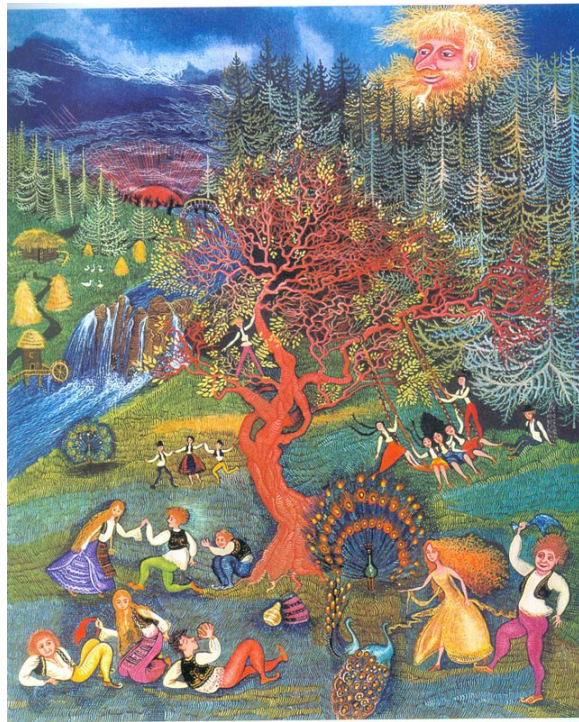
Slika 3. Cvijeta Job, ilustracija za bajku "Regoč"

Prema Hlevnjak i Ivanuš (2022) Cvijeta svojim minijaturama unosi novu dimenziju umjetnosti u Hrvatsku, a jedno od najznačajnijih djela ilustracije su za knjige Ivane Brlić-Mažuranić. Cvijetine, podosta osebujne, ilustracije zbog bogatih detalja, jedinstvenoga pristupa, izbora boja i lišavanja dobnog ograničenja postale su prepoznatljivi simbol priče koju interpretiraju.