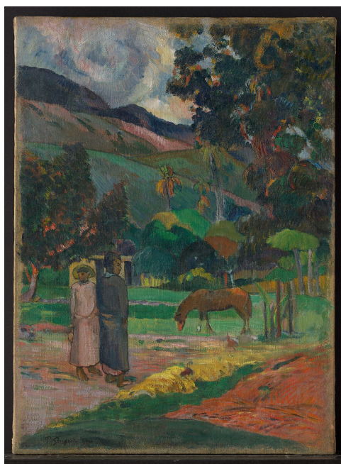
Slika 7. Paul Gauguin, “Tahićanski krajolik”

U kontekstu ranije spomenutih primjera eskapizma, odnosno bijega od stvarnosti, Doig nasljeđuje iskustvo Gauguina u suvremenom kontekstu. Poput Gauguina, i Doig vlastitim slikarstvom pa i življenjem prakticira eskapizam; Gauguin se od suvremenog života svoga vremena sklanja iz Pariza na Tahiti, a Doig se iz Londona sklanja na Trinidad i Tobago.