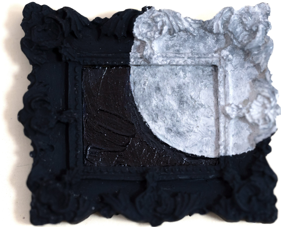
Slika 16: “Moj Mjesec”