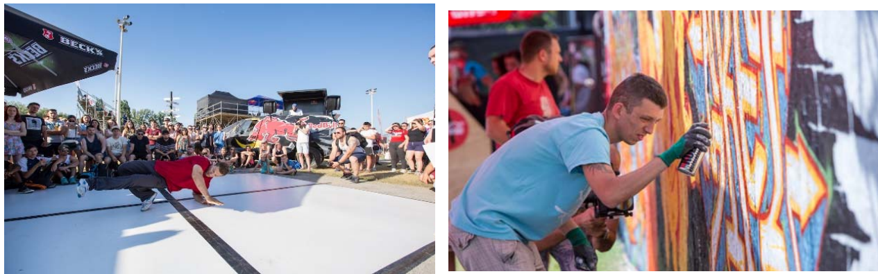
Slika 16. natjecanje u Hip Hop Jam

U nastavku rada se navode slike koje su obilježile Pannonian Challenge 2019. godine svaka u svom segmentu (plesu, grafitima i sportskim događajima).