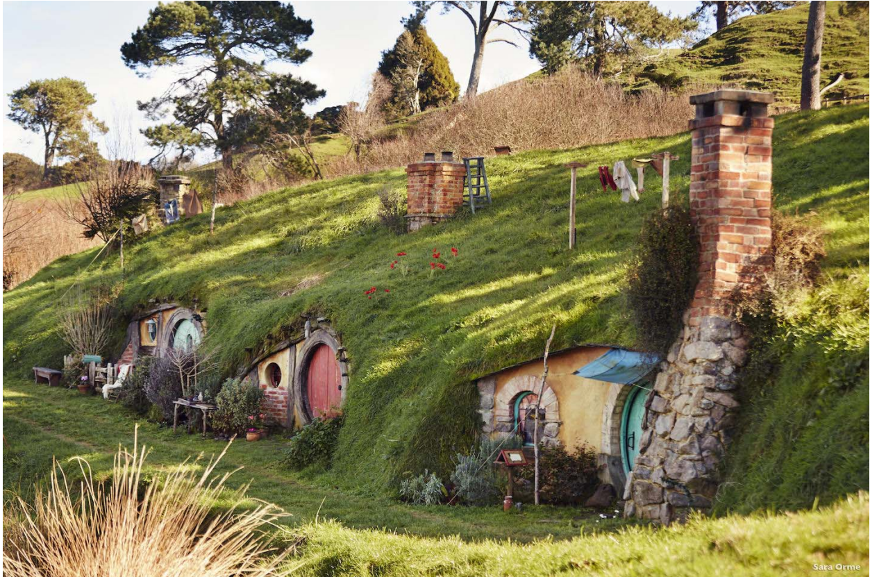
Slika 1. The Shire and Hobbiton selo u kojem žive Hobbiti

Matamata mjesto na kojem je smješten The Shire i Hobbiton je doslovno napravljeno za potrebe seta i ostat će trajna atrakcija. Ova slika prikazuje Shire selo u kojem žive Hobbiti, a nastalo je za potrebe snimanja trilogije.