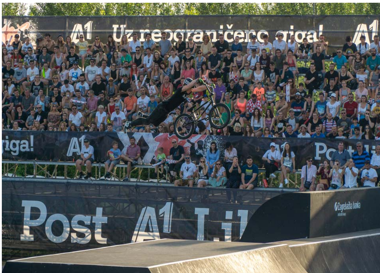
Slika 17. Pannonian Challenge