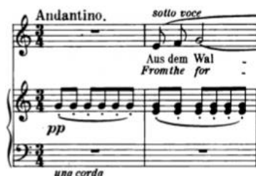
Primjer br. 12

Die Nacht , treća je pjesma op. 10 Richarda Straussa. Napisana je u C-duru (orig. D-dur) s uklonima u c-mol i As-dur, u 3/4 mjeri s oznakom tempa andantino te uputom načina izvođenja sotto voce . Klavirski uvod započinje jednostavnim jednotaktnim ponavljanjem tona g1 koji predstavlja dominantu tonaliteta. Vokalna dionica kreće u drugom taktu na terci, na tonu e1, čime se sugerira tonalitet C-dura.