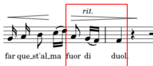
Primjer br. 4

U B dijelu arije, melodijsku liniju možemo okarakterizirati kao spoznaju koja bi razriješila sve ljubavne muke, a u kojoj se može osjetiti ushićenje, ali i smiraj. B dio kadencira u paralelni mol početnog tonaliteta, odnosno u f-mol. Tekst „Ako ste to Vi, pokažite se, otpustite tjeskobu mog srca“ s oznakom ritardando na zadnjem stihu sugerira mir duše u nadi.