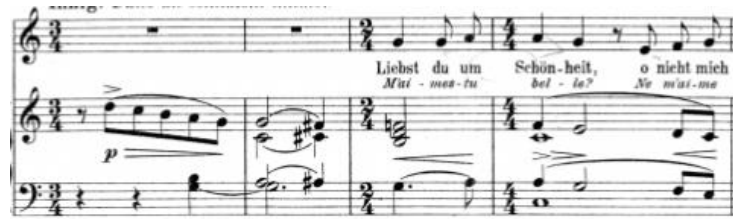
Primjer br. 15

Pjesma govori o pravoj ljubavi koja se ne temelji na prolaznim i promjenjivim elementima života kao što su mladost, izvanjska ljepota i bogatstvo. Naglasak je na ljubavi koja voli ono što je oku nedohvatno, unutarne biće te osobe, odnosno dušu.