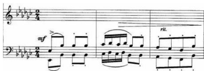
Primjer br. 21

Robinjica je solo pjesma iz opusa 47 Blagoja Berse, skladana u es-molu s promjenama tonaliteta u D-dur. Pjesma je varirano strofnog oblika. Oznaka tempa u 2/4 mjeri je andante sostenuto , odnosno umjerenom suzdržano i dostojanstveno. Pjesma Robinjica nosi još jedno ime, a to je Bosanska balada . Ova solo pjesma započinje klavirskim uvodom u trajanju od tri takta, a u kojem se iznosi motiv glavne teme u oktavama.