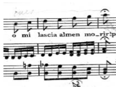
Primjer br. 25

Drugi dio A dijela u dominantnom je tonalitetu i donosi vrhunac arije, uzlaznu melodiju u ljestvičnom nizu od b1 do as2 koja ujedno predstavlja i kraj A dijela.