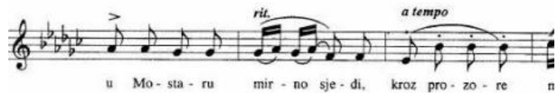
Primjer br. 21

Vokalna dionica počinje u četvrtom taktu u piano dinamici izmjenjujući legato i staccato agogiku. U ovoj pjesmi vrlo je izražen pripovjedni i epski karakter. Takav stil potpomognut je učestalim izmjenama ritardanda na krajevima fraza te a tempo oznakama na počecima novih fraza.