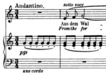
Primjer br. 12

Die Nacht , treća je pjesma op. 10 Richarda Straussa. Napisana je u C-duru (orig. D-dur) s uklonima u c-mol i As-dur, u 3/4 mjeri s oznakom tempa andantino te uputom načina izvođenja sotto voce . Klavirski uvod započinje jednostavnim jednotaktnim ponavljanjem tona g1 koji predstavlja dominantu tonaliteta. Vokalna dionica kreće u drugom taktu na terci, na tonu e1, čime se sugerira tonalitet C-dura.