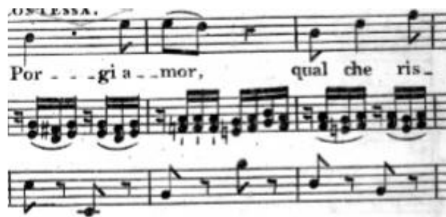
Primjer br. 23

Arija je napisana u Es-duru, 2/4 mjeri s oznakom tempa larghetto što znači 'vrlo široko'. Započinje preludijem u trajanju od 16 taktova iznoseći ukrašen i orkestriran motiv glavne melodijske linije. Na početku vokalne dionice pratnja zauzima suptilnu funkciju pokretanja široke dvodobne mjere ponavljajućim šesnaestinskim ritamskim obrascima.