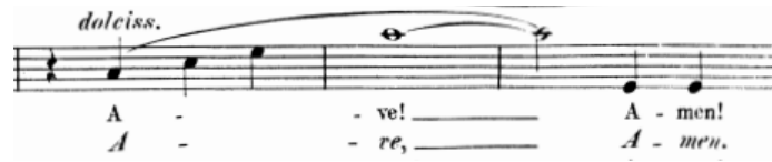
Primjer br. 29

Posljednju frazu arije možemo razmatrati kao upućivanje molitve Bogu, u nebo, rastavljenim akordom tonike As-dura. Konačni „Amen!“ vraća nas iz kontemplativnog stanja u realnost skokom s as2 na es1.