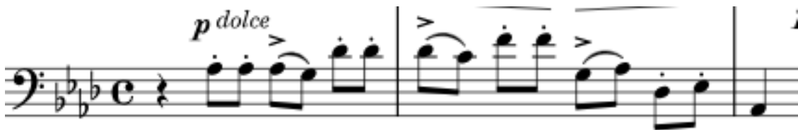
Primjer br. 1

Arija Deh più a me non v'ascondete započinje klavirskim uvodom u trajanju od dva takta i jednostavnim harmonijskim slogom, uvodeći nas u početni tonalitet As-dura . Arija je napisana u 4/4 mjeri s oznakom tempa larghetto te oznakom načina izvođenja dolce . Vokalna melodijska linija, isto kao i klavirski uvod, započinje na drugu, odnosno laku dobu, upravo kako bi se postigla atmosfera dolce , odnosno 'slatke brige'. Već u samom uvodu, u basovoj dionici, možemo čuti temu arije koja se stalno ponavlja.