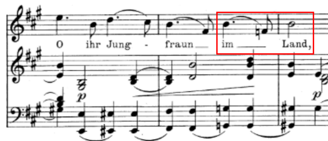
Primjer br. 9

Ova solo pjesma strofnog je oblika. U prvom dijelu strofe izmjenjuju se dvije kontrastne fraze od kojih je jedna prpošnog, a druga pjevnijeg, ali napetijeg karaktera. Drugi dio strofe donosi novi glazbeni materijal, pjevniju i mirniju melodiju, iako sadrži veće i neobičnije intervalske skokove (povećane kvarte):