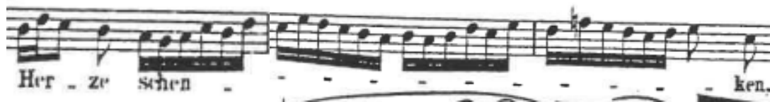
Primjer br. 6

koloraturni niz koji nas vodi do vrhunca prvog dijela arije, do tona g2, te sekventnog ponavljanja i smirivanja fraze, odnosno do samog kraja A dijela.