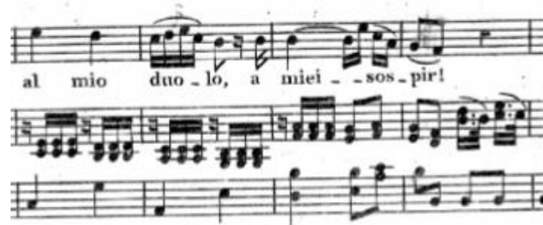
Primjer br. 24

Formu arije Porgi, amor teško je smjestiti u standardni okvir. Najbliži opis forme bi bio podijeljenost na dva velika dijela, A i B, od kojih svaki sadrži još jednu podjelu a i b fraze. Već na kraju prve fraze A dijela, u 25. taktu, dolazi promjena tonaliteta, odnosno modulacija u dominantni tonaliteta, B-dur. Drugi dio A dijela u dominantnom je tonalitetu.