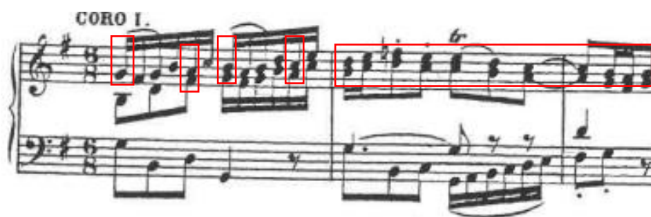
Primjer br. 5

Prvi dio arije započinje preludijem razigranog karaktera u trajanju od 6 taktova, a u kojem se iznose ukrašeni motivi glavne teme.