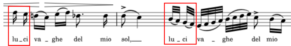
Primjer br. 2

f2 ili početkom male kolorature, a može značiti svjetlost u ljubavnoj tuzi ili oči kao ogledalo duše.