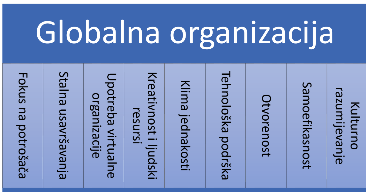
Slika 1. Prikaz najbitnijih stupova/prednosti globalne organizacije

Pod pojmom multinacionalne korporacije stoji organizacija ili poduzeće koja ima sjedište u jednoj zemlji, a svojim investicijama i kapitalom djeluje u drugim zemljama. Ranije su spomenuti motivi osnivanja podružnica u različitim zemljama, a to su jeftinija radna snaga, resursi, porezne pogodnosti, uštede na transportu i sl. Glavni stupovi jedne globalne organizacije vidljivi su na slijedećoj slici.