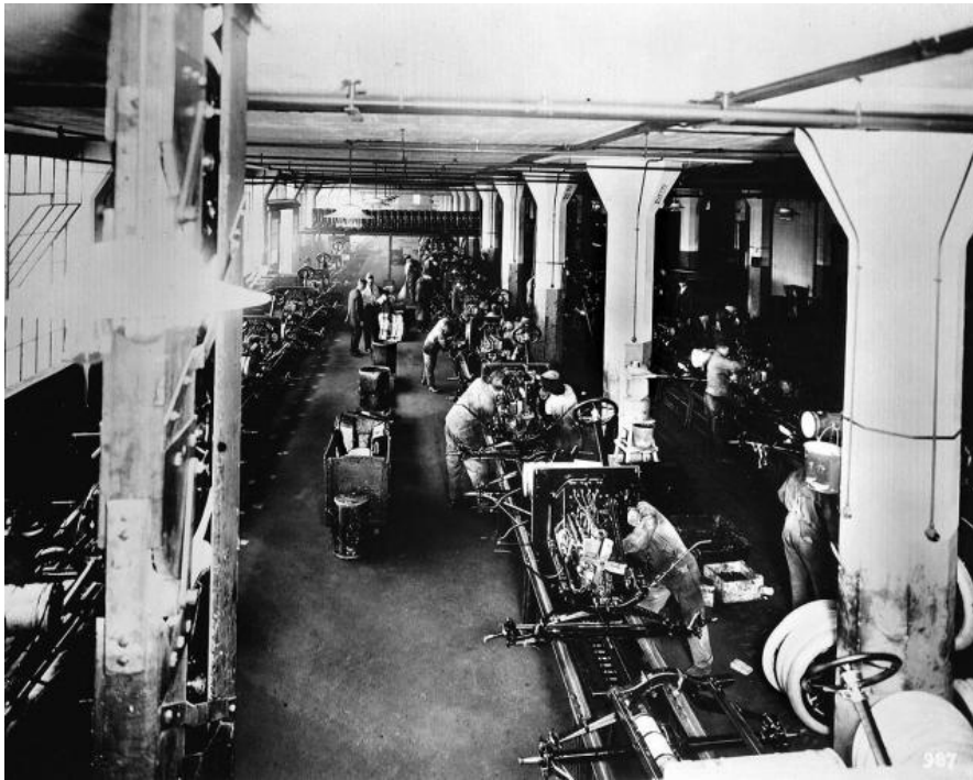
Slika 2. Prikaz rada na pokretnoj traci;

industrijska revolucija. Ford je tako nakon automatizacije 1913. godine znatno smanjio cijenu automobila koja je postala vlasništvo svakog čovjeka na planeti. Te je godine uveo je ugradbenu liniju na osnovi pokretne trake za montiranje vozila. Svaki je radnik obavljao po jednu operaciju na sastavljanju vozila nakon čega bi sljedeći radnik nastavljao montirati i tako redom do kompletiranja vozila. ( https://biografija.net/henry-ford/ )