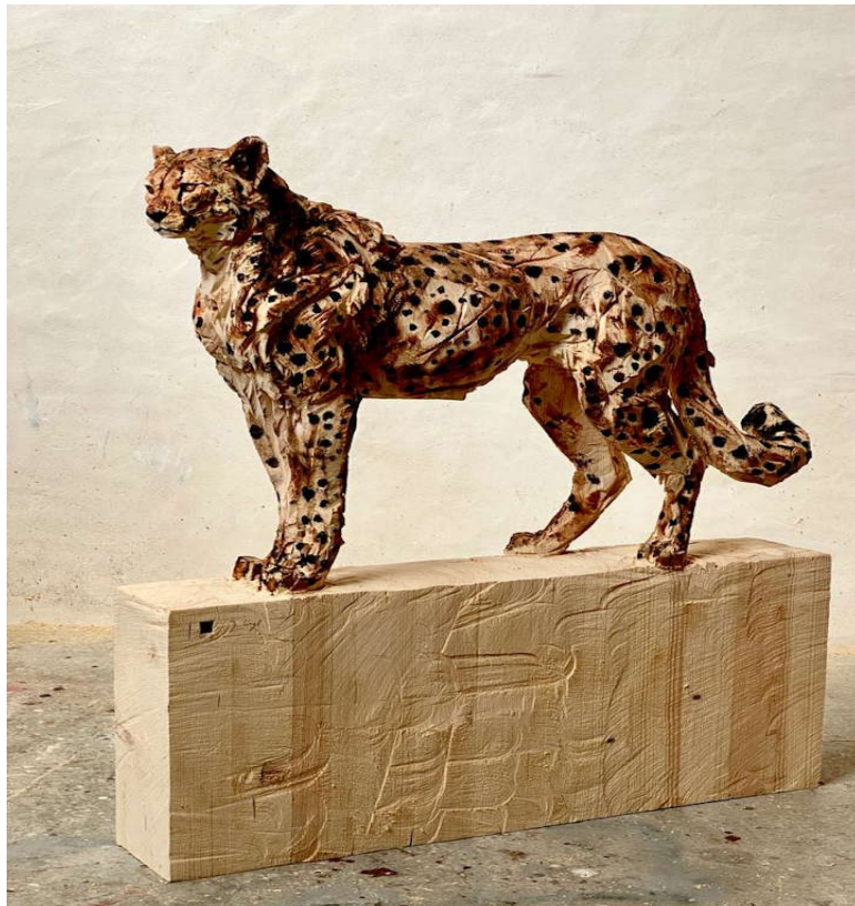
Slika 20. Jurgen Lingl, Stojeći gepard, 2022., drvo, 130x25x140 cm

U suvremenoj umjetnosti izdvajaju se djela njemačkog umjetnika Jurgena Lingla čije su skulpture životinja realistične iako je materijal grubo obrađeno drvo. Svoje skulpture obrađuje motornom pilom, dok tek za detaljniju obradu ponekad koristi alat za rezbarenje drveta, dovršavajući ih tako što ih patinira bojama te tako naglašava specifičnost pojedinih životinja. Tekstura i način bojanja može se vidjeti na primjeru geparda i drugih njegovih radova. (Backer, 2015), (Slika 20.)