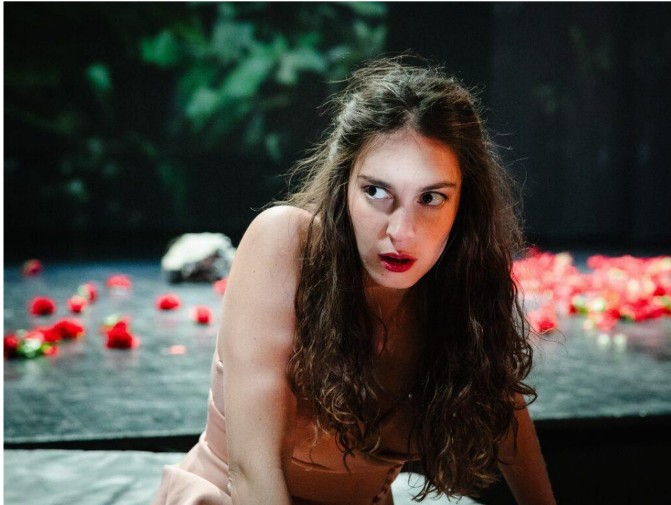
Slika 9. Svjedočenje nad konačnim zarukama

osudom, gleda na sve to no kada iskreno i bez zadržske ispričaju kako ih je luda ljubav navela da se osjećaju kako se osjećaju, sada u tom trenutku, ni kralj na to ne ostane imun te glasno i jasno potvrdi trostruko vjenčanje. Građanstvo uvijek ide za voljom kralja pa tako i ovoga puta.