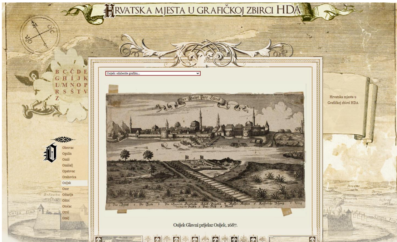
Slika 4 – Osijek Glavni prijelaz 1687, Hrvatska mjesta u grafičkoj zbirci HDA (ARHiNet, n. g.).

1. ARHiNET digitalni arhiv – ARHiNET digitalni arhiv podijeljen je u 11 tema : Hrvatska mjesta u Grafičkoj zbirci, Fotografijske slike iz Hrvatske, Dalmacije i Slavonije, Monumenta antiquissima, Album von Dalmatien, Arhivski vjesnik, Obrana sisačke gospoštije od Turaka, Zbirka fotografija Saler, Digitalna zbirka povelja, Radikalni arhiv, Zbirka grbovnica, Arhiv mapa za Dalmaciju i Istru. Odabirom na temu posjetitelja se vodi na stranicu kategorije na kojoj su zbirke, slike te predmeti podijeljeni po abecedi, tematski i sl. Na Slici 4 možemo vidjeti grafiku Osijeka iz 1687. dostupnoj u Grafičkoj zbirci Hrvatska mjesta Hrvatskog državnog arhiva.