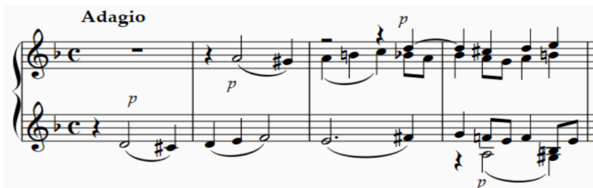
Slika 1. Uvodna tema fagota i kontrapunkt basetnog roga, Introitus

Rekvijem započinje mračnom i mističnom temom koju izvodi fagot, a kojoj se već u sljedećem taktu suprotstavlja kontrapunkt basetnog roga. Pogledajmo kako to izgleda u notnom zapisu: