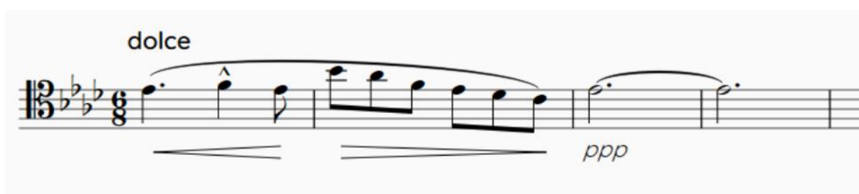
Slika 13. Karakteristični glazbeni motiv violončela u stavku Domine Jesu Christe

U broj nas uvode violončela rastavljenom tonikom As-dura zajedno s drvenim puhačima, koji postavljaju novo osvježenje i materijal nakon dugačkoga prošlog stavka. Ovaj uvod od 12 taktova zapravo je opuštena igra violončela i puhača. Pojavljuje se glavni motiv i glazbu obogaćuju tenor i mezzosopran. Pogledajmo glazbeni motiv koji izvodi violončelo: