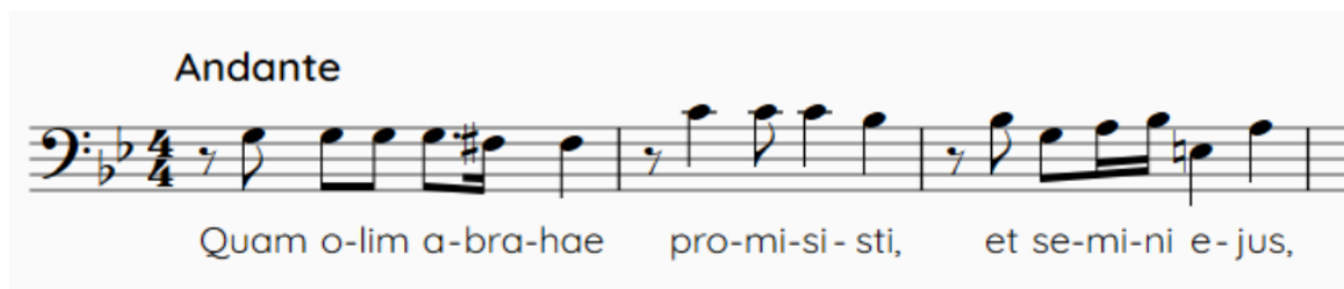
Slika 6. Tema fuge drugoga dijela stavka Domine Jesu Christe

Ova je fuga puna igre samim motivom kroz kromatske pomake te se čini da u svim ovim taktovima, kojih je 35, neprestano čujemo tekst QUAM OLIM ABRAHAE PROMISISTI u ovoj ili onoj inačici, iscrpljujući gotove sva sredstva koja nam provedba fuge nudi za rad s motivom. U predzadnjem taktu glasovi se smiruju na subdominanti g-mola, da bi sam završetak nastupio na pikardijskoj tonici.