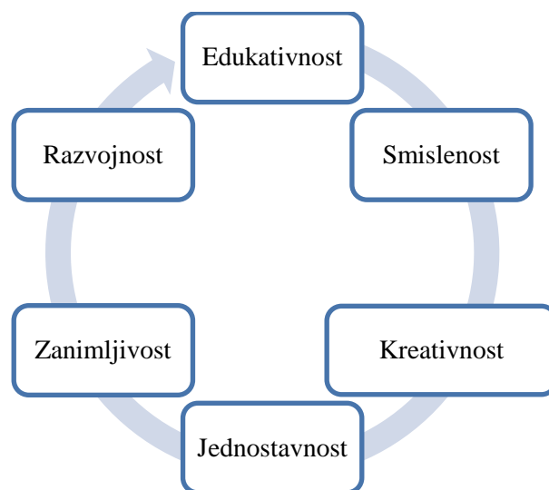
Slika 2. Grafički prikaz načela oblikovanja aktivnosti

Svaka aktivnost mora zadovoljiti određene kriterije oblikovanja. Kriteriji su klasificirani i opisani u obliku šest načela: edukativnosti, smislenosti, kreativnosti, jednostavnosti, zanimljivosti i razvojnosti (Slika 2.). Svako od načela trebalo bi biti prisutno u svakoj novo oblikovanoj pjesmi, igri i cjelokupnoj aktivnosti. Načela su zapravo vodilja glazbenim pedagogima kako bi kod pripreme mogli preciznije, jasnije i svrsishodnije vlastite glazbene i neglazbene elemente aktivnosti i ideje maksimalno prilagoditi djeci predškolske dobi.