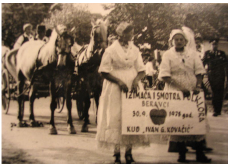
Slika 6. Povorka prve Ižimače

Na dan manifestacije članovi društva, kao i svi mještani, okupljaju se u centru sela u Etno parku gdje se manifestacija održava. Najčešće u programu sudjeluje oko deset do petnaest gostujućih kulturno-umjetničkih društava iz raznih dijelova Hrvatske, ali i šire. Program Ižimače od samih početaka tradicionalno započinje svečanom povorkom svih gostujućih društava od jednog kraja sela sve do Etno parka, prilika je to za goste iz folklornih društava da pokažu svoje tradicionalno ruho.