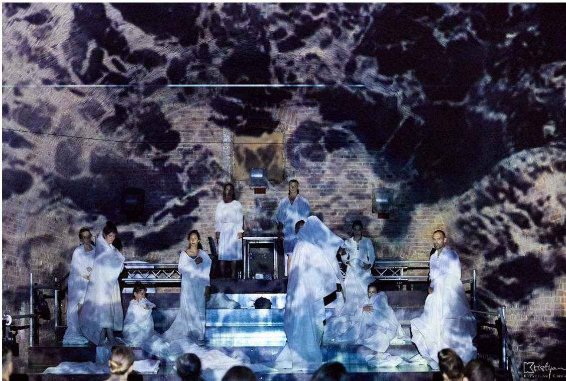
Slika 6: Druga scena - Buđenje

“Poslanje gledatelja je biti promatrač, ali više – biti svjedok. Svjedok nije netko tko svuda zabada nos, tko se trudi biti najbliže ili se ubacivati u radnju drugih. Svjedok se drži ponešto sa strane, ne želi se miješati, želi biti svjestan i vidjeti to što se događa od početka do kraja, kao i sačuvati to u pamćenju; slika događaja treba ostati u njemu samome.” 5