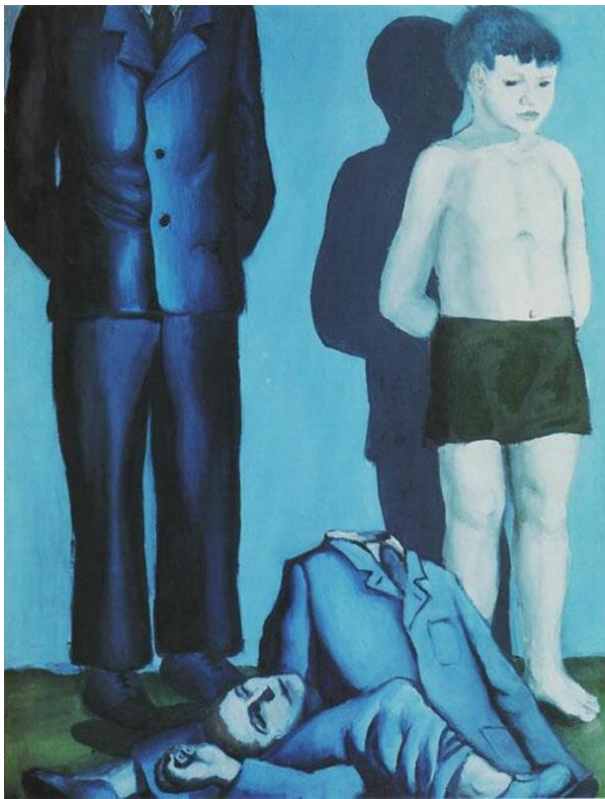
Slika 2: Rozstrzelanie V - Andrzej Wróblewski

Inspiraciju za rad na scenama pronalazili smo u umjetničkim djelima Andrzeja Wróblewskoga. Najviše su me dotaknule njegove dvije slike iz zbirke koju je napravio četrdesetih godina prošlog stoljeća. U tom se razdoblju Wróblewski koristio simbolikom plave boje kao oznakom nematerijalnosti. Uz to, najpoznatija njegova djela te zbirke su Syn i zabita matka / Sin s mrtvom majkom, Zabity maz / Mrtvi suprug i Matka z zabitym synem / Majka s mrtvim sinom .