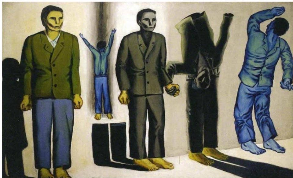
Slika 3: Rozstrzelanie VIII - Andrzej Wróblewski

promatrala tu sliku i svaki put kad je sada pogledam, mogu razmišljati o njoj beskonačno dugo i svaki ću put vidjeti novu tugu i novu bol koju ona pruža.