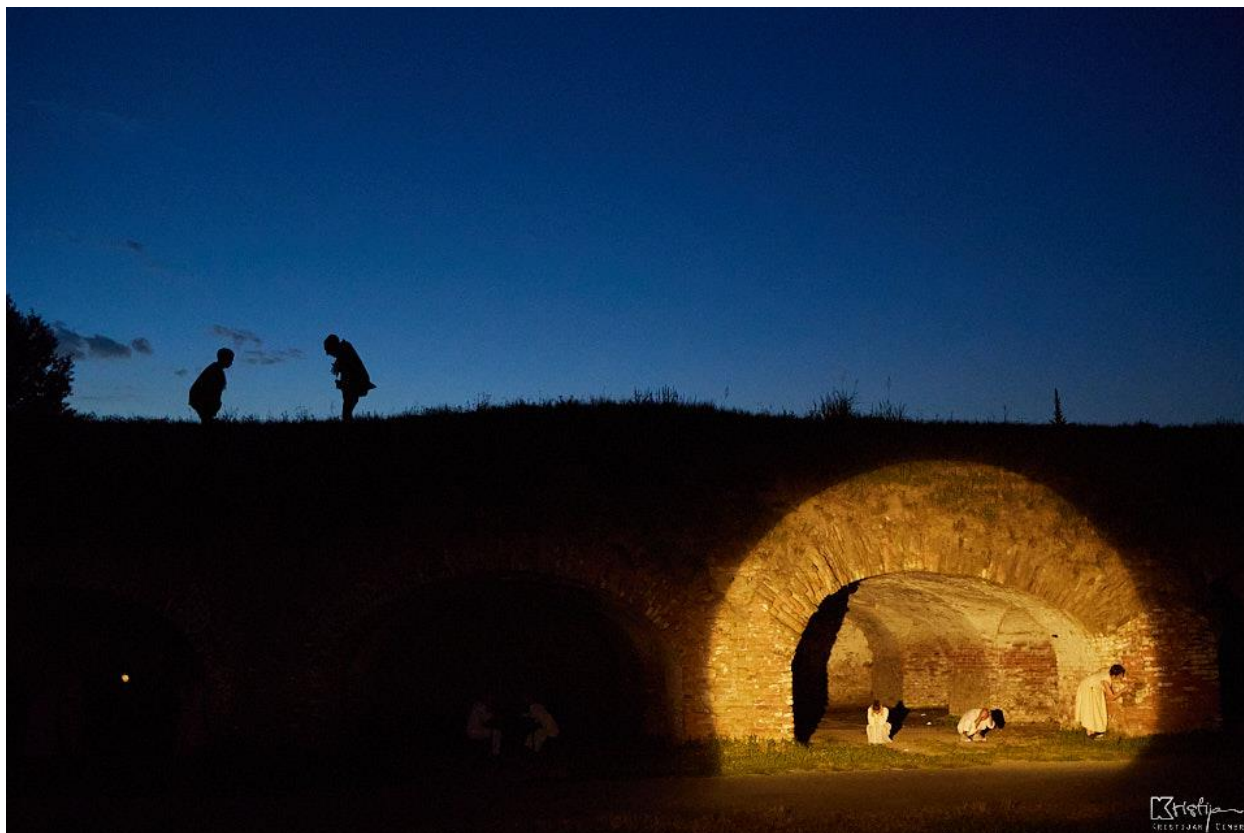
Slika 4: Prva scena – Gigantske lutke i scene unutar lukova katakombi

“Kada nije arhitektonski trajno određen nego je za svaku posebnu priliku drugi i drugačiji, kada uz to nije namjenski, pozorišni scenski prostor je tzv. ambijent : neki trg, ulica, obala ili bilo što drugo što oni koji o prostoru odlučuju izaberu kao mjesto izvođenja predstave. Ambijent nije tehnički opremljen, niti je zvučno i svjetlosno izolovan od spoljenog svijeta. Određen je kao mjesto akcije i funkcionalan onoliko koliko je to sam po sebi, scenografske intervencije na njemu su minimalne ili nikakve.” 4