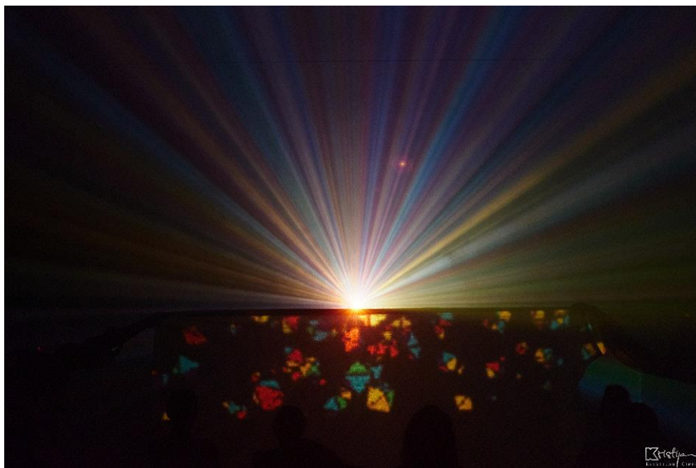
Slika 13: Šesta scena: Projekcija šara svjetlosti

“vizualno: glumačka igra, ikoničnost pozornice, scenografija, scenske slike;” 11