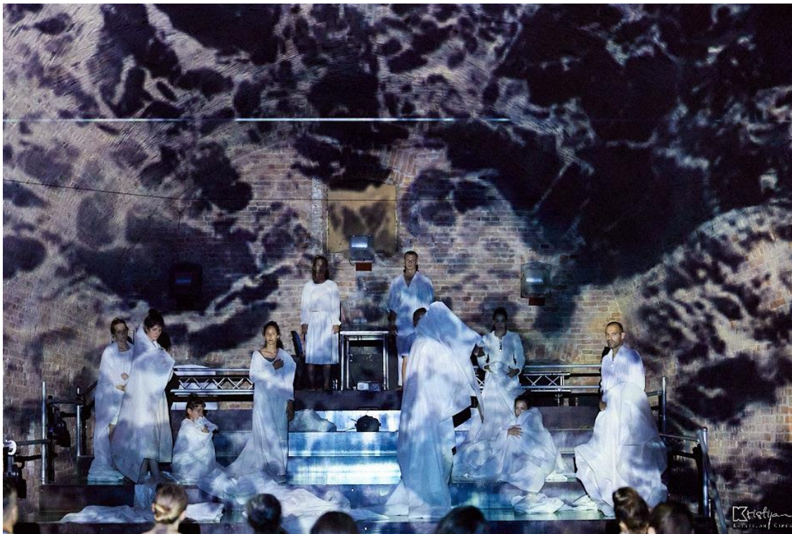
Slika 6: Druga scena - Buđenje

“Poslanje gledatelja je biti promatrač, ali više – biti svjedok. Svjedok nije netko tko svuda zabada nos, tko se trudi biti najbliže ili se ubacivati u radnju drugih. Svjedok se drži ponešto sa strane, ne želi se miješati, želi biti svjestan i vidjeti to što se događa od početka do kraja, kao i sačuvati to u pamćenju; slika događaja treba ostati u njemu samome.” 5