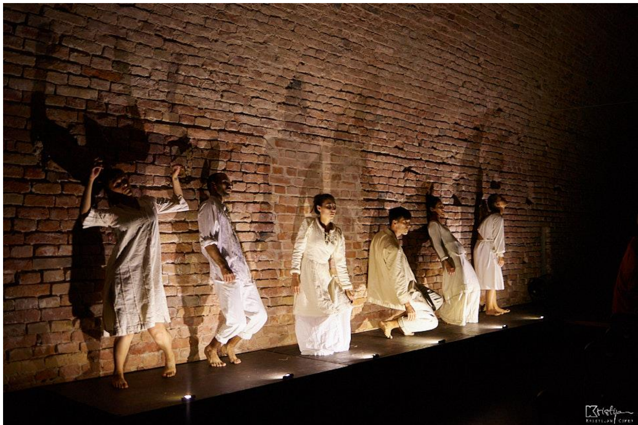
Slika 7: Treća scena - Streljanje

“Glumci, isto tako, mogu djelovati između gledatelja ne videći ih, gledajući kroz njih kao da su od stakla; mogu između gledatelja unositi konstrukcije i ne uključivati ih u akciju već više u arhitekturu akcije, davajući im vizualni smisao ili im smanjivati prostor preko njegovog zgušnjavanja i ograničavanja.” 6