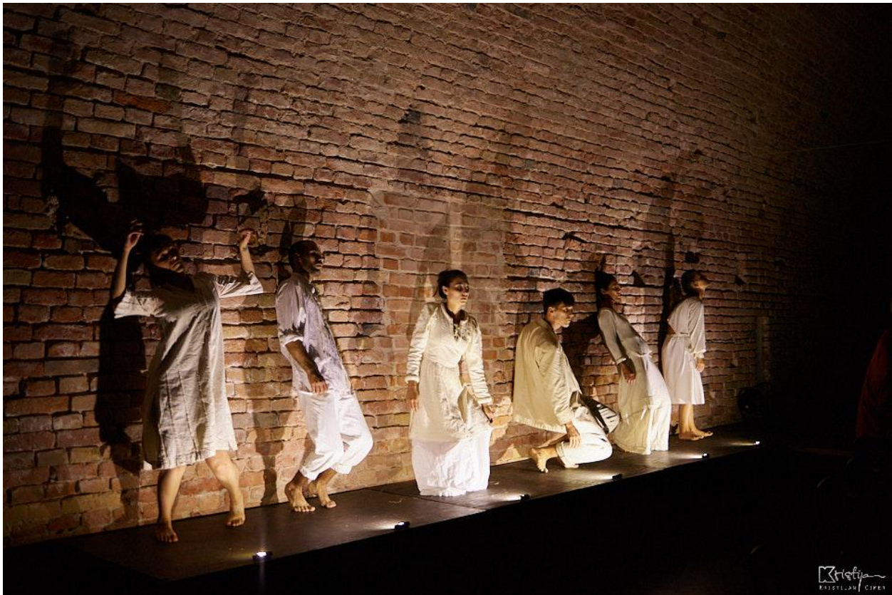
Slika 7: Treća scena - Streljanje

“Glumci, isto tako, mogu djelovati između gledatelja ne videći ih, gledajući kroz njih kao da su od stakla; mogu između gledatelja unositi konstrukcije i ne uključivati ih u akciju već više u arhitekturu akcije, davajući im vizualni smisao ili im smanjivati prostor preko njegovog zgušnjavanja i ograničavanja.” 6