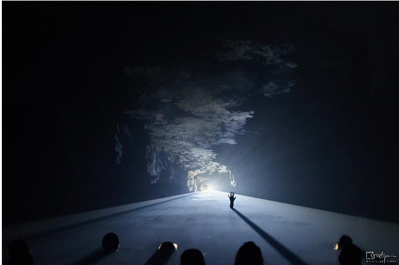
Slika 14: Šesta scena - Crna kutija

u onostrani svijet. Prostorija se postupno u potpunosti ispunjava dimom stvarajući maglovitu atmosferu tajanstvenosti. Nakon što je cijela prostorija ispunjena dimom nastaje mrak, nakon kojeg projekcija stvara “crnu kutiju”.