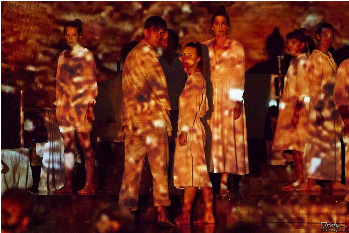
Slika 9: Četvrta scena - Osuda

U sljedećoj smo sceni postavili cilj naglasiti kontrast i brzinu moguće promjene između sklada i razora odnosa među ljudima. Kako bismo to postigli, koristili smo se različitim razinama tribina primjenjujući žuto, bijelo i crveno svjetlo kao ključne elemente vizualnog prikaza promjene među ljudima. Žuta rasvjeta simbolizirala je trenutke i osjećaje harmonije unutar skupine, međusobno razumijevanje, zajedničko sudjelovanje u aktivnostima, dijeljenje smijeha i pružanje potpore jedni drugima. Zaustavljanjem žutog svjetla i prijelazom na bijelo svjetlo označili smo kraj trenutaka sklada i suradnje. Pod bijelim smo svjetlom stajali nepomično, s pogledima usmjerenima prema publici, čime smo metaforički prikazali osudu svih nas koji pasivno promatramo svijet i sukobe oko sebe ne poduzimajući konkretne korake za promjenu. Nakon bijelog, palilo bi se crveno svjetlo koje je označavalo trenutke sukoba i borbe.