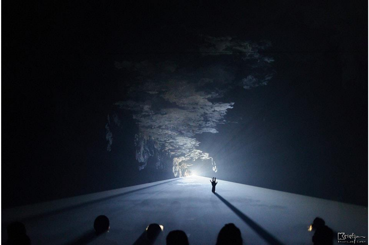
Slika 14: Šesta scena - Crna kutija

u onostrani svijet. Prostorija se postupno u potpunosti ispunjava dimom stvarajući maglovitu atmosferu tajanstvenosti. Nakon što je cijela prostorija ispunjena dimom nastaje mrak, nakon kojeg projekcija stvara “crnu kutiju”.