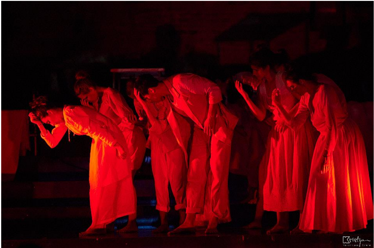
Slika 15: Kostimi

Naglasak je cjelokupnog ispita na efektном, naglašenom i raznovrsnom vizualu izvedbe - od gigantskih lutki, iskorištavanja različitih scenskih prostora do raznolikih kazališnih formi kao što su ambijentalno kazalište, vizualni teatar i teatar sjena. Zbog jačine tih elemenata odlučili smo se na minimalizam kostimografije i scenografije. Izbor bijelih, neutralnih kostima simbolizira čistoću i nevinost žrtava rata. Također je njihova nježna, bijela boja koristila kao svojevrsno bijelo platno na kojem se svjetlost reflektora i projekcija jače naglašavala. Uz njih, služili smo se bijelim plahtama različitih veličina i oblika, koje su rabile kao višenamjenski elementi, ponekad djelujući kao kostimografija (u drugoj sceni imaju funkciju kostima ljuštore leptira), dok se u drugim trenucima pretvaraju u jedinstvenu scenografija (u četvrtoj su sceni u funkciji dječjeg užeta za preskakanje).