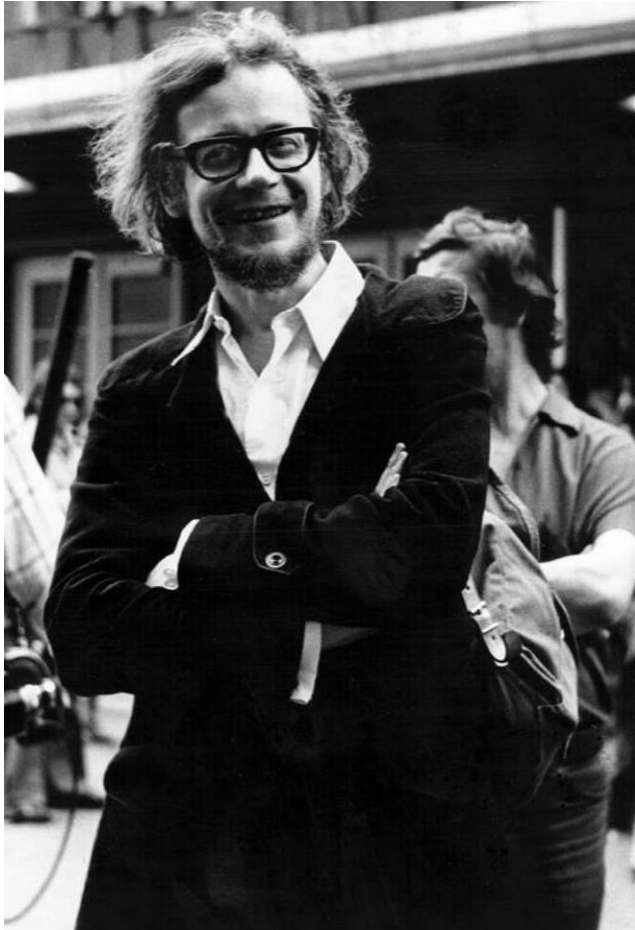
Slika 10: Jerzy Grotowski

Rabeći elemente i tehnike podrške fizičkog teatra Jerzya Grotowskog, prikazivali smo dramatične situacije i njihove posljedice. Izmjenom i repeticijom tih scena svjetlosnim smo promjenama gradirali zaoštavanje situacije i pojačavali pokrete unutar scena.