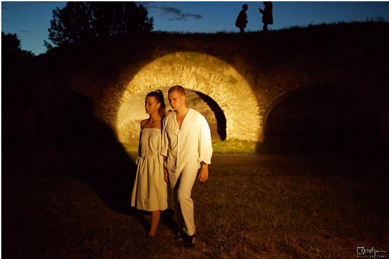
Slika 5: Prva scena - Odlazak u kolonu

veliku, vizualnu atrakciju gigantskih lutaka naglašavajući glavni značaj, snagu i veličinu utjecaja političara na sami rat. U katakombama smo reflektorima kadrirali scene ljudi koji se pripremaju za nadolazeći rat, a iznad njih političare kako veselo i zadovoljno reagiraju na tugu i očaj bespomoćnih ljudi. Scena završava mladićevim odlaskom u rat i djevojčinim odabirom praćenja njega u nepoznato. Djevojku u rat odlučuje slijediti i ostatak skupine oblikujući dugačku kolonu, odnosno izbjeglištvo. Bez riječi i doslovnog poziva u kolonu, uspjeli smo u publici probuditi osjećaj nesigurnosti, dezorijentiranosti i neodlučnosti trebaju li se pridružiti i postati dio „naše” kolone, kolone koja se u povijesti neprestano ponavlja. Nakon publikina prihvaćanja i dolaska u koloni smo zajedno ušli u prostor Barutane, gdje se nastavila odvijati izvedba.