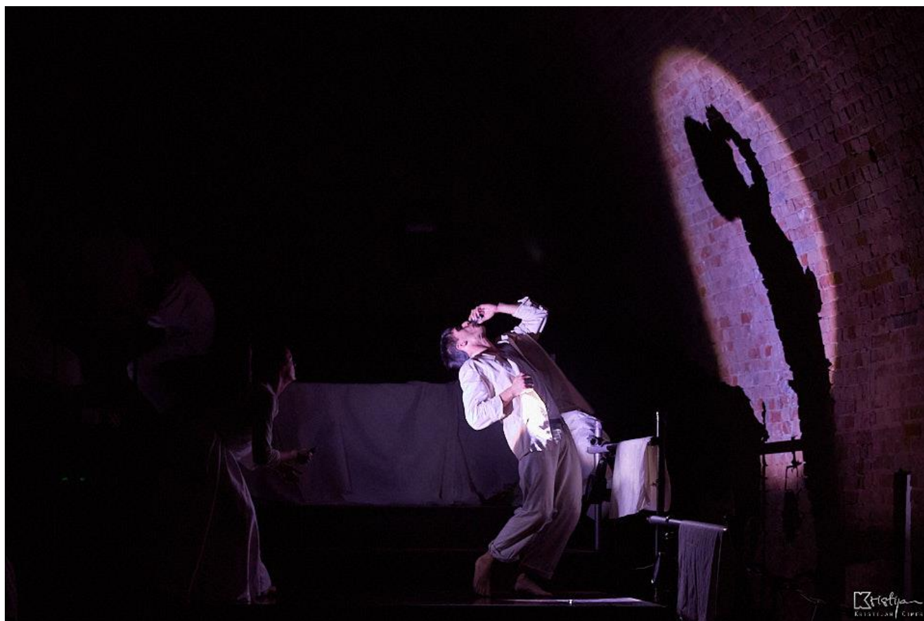
Slika 12: Peta scena - Teatar sjena

“Kao čudesni materijal čijoj fluidnosti i podatnosti nema premca, svjetlo daje tonaliteta prizoru, modalizira scensku radnju, nadzire ritam predstave, osigurava prijelaz između različitih momenata, koordinira ostale scenske sustave, povezujući ih ili izolirajući.” 10