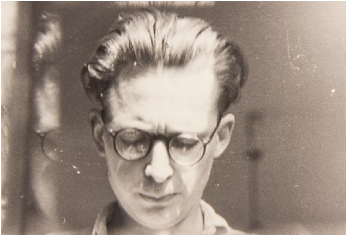
Slika 1: Andrzej Wróblewski

Velika inspiracija u stvaranju Kolona... opet bio nam je Andrzej Wróblewski, poljski slikar rođen 1927. godine u Poljskoj. Jedan od najpoznatijih umjetnika poslijeratnog razdoblja u Poljskoj, koji je bio istaknut i prepoznatljiv po svojemu jedinstvenom stilu i izrazitoj umjetničkoj viziji. Njegova su djela često bila introspektivna i intimna prikazujući ljudsku figuru i psihološke elemente. Wróblewski je stvorio niz slika koje su se bavile poslijeratnim traumama i iskustvima, te je njegova umjetnost često bila produktom istraživanja posljedica rata na društvo i ljudsku psihu.