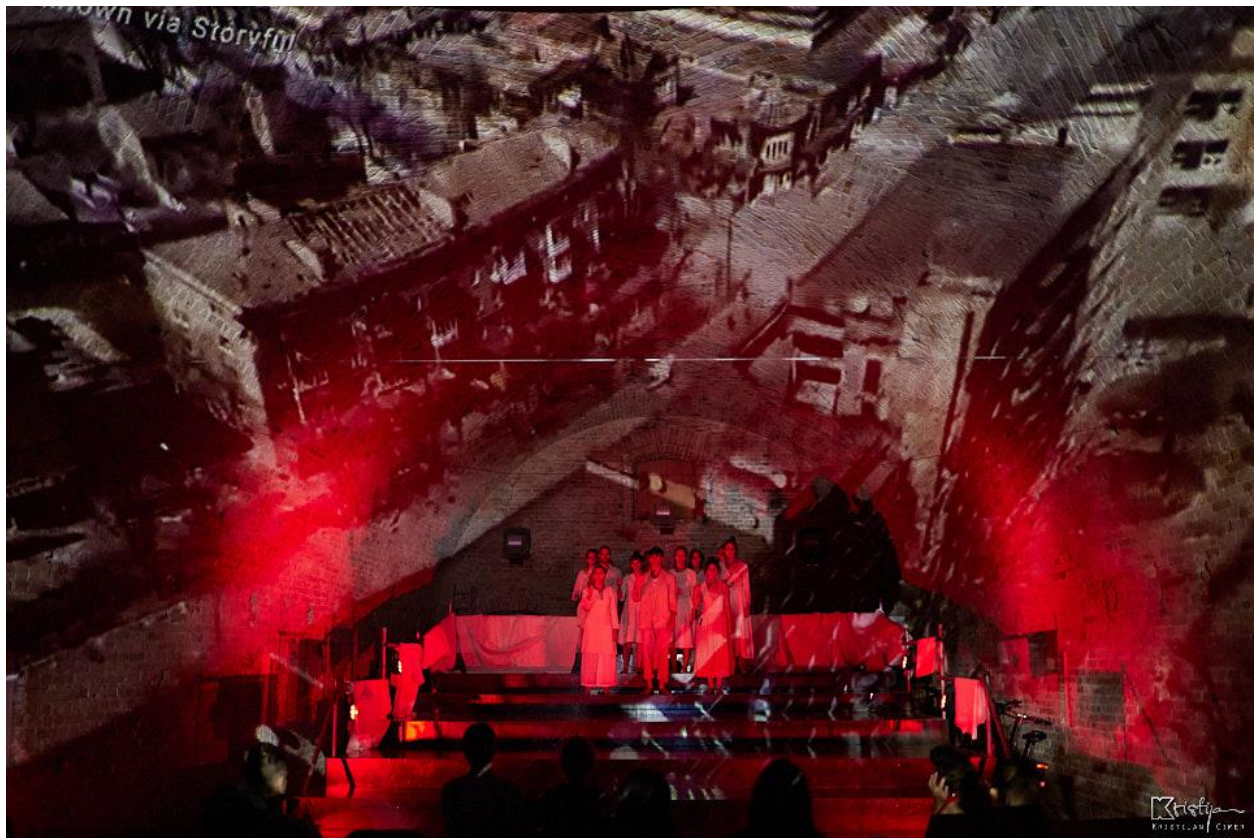
Slika 8: Treća scena - Projekcije razrušenih gradova

“Projekcije zadovoljavaju sve moguće dramaturgijske funkcije: efekt ugođaja, verbalno očuđenje, slike ili ilustracije, sučeljavanje živog i imaginarnog...” 7