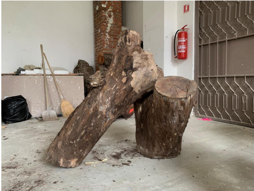
Slika 5. Oslonac - polazna točka, 2022., drvo