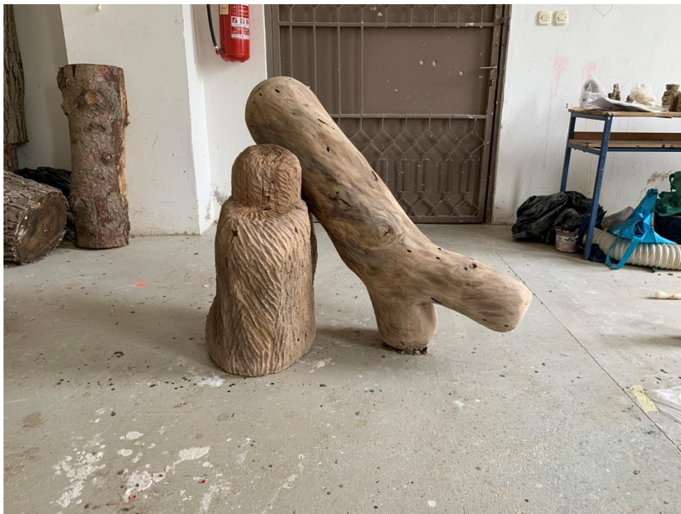
Slika 6. Oslonac, 2023., drvo