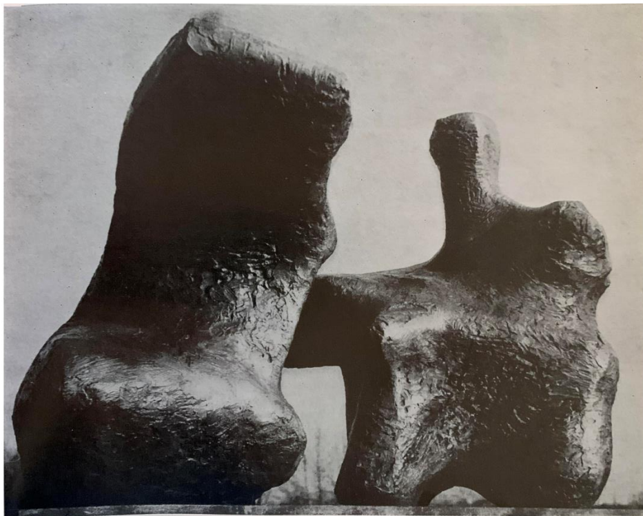
Slika 1. Henry Moore, Figura u dva dijela u ležećem položaju, 1959., bronca

drveta. Također, Moore u ovom djelu prikazuje oblike u ležećem položaju dok su oblici u djelu „Oslonac“ prikazani u stojećem položaju.