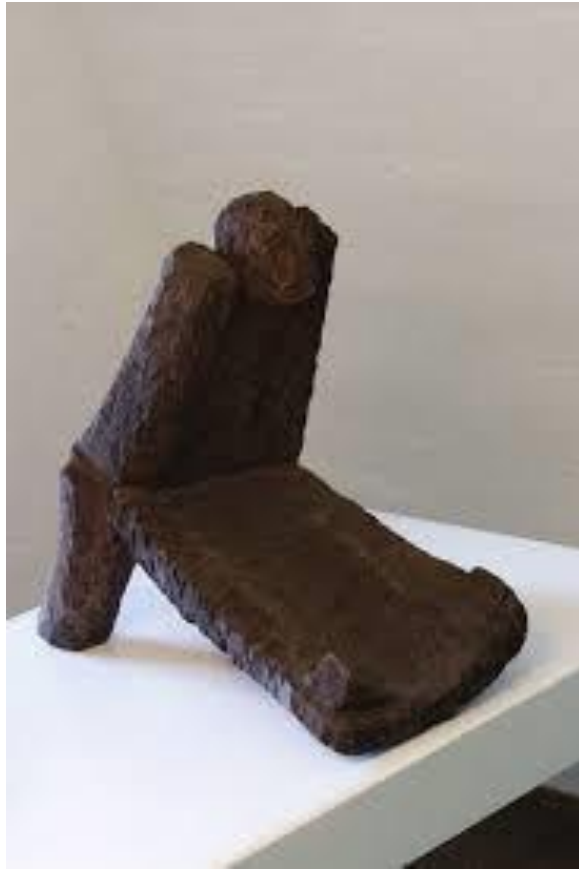
Slika 2. Branko Ružić, Kolica/Hand cart, 1987., drvo