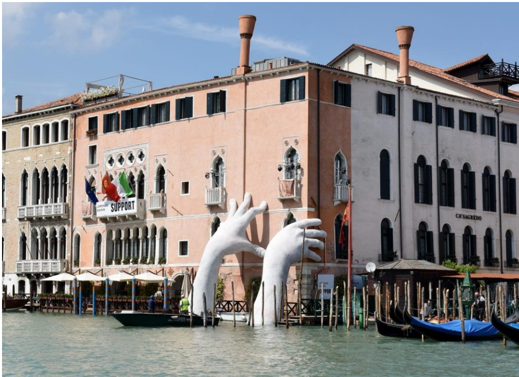
Slika 3. Lorenzo Quinn, Support, 2017., poliesterska smola