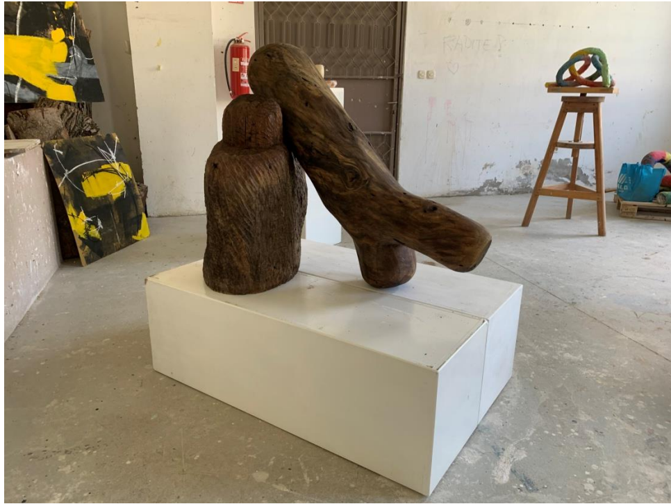
Slika 7. Oslonac - gotov rad, 2023., drvo