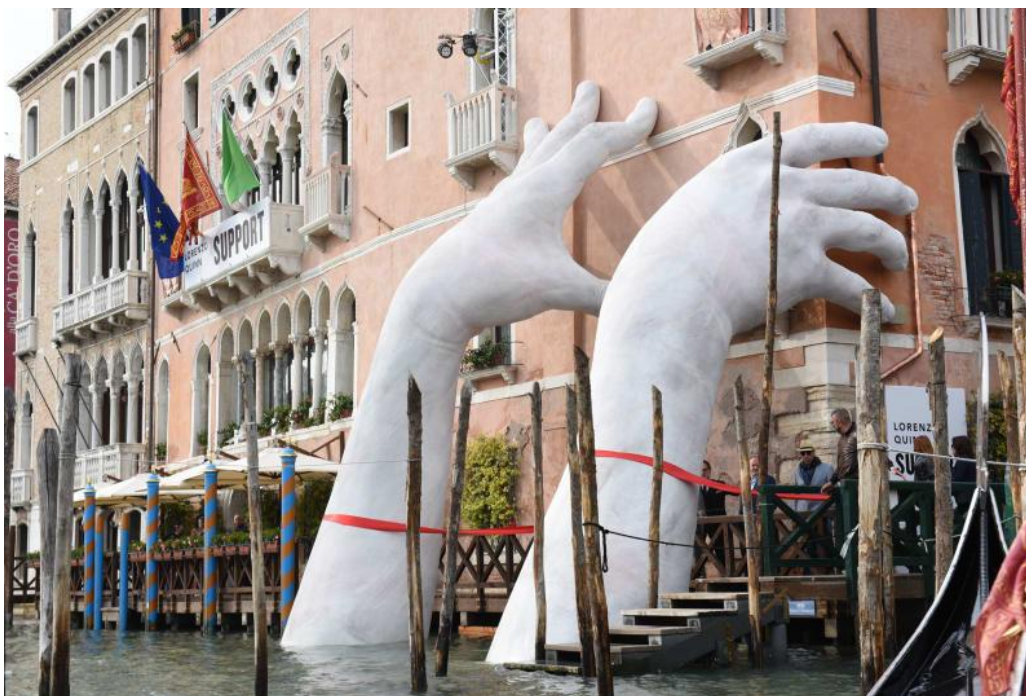
Slika 4. Lorenzo Quinn, Support, 2017., poliesterska smola