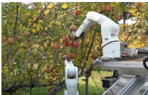
Slika 4 Robot za berbu