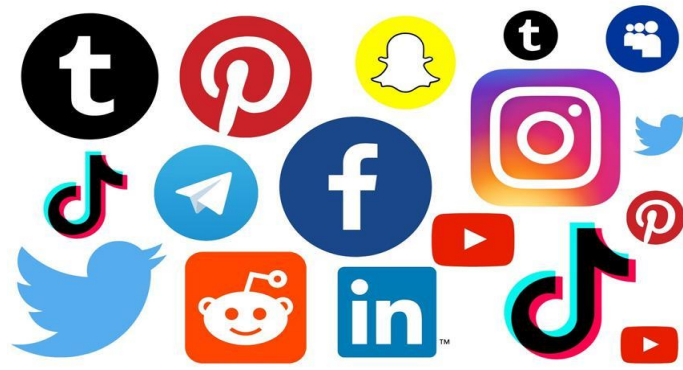
Slika 2 Prikaz nekih od najpoznatijih ikona društvenih mreža