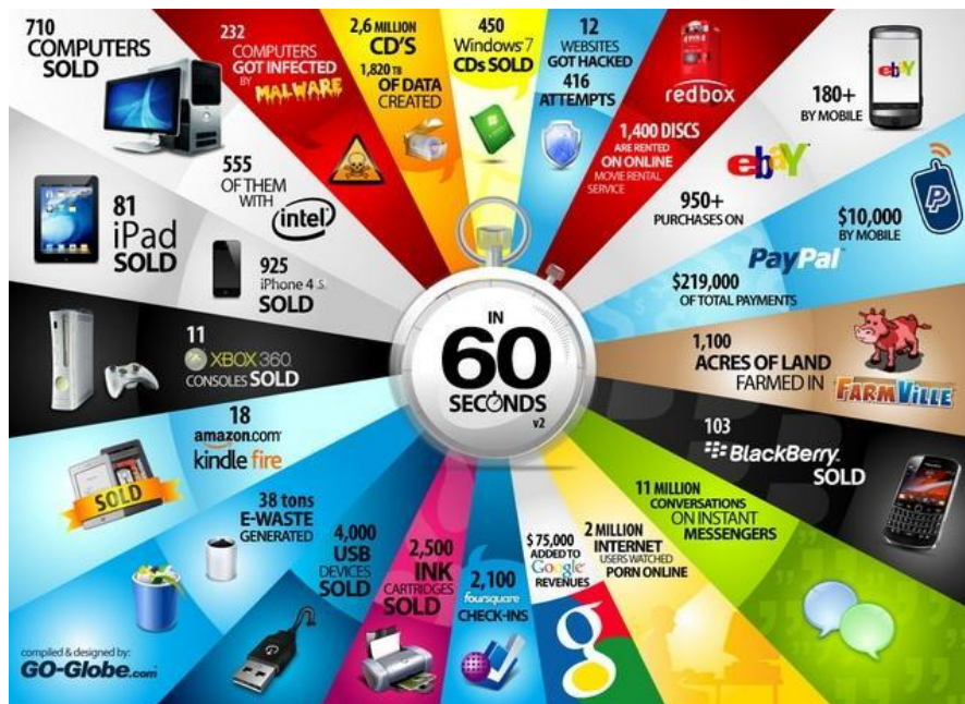
Slika 1 Prikaz onoga što se događa u jednoj minuti na internetu 2021. godini

„Broj aktivnih korisnika interneta i društvenih medija u stalnom je drastičnom porastu, pa je u travnju 2020. godine broj aktivnih korisnika interneta dosegao brojku od 4,57 milijardi, što je oko 59 % ukupnog broja svjetskog stanovništva tj. 7,79 milijardi (Worldometers, 2020).“ (Babić, T. 2021:18)