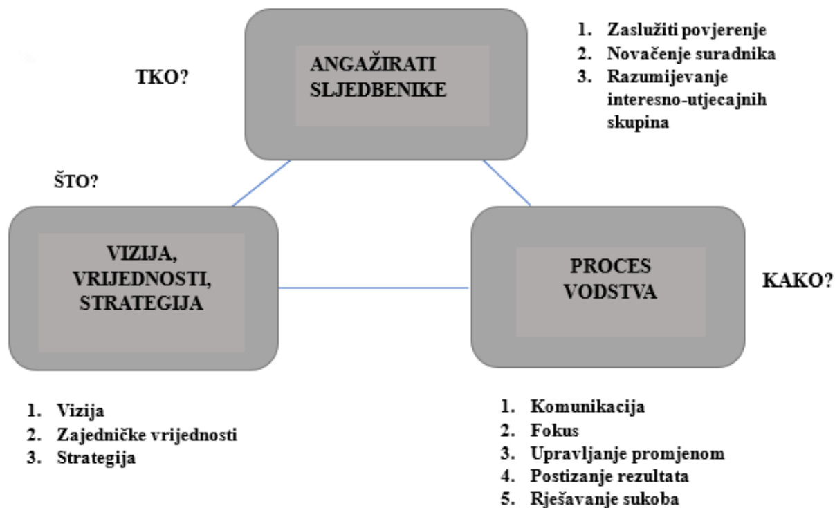
Slika 1. Elementi vodstva