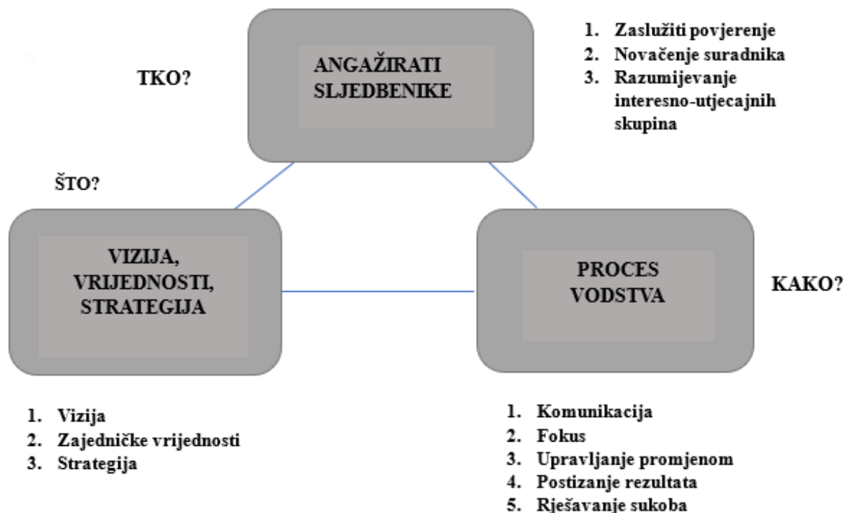
Slika 1. Elementi vodstva