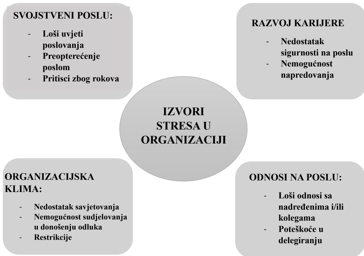
Slika 3. Izvori stresa u organizaciji

Na slici broj 3., Stranks (2005.) je naveo ključne izvore stresa među brojnim mogućnostima koje mogu izazvati stres unutar organizacije.