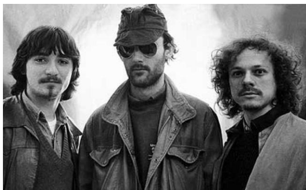
Prilog 5. Azra: Mišo Hrnjak, Branimir Johnny Štulić i Boris Leiner