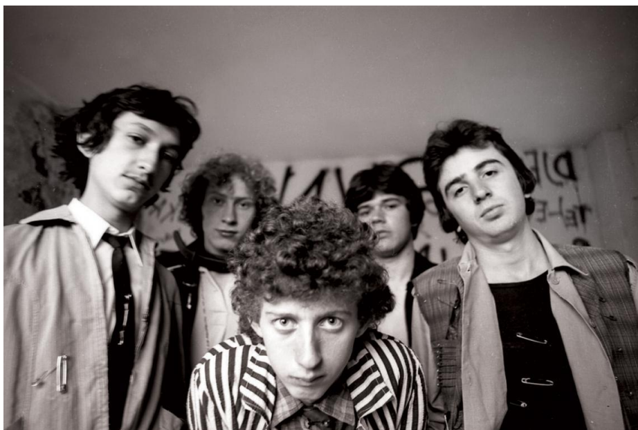
Prilog 4. Prljavo Kazalište

drugu singlicu Moj je otac bio u ratu/Noć , a svojom produkcijom i sviranjem pomaže im novovalni glazbenik Ivan Piko Stančić. Godine 1979., izdali su istoimeni album koji je doživio velik uspjeh, a na taj se album plaćao i tzv. porez na šund (koji je određivala šund komisija). Ovaj je album prepun društvenih kritika i provokativnih tema, npr. u jednoj od pjesama govori se o homoseksualnosti. Album su dodatno promovirali kad su na Tašmajdanu u Beogradu nastupili kao predgrupa Bijelom Dugmetu. Krajem 1979., bend se okreće novom pravcu, novom valu, u kojemu u fokus stavljaju svoje glazbeno stvaralaštvo. Mijenjaju i modni izričaj te nastupaju pred sve većom publikom. Krajem 1980. godine, izdaju album Crno bijeli svijet , kojeg je obilježio ska zvuk. Prodan je u 180 000 primjeraka, što je dotad najveći komercijalni uspjeh novog vala u Jugoslaviji. Bend postaje sve popularniji, što teško podnosi pjevač Davorin Bogović, koji zbog toga napušta bend, a ulogu pjevača na trećem albumu Heroj ulice iz 1981. godine, preuzima Jasenko Houra. Prljavci su na ovom albumu više okrenuti standardnom rocku.