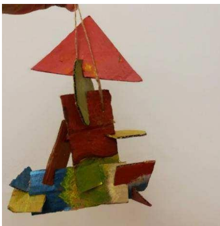
Prilog 7. Dječji mobil prema slici umjetnika Kazimira Maljeviča Supermatističke kompozicije iz 1916.god.

Preuzeto sa Internet stranice. URL: https://artsandculture.google.com/asset/suprematist-composition-kazimir-malevich/3gEa_AWAHpuU9A Pristup: (23.6. 2023)