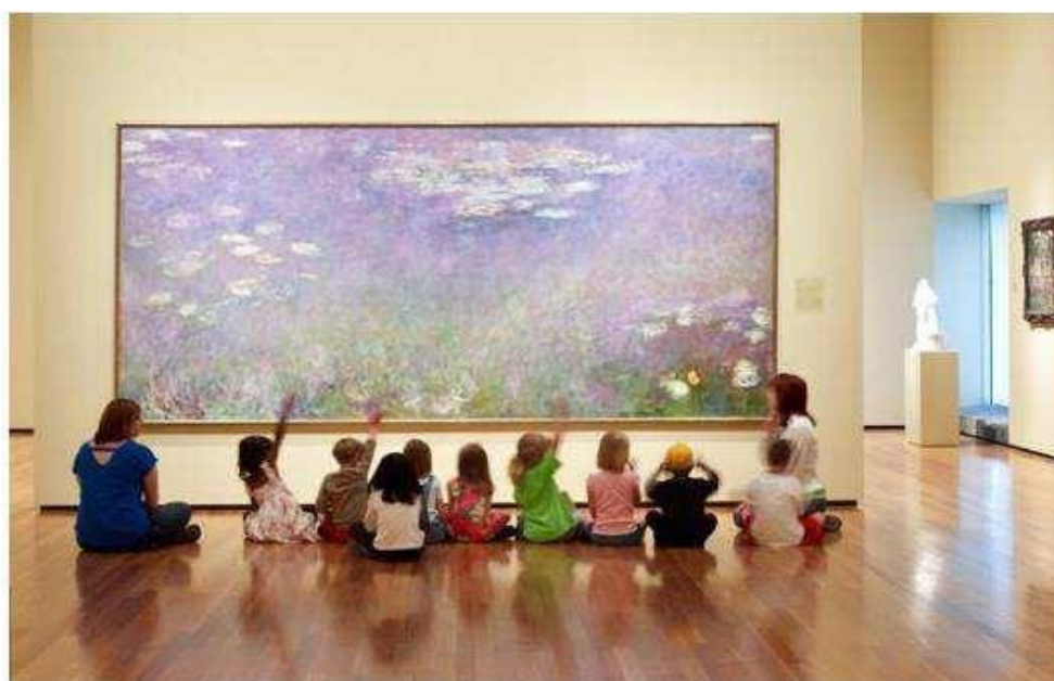
Prilog 3. Djeca u muzeju; promatranje i analiziranje umjetničkog djela.