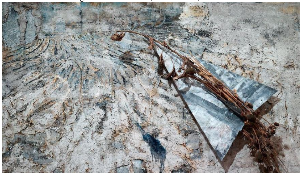
Prilog 8. Anselm Kiefer, Sunce-brod, 1984/1995.

Preuzeto sa Internet stranice. URL: https://www.guggenheim-bilbao.eus/en/the-collection/works/sun-ship Pristup: (23.6. 2023.)