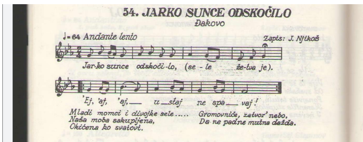
Slika 7. Napjev iz Đakova.

Većina europskih naroda objavljuje svoje narodne pjesme uvijek iznova u bezbrojnim znanstvenim i popularnim izdanjima, a u nas se narodne pjesme pogotovo narodne melodije objavljuju u manjoj mjeri. Taj nedostatak osjećaju podjednako naše škole, amaterski i profesionalni ansambli, kao i ostali ljubitelji tradicijske glazbe. U nastojanju da se ispuni ova praznina Savez muzičkih društava i organizacija Hrvatske odlučio je izdavati zbirke izvornih narodnih pjesama. Taj rad započinje objavljivanjem pjesama iz Slavonije, jednako voljenih i u drugim našim krajevima. Sakupljene od najpoznatijih melografa većina pjesama ovog izdanja potječe iz različitih rukopisnih zbirki koje se čuvaju u Institutu za etnologiju i folkloristiku u Zagrebu, da bi bile dostupne znanstvenoj obradi. Zahvaljujemo i na ovom mjestu Institutu za dozvolu da se koristimo njegovim arhivskim materijalom za ovo popularno izdanje, koje sadrži, osim još neobjavljenih pjesama, i nekoliko zapisa starije generacije melografa već ranije objavljenih kao i pojedine pjesme iz takvih zbirki, koje su sačuvane još u samo malom broju primjeraka i zbog toga teže pristupačne javnosti. (Stepanov - Furić, Narodne pjesme i kola iz Slavonije 1963.)