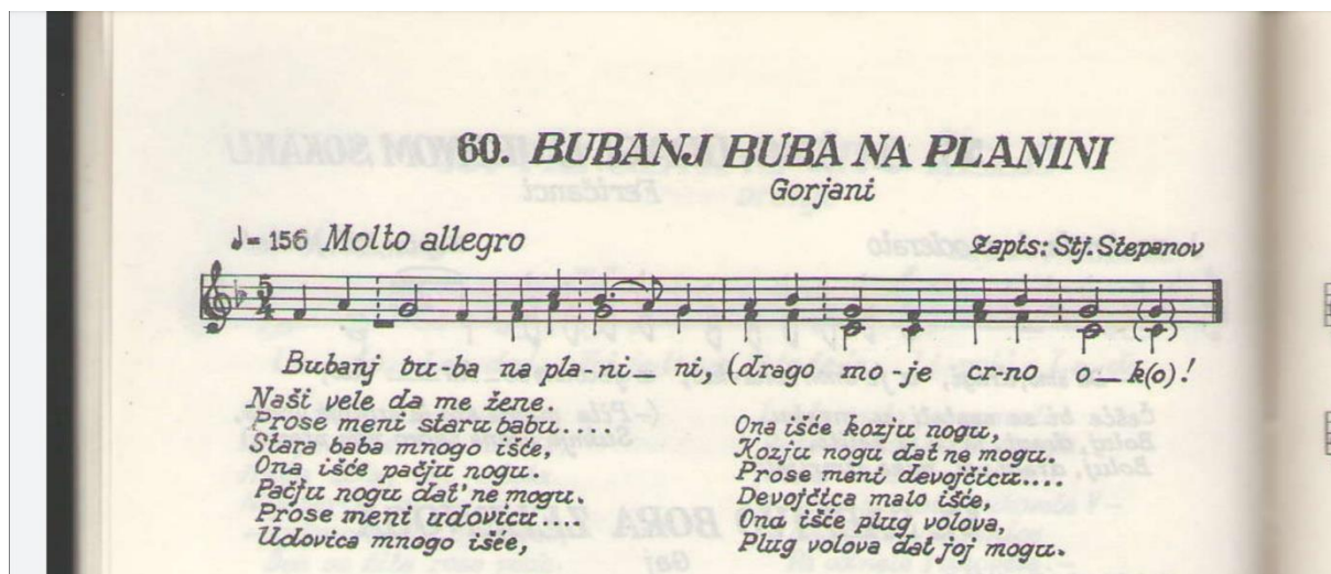
Slika 8. Napjev iz Gorjana

Zaključno, htjeli bismo istaknuti da su sakupljači pripremili obraditi pojedine pjesme iz ove zbirke bilo za pjevačke zborove (dječje - ženske, muške, mješovite), bilo za tamburaške i druge instrumentalne ansamble, ili pak za pjevačke zborove kombinirano s orkestralnim sustavima (Stepanov - Furić, Narodne pjesme i kola iz Slavonije 1963.)