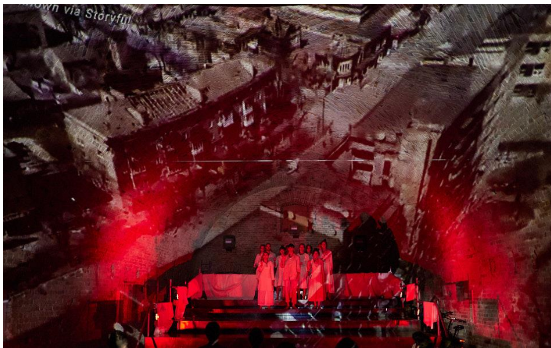
(Slika 5. Četvrta scena)