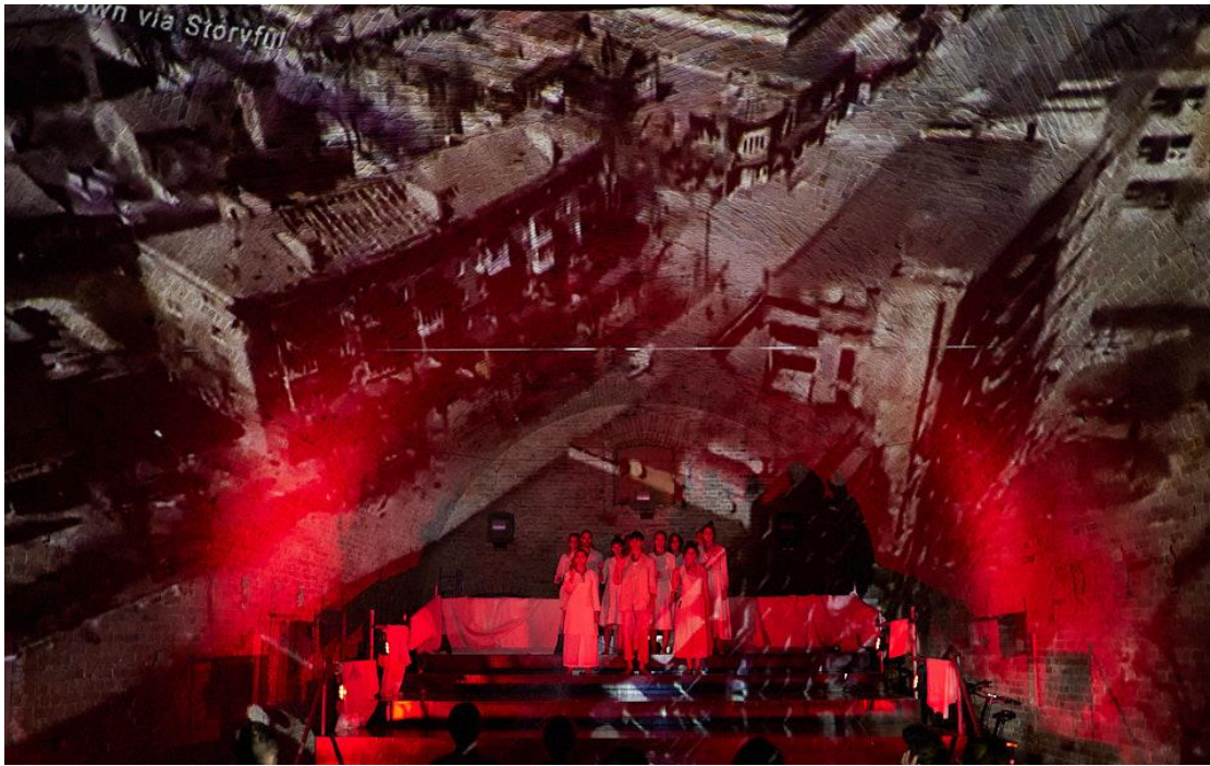
(Slika 5. Četvrta scena)