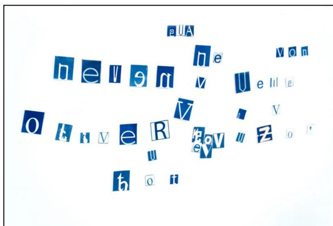
Slika 3. Fotografija manjeg segmenta

Manji segment se sastoji uglavnom od sličica sastavljenih od različitih fontova, ali uz korištenje svih slova u mojem imenu koja okružuju glavni segment. Takvom uporabom sastavljam nova imena, autodestruktivno razlažem svoj identitet. Jedan od korištenih fontova nema simbol Ć, distinktivno obilježje u mom prezimenu, koje me u mnogobrojnim situacijama navelo na razmišljanje o vlastitom identitetu. Sustav državne uprave pokazao se naročito rigidnim, a slijede ga novčarske institucije- za njih moje prezime ne postoji! Trebam li ja inzistirati na svome prezimenu?!