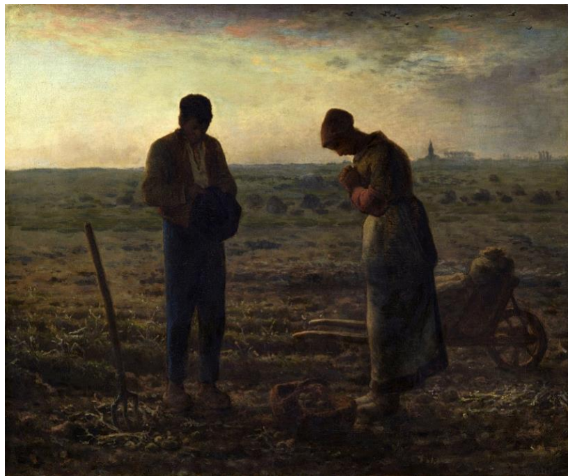
Slika 11. Jean-François Millet, Angelus , 1857. – 1859.