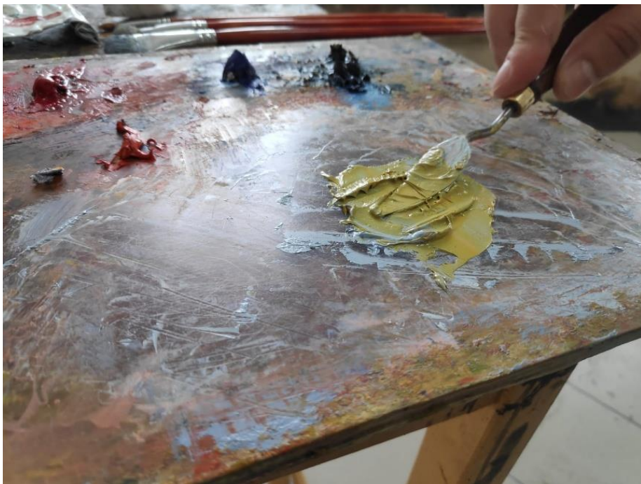
Slika 16. Miješanje boja