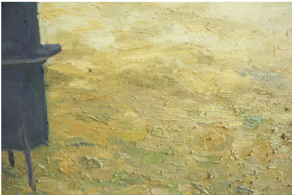
Slika 8. Detalj slike Kolinje