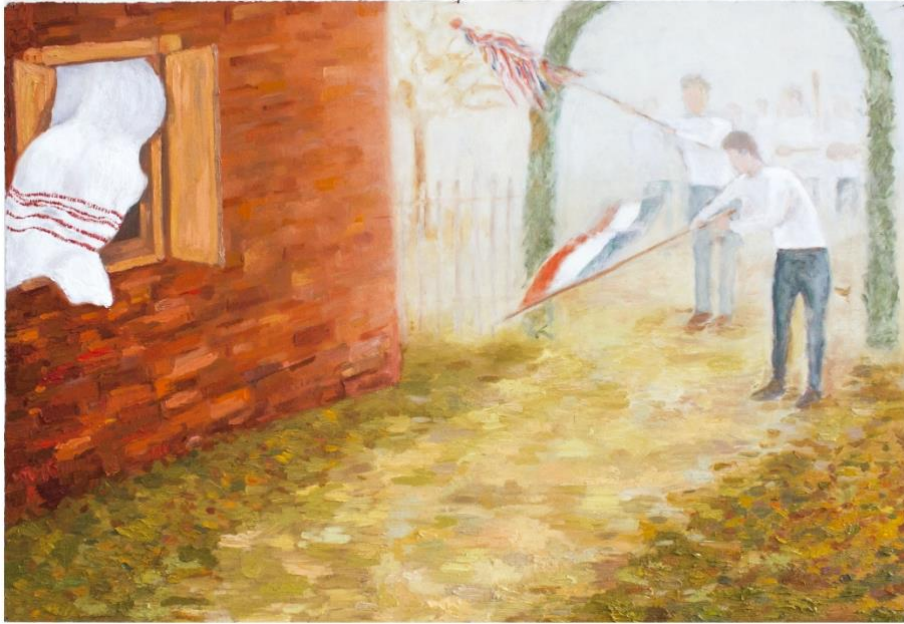
Slika 5. Otvoraj kapiju