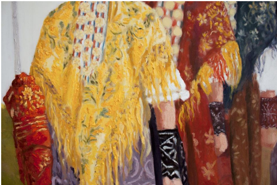
Slika 2. Detalj slike Mi idemo, Ljeljo