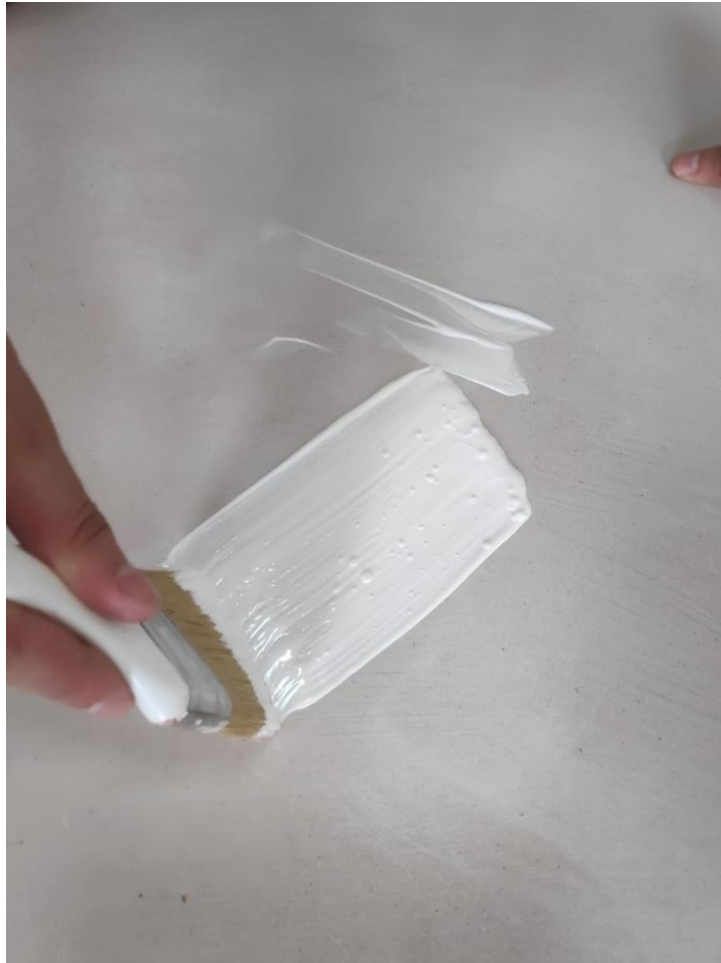
Slika 13. Preparacija medijapana akrilom