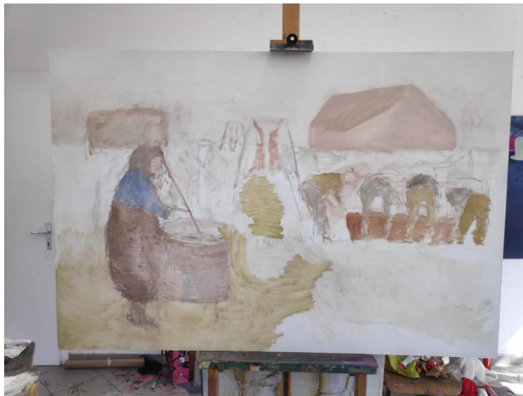
Slika 14. Početak podslikavanja nakon skiciranja ugljenom