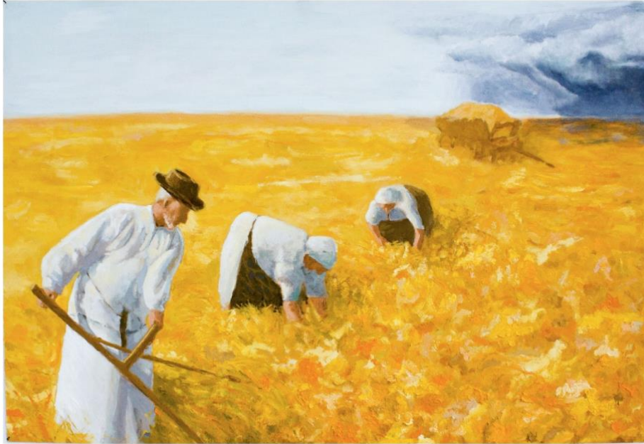
Slika 3. Ej, žito želi