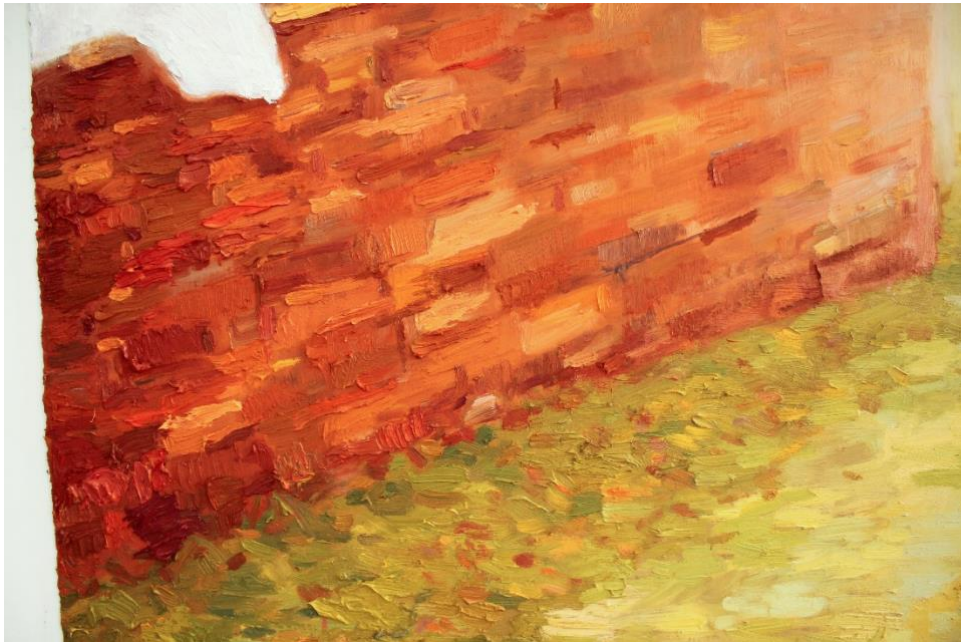
Slika 6. Detalj slike Otvoraj kapiju