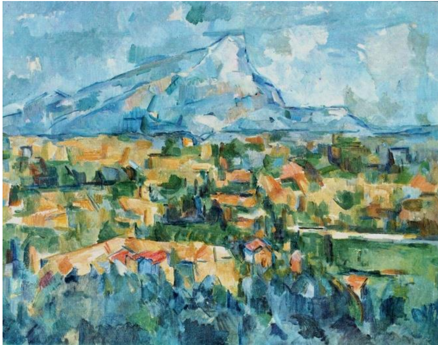
Slika 10. Paul Cézanne, Mont Sainte-Victoire , 1902. – 1904.