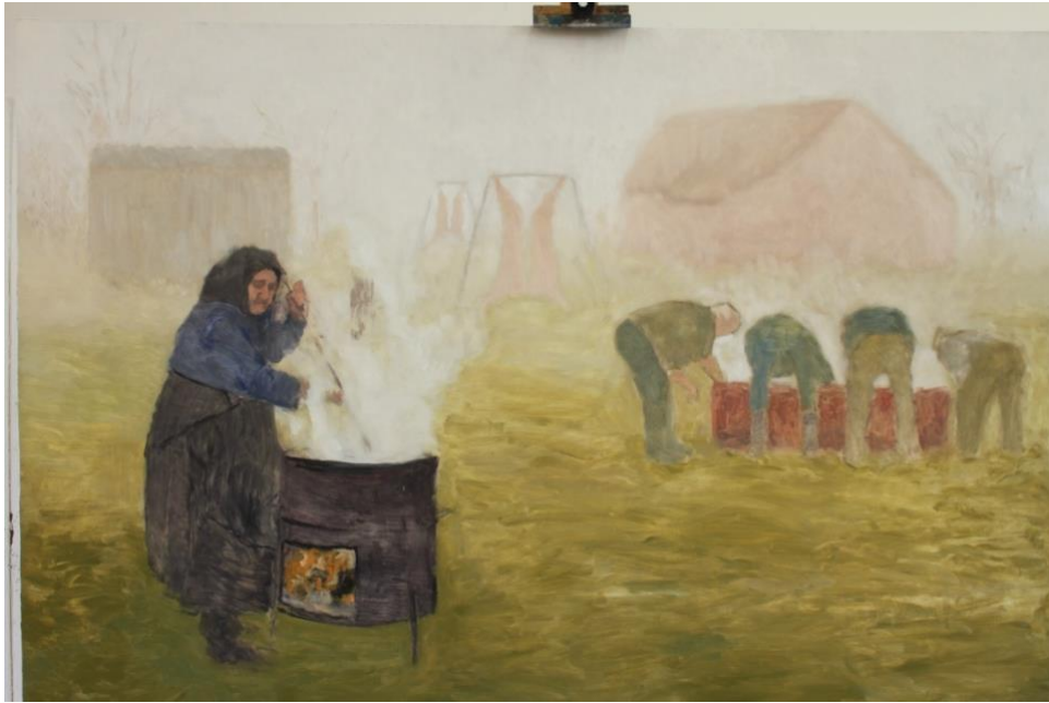
Slika 15. Slika nakon podslivanja