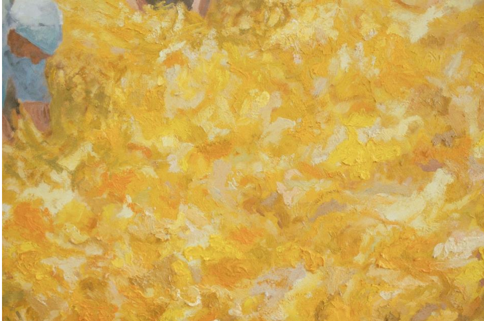
Slika 4. Detalj slike Ej, žito želi