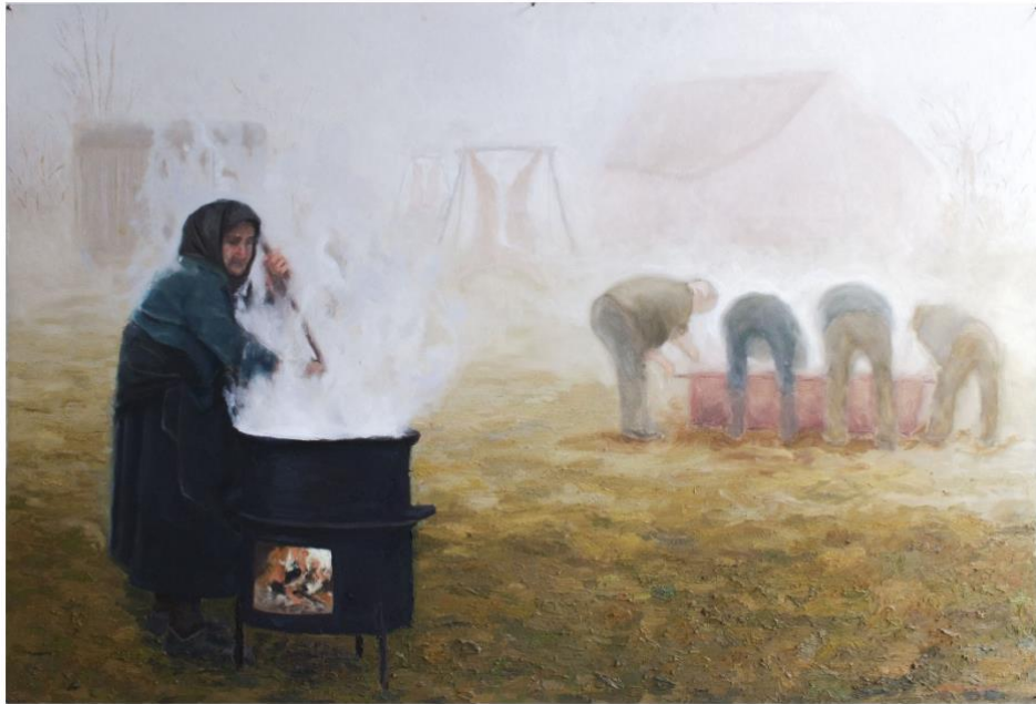
Slika 7. Kolinje