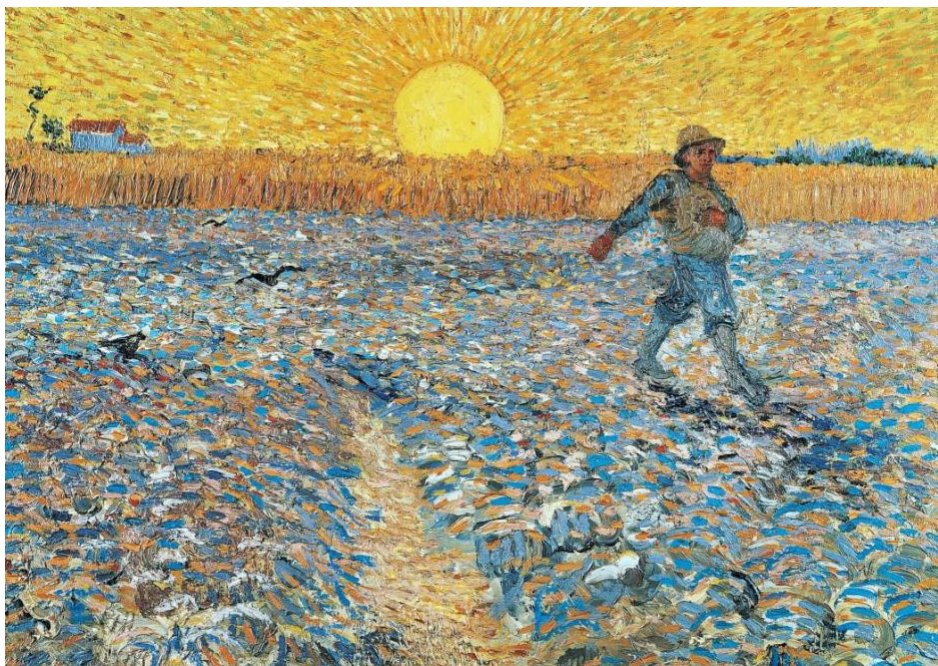
Slika 9. Vincent van Gogh, Sijač , 1888.

Slikar Jean-François Millet je slikar koji me inspirirao tematski jer se bavio seljakom kao glavnim akterom vlastitih slika, a njegov način slikanja pokazuje težinu života seljaka tim tamnim tonovima, a olakšanje dobivaju molitvom kao što slika prikazuje.