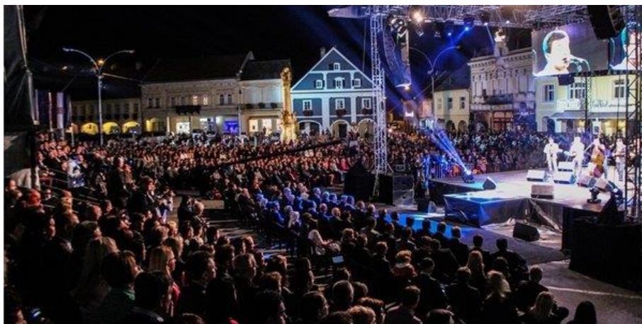
Slika 5.: Aurea fest

To je festival koji je proizašao od festivala "Zlatne žice Slavonije". Festival koji 7 dana i noći pokazuje koliko je zapravo grad bogat poviješću, kulturom i duhom. Donosi 7 dana folkloru i običaja, vina, povijesnih postrojbi, uličnih svirača, mađioničara, plesa i ponajviše glazbe. Od slavonske i tradicijske, disco, pop i rock, pa sve do jazz glazbe. Također, jedna je od najvećih manifestacija u Požegi. 2017. godine u program festivala bilo je čak uključeno i snimanje glazbeno scenskog spektakla HRT-a "Lijepom Našom". ( http://aurea-fest.com/ ) Ovim festivalom njeguje se i promiče zaštita izvorne slavonske glazbe i popularne glazbe s elementima slavonskog melosa i instrumentarija. ( https://www.034portal.hr/index.php ) Aurea fest je najposjećenija i najbolje organizirana požeška manifestacija, a Slika 5. upravo to i prikazuje.