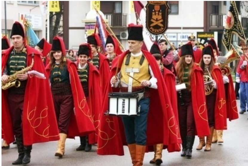
Slika 1.: Svečani mimohod