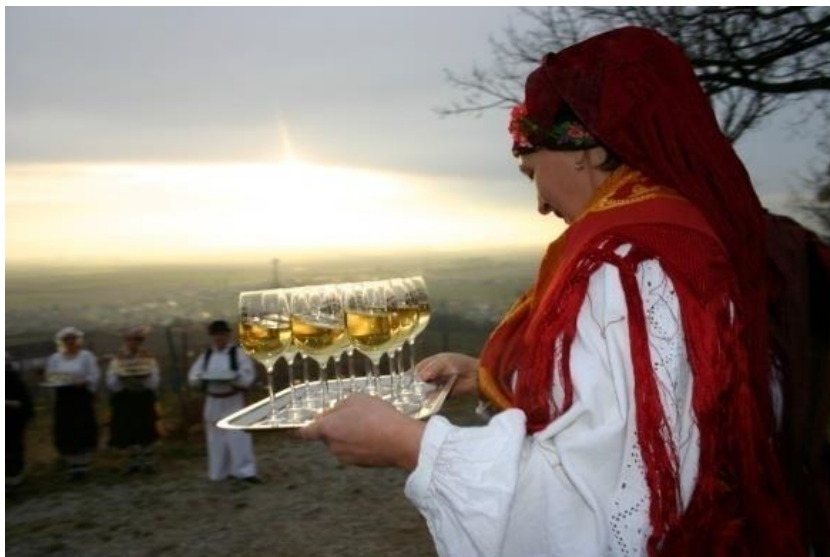
Slika 2.: Nastavak slavlja u vinogradima