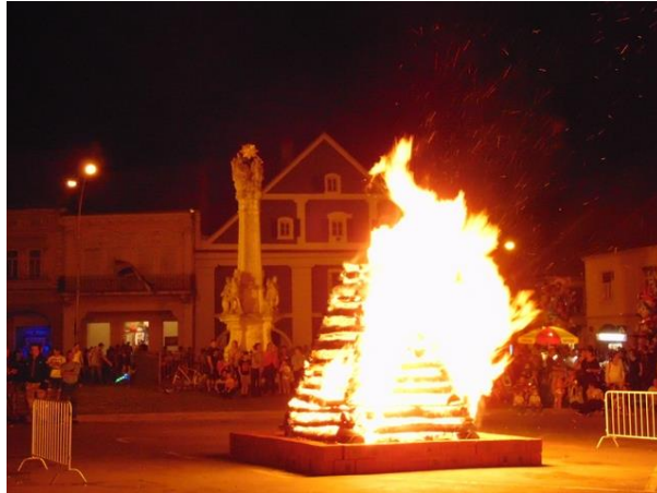
Slika 4.: Paljenje Ivanjskog krijesa