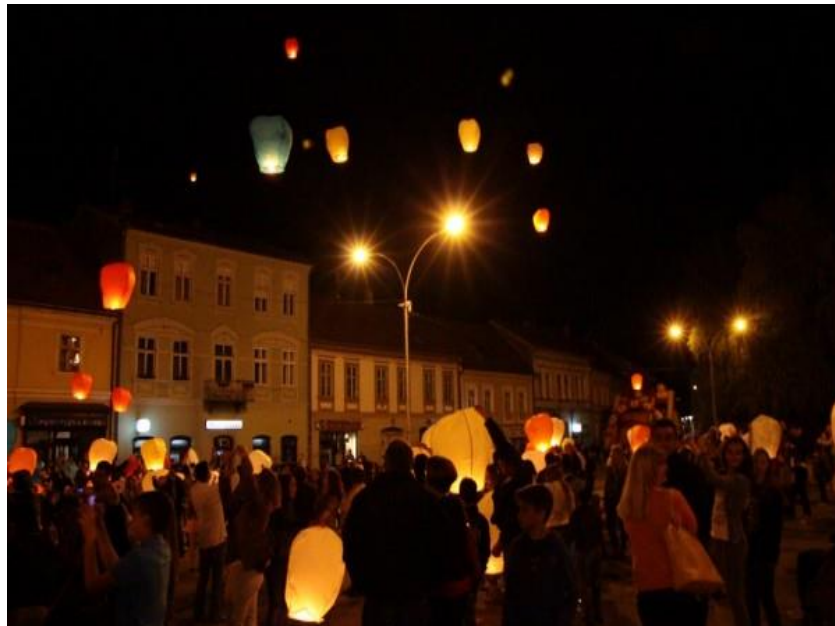
Slika 3.: Puštanje lampiona

Običaj paljenja Ivanjskog krijesa na ljetni solsticij se odvija od 1739. godine na ovim prostorima. Svake godine do kasnih večernjih sati pruža se zanimljiv program svim građanima i gostima. Program započinje popodne kada prvo nastupaju Požeške mažoretkinje, plesne radionice, tamburaški sastavi i tamburaški orkestri. Sudionici programa nisu samo Požežani već su tu uključeni i drugi hrvatski gradovi i stanovnici naših susjednih država. Navečer se uvijek održavaju koncerti poznatih estradnih izvođača, bendova, klapa itd. Zatim kreće tradicionalno paljenje vatre koje je prikazano na Slici 4. te nakon toga zadnje dvije godine održava se i lampionada koja je prikazana na Slici 3. Lampioni želja, kako se nazivaju, podijele se publici tijekom večeri te kasnije dok pale lampion zažele želju i puste lampion koji odleti u nebo. ( https://narod.hr/kultura/obicaji-paljenja-ivanjskog-krijesa )