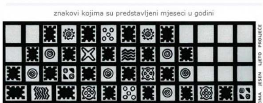
Slika 4. Prilog 2 Simboli s posude za keramičku radionicu