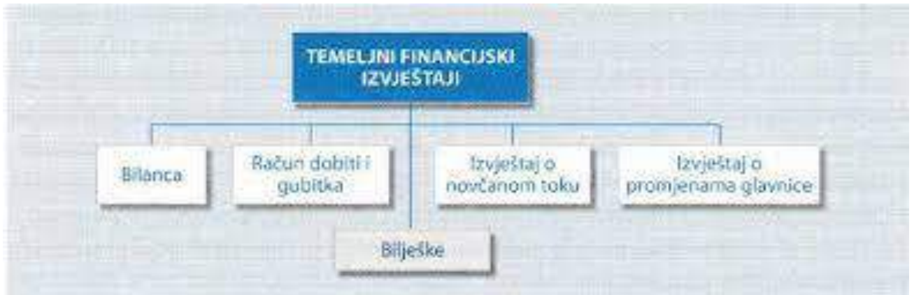
Slika 1: Prikaz temeljnih financijskih izvještaja.

Izvješće o poslovanju koje se prilaže financijskom izvješću ima širi ekonomski pristup, stavlja naglasak na korisnost podataka u procesu donošenja odluka, vodi računa o budućoj perspektivi, uvodi nefinancijske (opisne) informacije i prihvaća subjektivnu prosudbu uprave. Kao rezultat toga, predstavlja dodatak financijskom izvješću, povećavajući njegov informativni kapacitet.