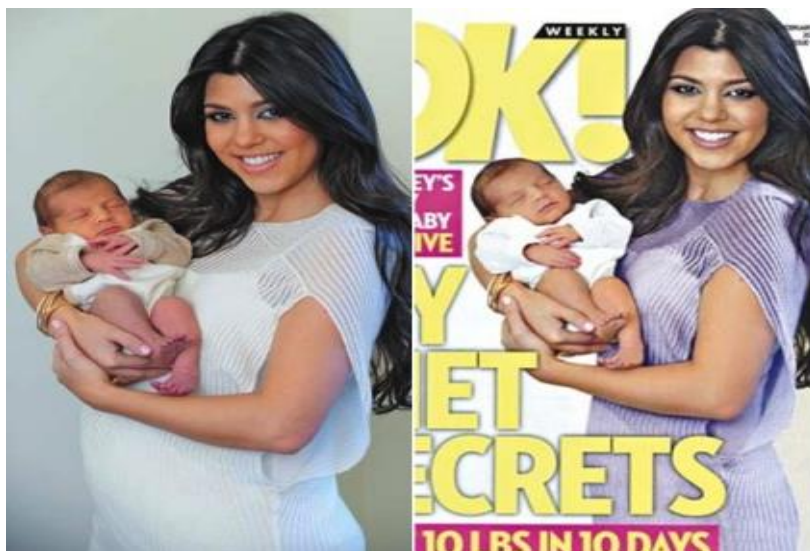
Slika 2. Medijska konstrukcija stvarnosti

Pojednostavljeno, njegov pristup nadilazi običnu dihotomnu podjelu. Za njega su mediji aktivni dio društvene stvarnosti koji svojim postojanjem oblikuju naš pogled na nju. Žižek s druge strane virtualnu sliku stvarnosti isprepliće sa društvenom stvarnošću. U potpunosti je jasno da su svi medijski konstrukti temeljeni na stvarnosti. No, čovjek se lako može pogubiti u percepciji događaja i vrijednosti zbog nemogućnosti razlikovanja stvarnog od fiktivnog. Mediji iako se baziraju na realnim događajima, oni ih modificiraju i ostavljaju nama da nađemo put do stvarnosti. Najbolji primjer toga su fotografije celebritija koje mediji oblikuju kako bi se postigla određena reakcija i privukla pozornost javnosti.