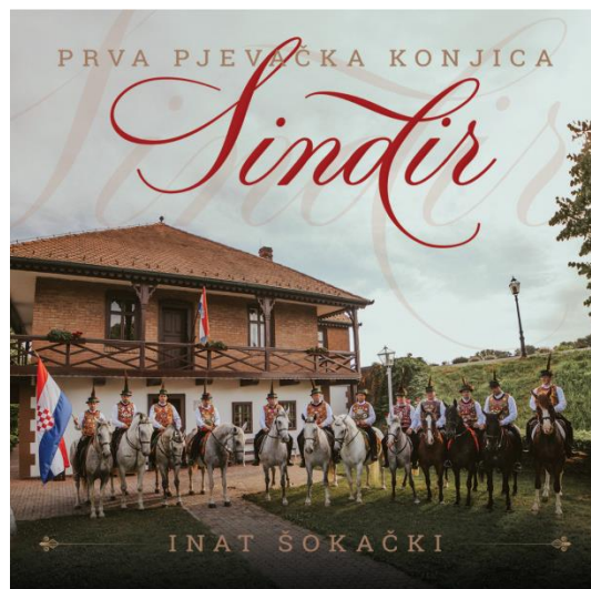
Slika 6: Naslovna slika prvog albuma „Sindira“