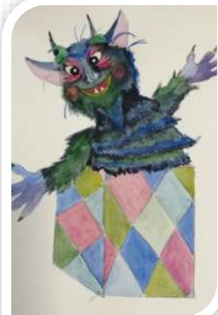
4. Skica đavolka