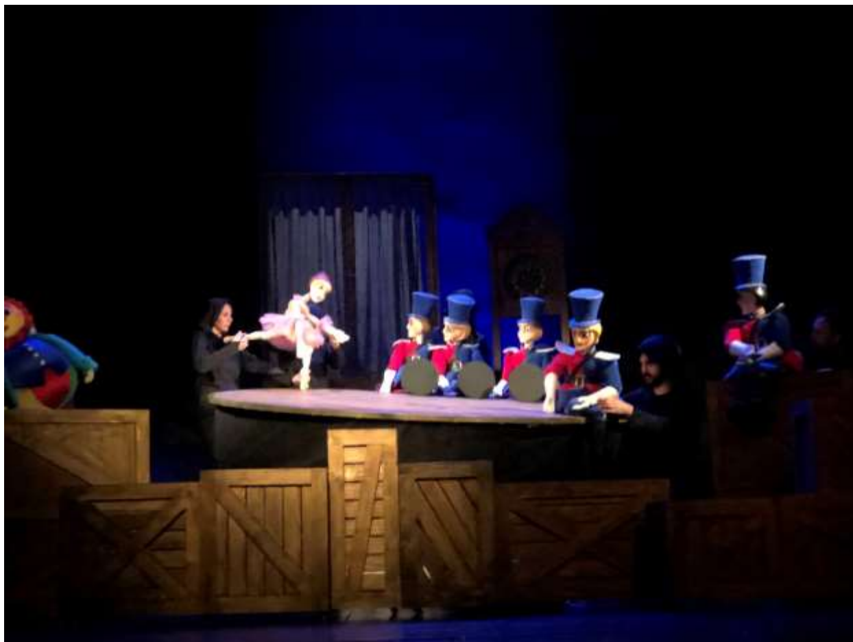
Slika s premijere 4. 11. 2021. godine, „Olovni Vojnik“, JU Pozorište mladih Sarajevo