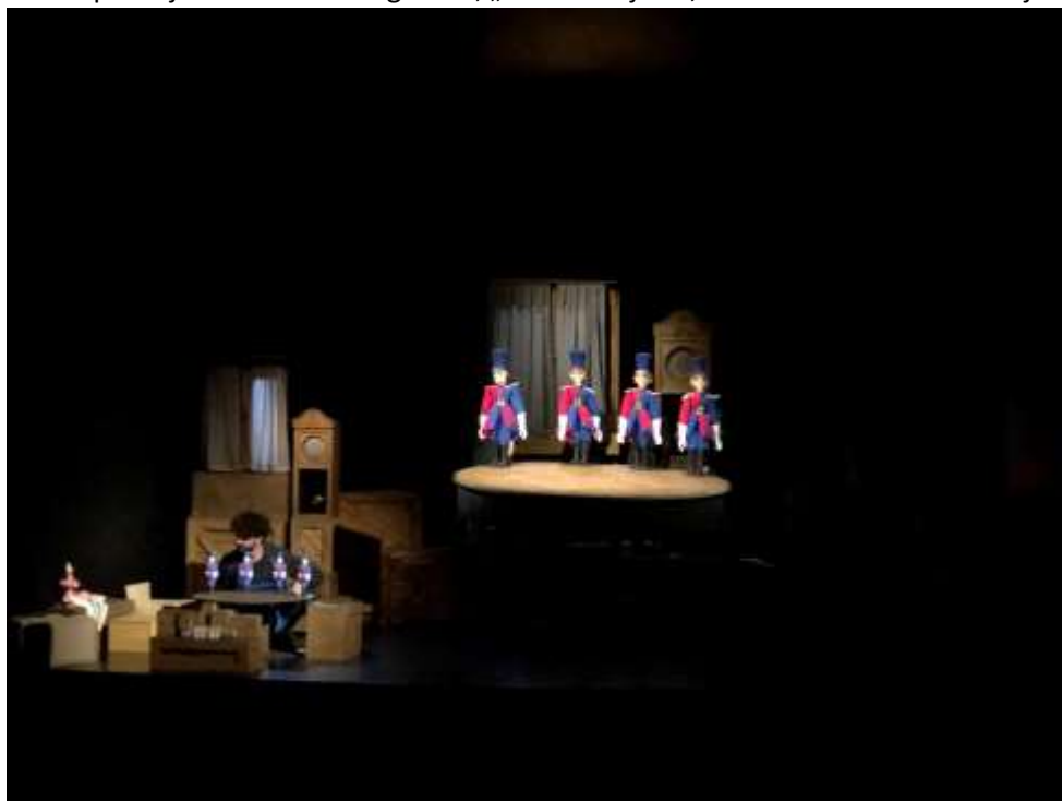
Slika s premijere 4. 11. 2021. godine, „Olovni Vojnik“, JU Pozorište mladih Sarajevo