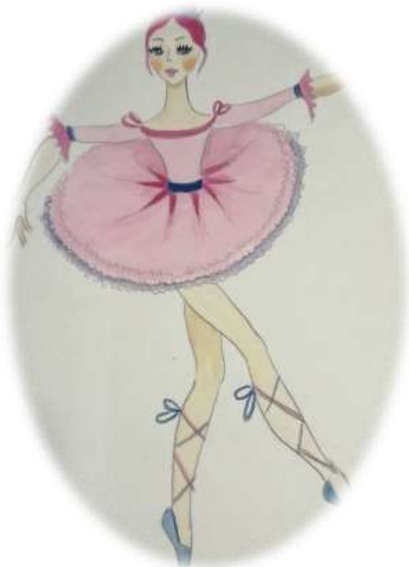
2. Skica balerine