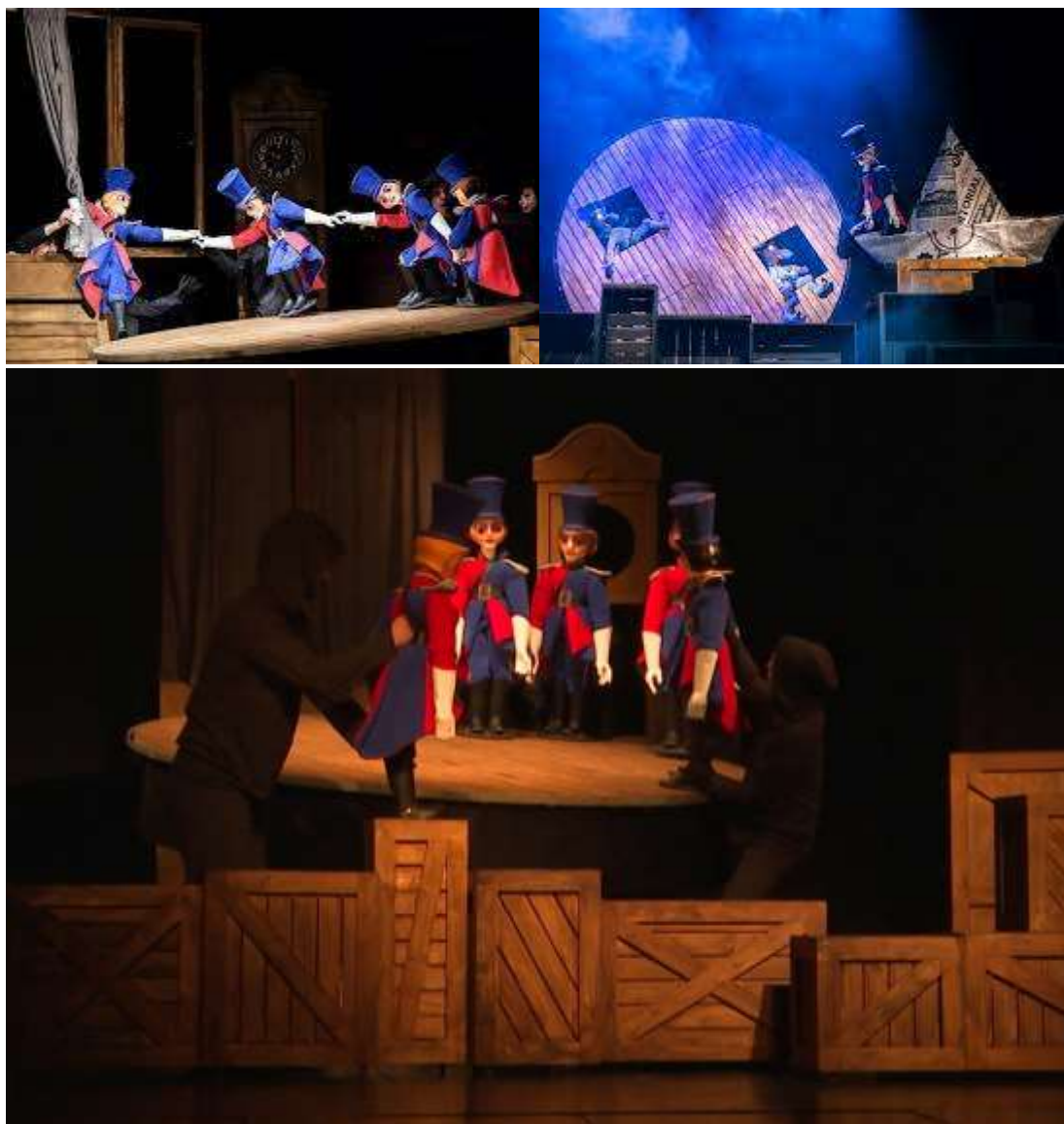
Slika s premijere 4. 11. 2021. godine, „Olovni Vojnik“, JU Pozorište mladih Sarajevo