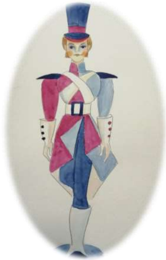
1. Skica olovnog vojnika