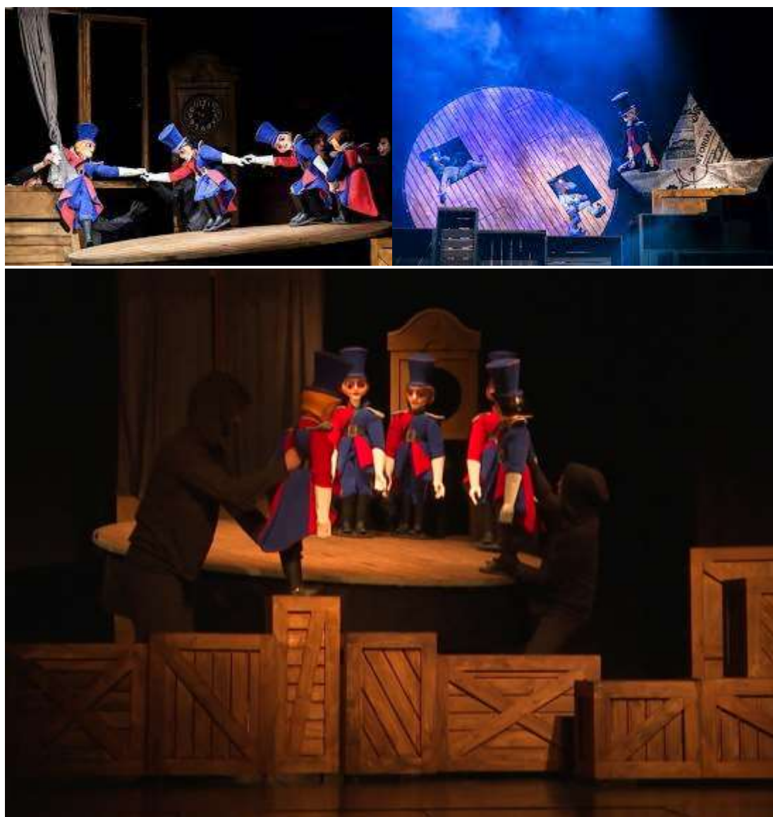
Slika s premijere 4. 11. 2021. godine, „Olovni Vojnik“, JU Pozorište mladih Sarajevo