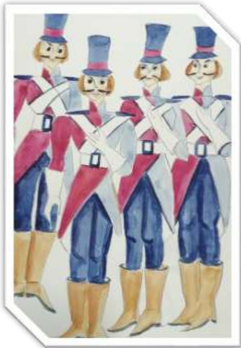
3. Skica vojnika