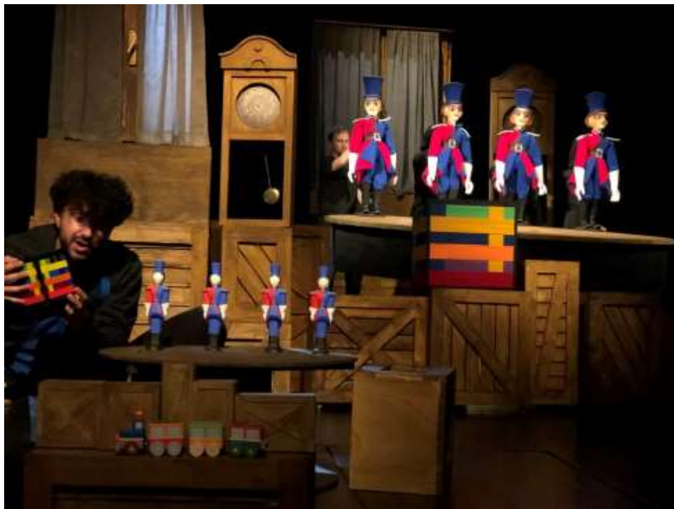
Slika s premijere 4. 11. 2021. godine, „Olovni Vojnik“, JU Pozorište mladih Sarajevo