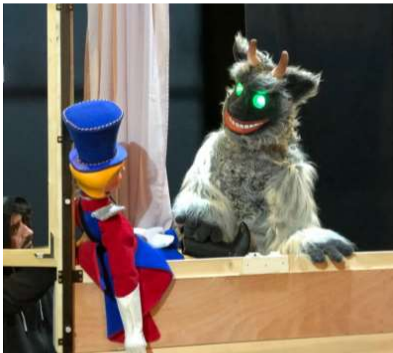
Slika s jedne od proba. Olovni vojnik i đavolak. JU Pozorište mladih Sarajevo