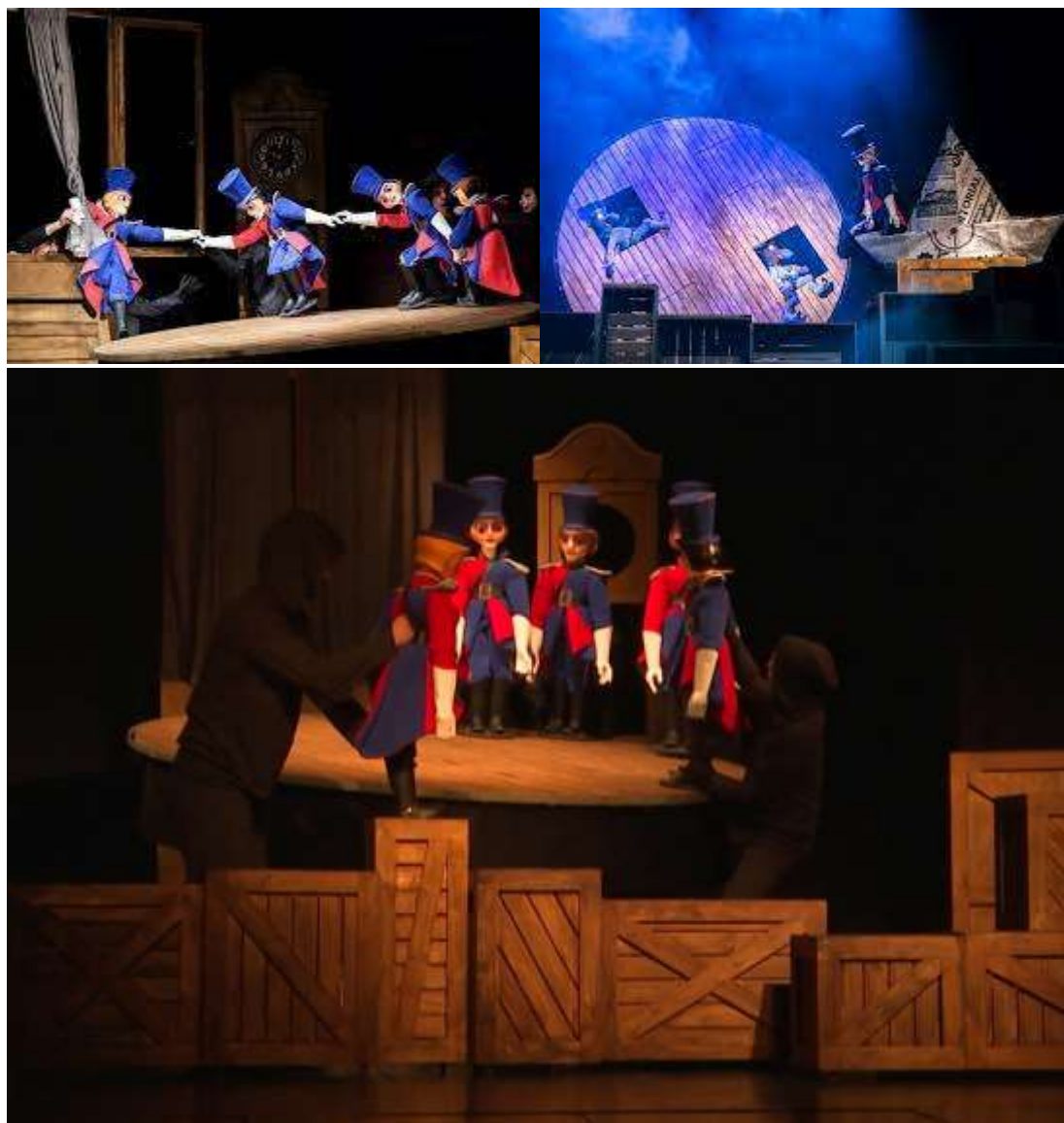
Slika s premijere 4. 11. 2021. godine, „Olovni Vojnik“, JU Pozorište mladih Sarajevo