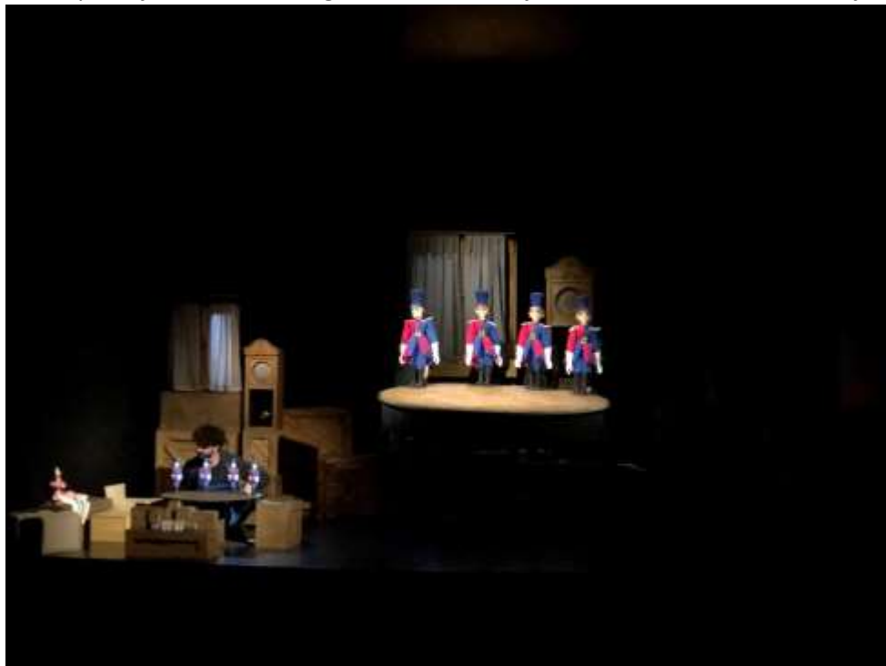
Slika s premijere 4. 11. 2021. godine, „Olovni Vojnik“, JU Pozorište mladih Sarajevo