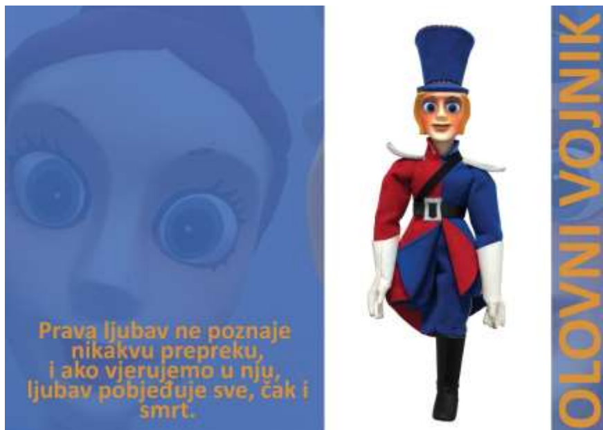
Afiša strana A. Afiša kada se zarola izgleda kao mala figura Olovnog Vojnika. Spreмна za igru nakon odgledane predstave.