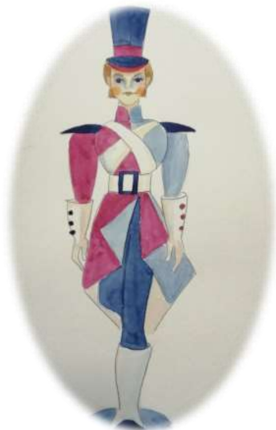
1. Skica olovnog vojnika