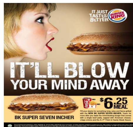
Slika 11. Oglas tvrtke Burger King