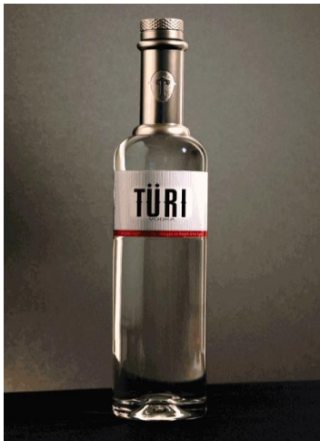
Izvor 4.. http://www.kentbarns.com/package.php

Primjer undercover marketinga: na privatnoj zabavi za mlade u Philadelphiji vlasnik kluba cijelu je večer točio piće nazvano Türi Vodka. Ta marka bila je u vlasništvu Baccardi, te su je kao novi proizvod odlučili plasirati na tržište zasićeno različitim markama vodke. Baccardi je preko agencije angažirao klub s ciljem da je predstavi tržišnom segmentu mladih na način da se onemogućí prodaja drugih vrsta vodke. Piće nije isticano na boci, nije nuđena po posebnoj cijeni, o njemu nije posebno pričano i sl. Samo se posluživala cijelu večer. Gosti nisu bili svjesni da se tako reklamira nova marka. S druge strane, Baccardi je uz minimalni trošak realizirao neobičnu promociju i gostima ovo piće pozicionirao u podsvijesti, te su isto piće naručivali tijekom slijedećih dolazaka, a sugerirali su ga i svojim prijateljima. Tako se stvara brujanje (eng. buzz) u vezi novog proizvoda (Türi Vodka).