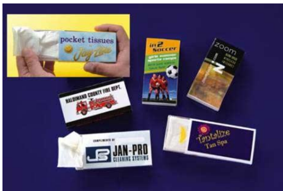
Slika 6. Primjer tissue-packing oglašavanja