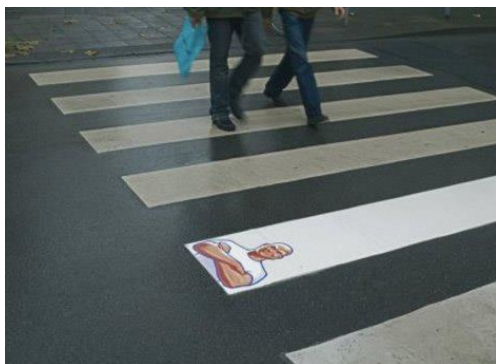
Slika 7. Primjer presence marketinga

Presence marketing sličan je ambient marketingu . Cilj presence marketinga je učiniti ime neke tvrtke poznatim javnosti i prisutnim u medijima i okruženju. Ovaj pristup pretpostavlja da ako nešto nije vidljivo i stalno predloženo ciljanoj klijenteli, ponuda će biti zaboravljena. Dakle nešto mora biti poznato kako bi kroz stalno prisutnost postalo priznato.