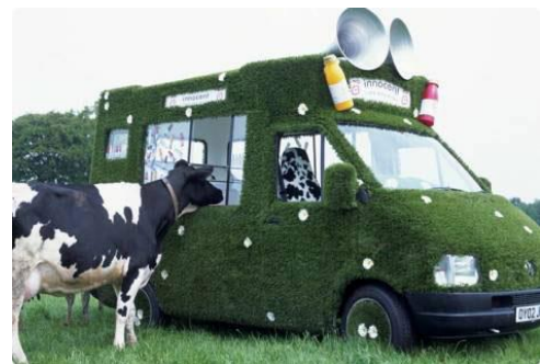
Slika 5. Kombi tvrtke Innocent