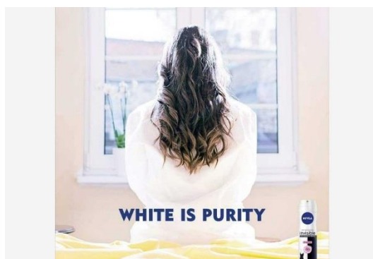
Slika 10. Oglas tvrtke Nivea