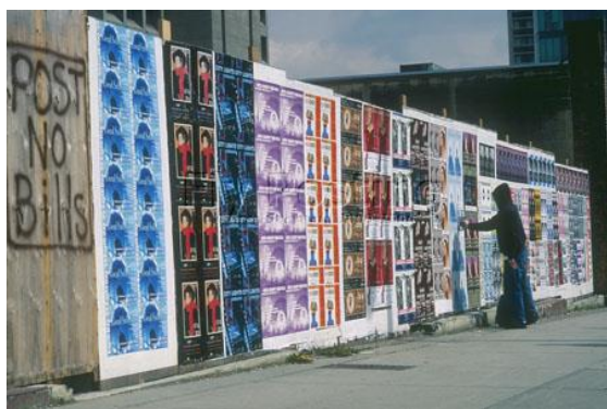
Slika 8. Primjer wild postinga/flypostinga