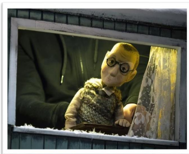
Slika 3 Petrov tata

Uloga koja mi je pripala u ovoj predstavi bila je ona Petrovog oca. Ta uloga nije bila samo govorna kao ona Gitinog oca ili majke nego sam imao i pripadajuću lutku za animaciju. Lijepo, pomislio sam s obzirom da se radi o mojemu diplomskom ispitu, smiješno bi bilo da uloga koju ću imati u njemu ne postoji, tj. da je neopipljiva i nevidljiva te da jedino čime se moram služiti u njenome izvođenju je moj govorni aparat te glasovne i govorne konstante.