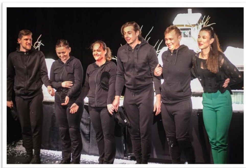
Slika 2 Glumci i redateljica nakon premijere