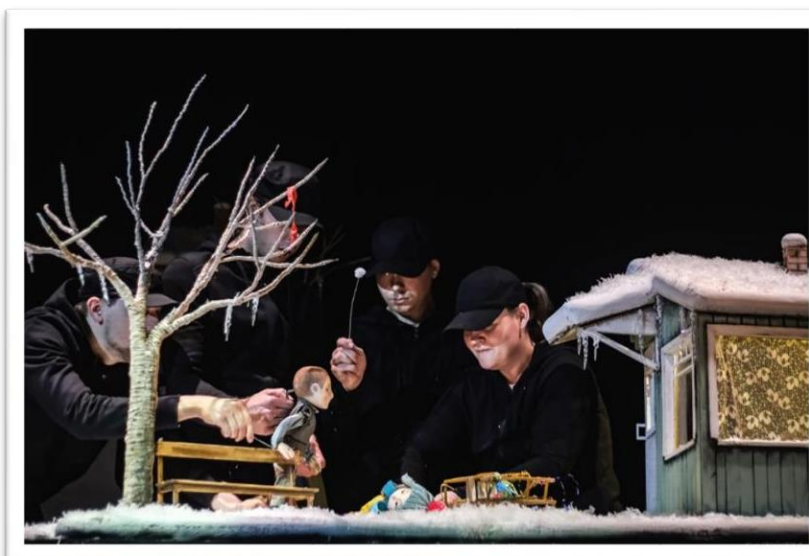
Slika 5 Trenutak s predstave

Osim pomoćnih animacija na lutkama, jedan od mojih zadataka je i animacija prostora i stvari u njemu, tj., animacija predmeta. Tako ja animiram let trakice koju vjetar otpuše sa Fru Fru-a i zapetlja ju u krošnju grane, animiram padanje snijega s vrata kada se vrata zalupe i padanje snijega sa drveta kada ga Petar njiše. Sve su to sitni zadatci koji mene kao