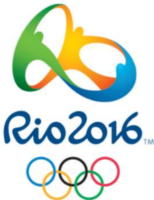
Slika 10. Službeni logo LJOI 2016. (Službena stranica Olympics, pristupljeno 16.8.2022.)

Rio de Janeiro, drugi najveći grad u Brazilu, imao je čast ugostiti prve Olimpijske igre ikada održane na kontinentu Južne Amerike. Trajale su od 5. kolovoza do 21. kolovoza 2016. godine. Sudjelovalo je 11 238 sportaša iz 206 zemalja, a u samoj organizaciji sudjelovalo je 150 000 ljudi i 50 000 volontera. Na sljedećim su dvjema slikama prikazani logo i maskota LJOI u Riju 2016.