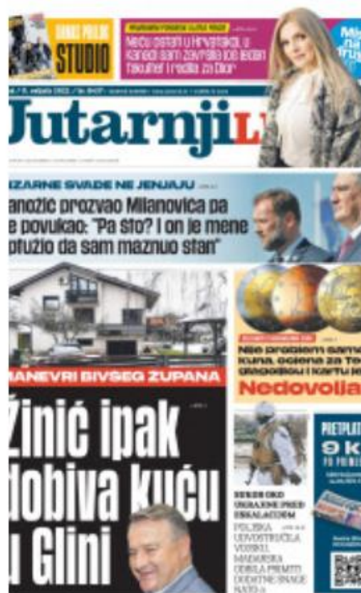
Slika 1 Naslovnica Jutarnjeg lista, veljača 2022.

„Fotografija u novinama vizuelno podržava tekst, nudeći dodatne informacije i privlačeci pažnju čitaoca/ čitateljice.“ (Isanović, 2007: 38)