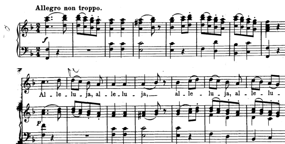
Primjer 3: Primjer imitacije teme u klavirskoj i vokalnoj dionici na početku stavka Alleluia

Treći stavak moteta Exsultate, jubilate jest Allegro non troppo . Ovaj stavak još se naziva i Alleluia upravo zato što se tijekom njega kontinuirano ponavlja riječ alleluia – kojom se u kršćanstvu izražava slavljenje Boga. Stavak Alleluia sastoji se od niza glazbenih rečenica jednakoga sadržaja, ali različite duljine. Ono što je karakteristično za ovaj Mozartov motet jest to što u njegovoj strukturi možemo vidjeti mnogo skladateljskih postupaka tipičnih za barokne motete. Najistaknutiji skladateljski postupak koji se javlja u ovom motetu, a karakteristika je većine baroknih oblika, jest imitacija. Mozart Exsultate, jubilate sklada po uzoru na barok – orkestralnu dionicu (u ovom radu klavirsku) izjednačuje s vokalnom, čineći ih ravnopravnima i podjednako važnima. Te dvije dionice međusobno iznose temu na način da se, nakon iznošenja teme u jednoj, ona imitira u drugoj dionici. (Primjer 3)