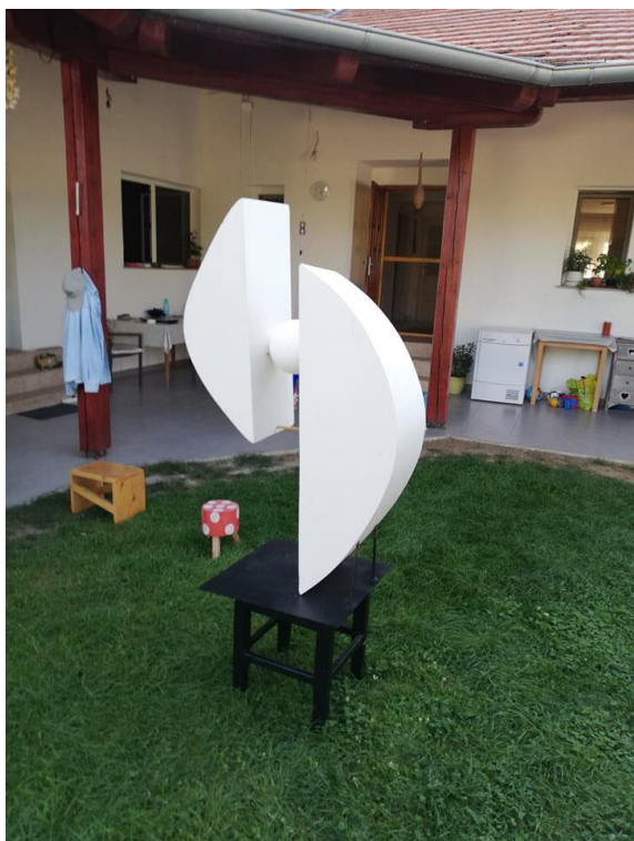
Slika 10. Završen rad