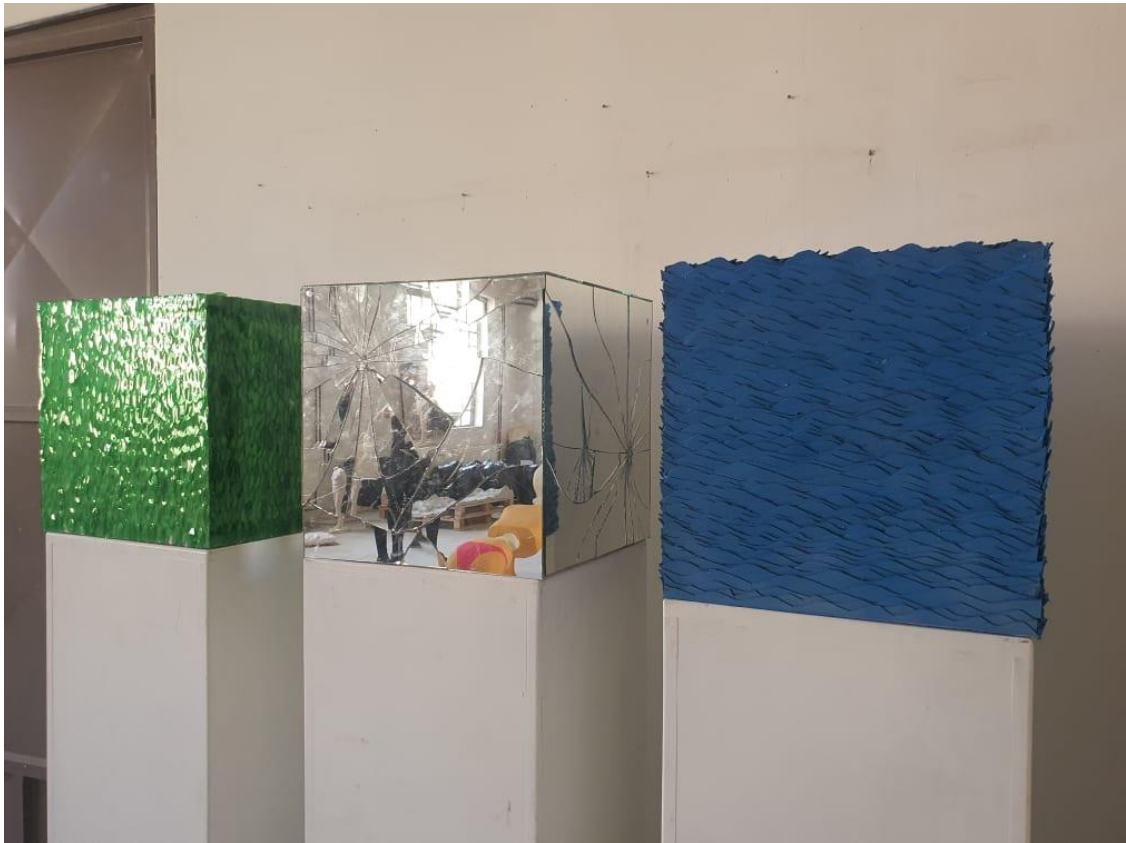
Slika 14: Postav rada