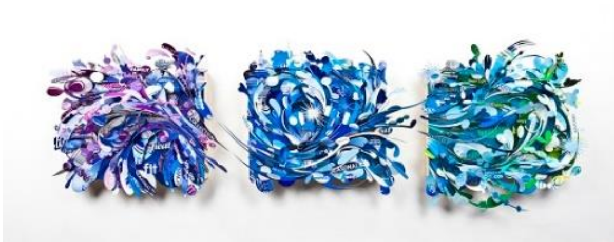
Slika 2: Aurora Robson, Provjera nagrade , 2013.