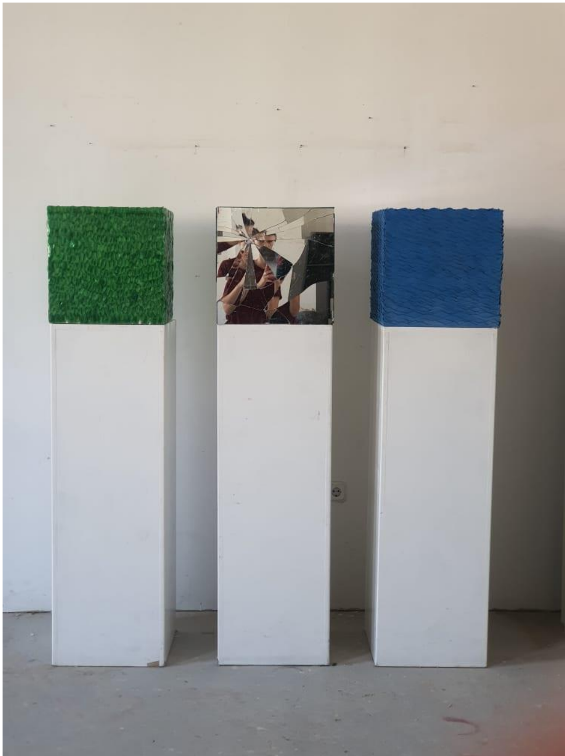
Slika 13: Postav rada