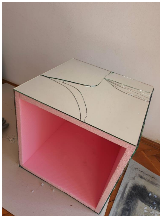
Slika 10: Druga faza izrade, lijepljenje ogledala