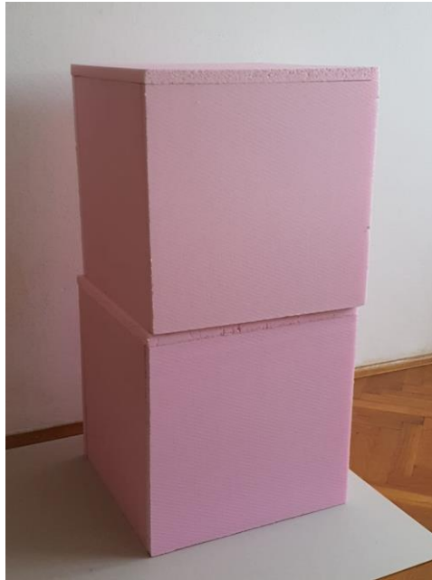
Slika 6: Prva faza izrade

Izradu ovog rada podijelila sam u dvije faze. Prva je faza bila sastavljanje kocke kao osnove za daljnji rad. Materijal koji sam koristila za ovu fazu bio je stirodur. Njega sam rezala na jednake kvadrate te sam ih potom spojila u kocke. Dimenzija svake kocke je 40x40x40 cm (slika 6).