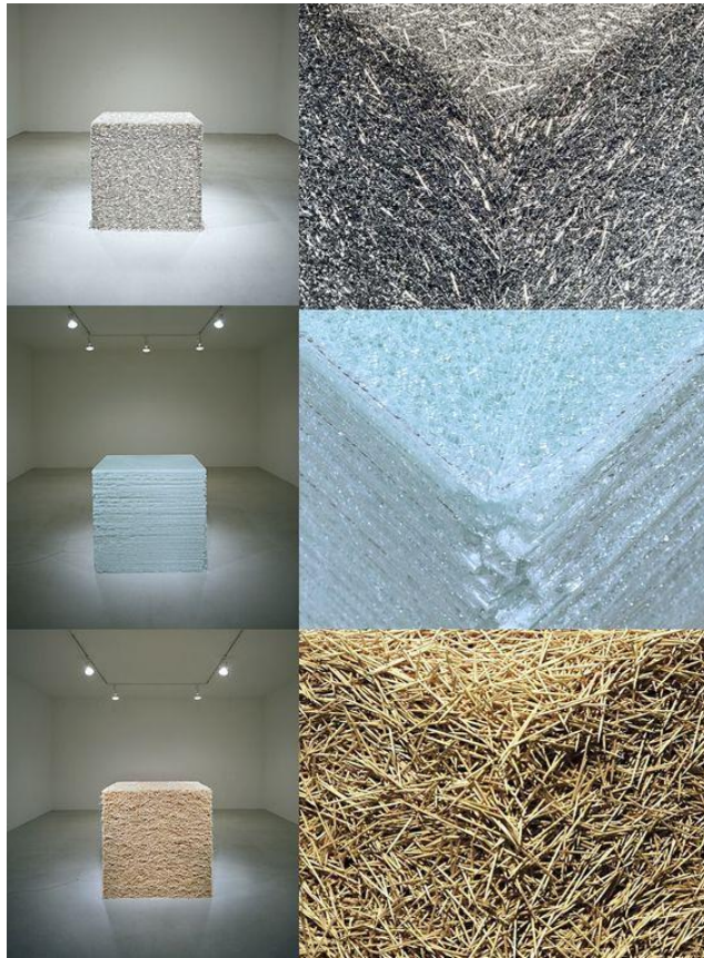
Slika 4: Tara Donovan, Bez naziva , 2004.