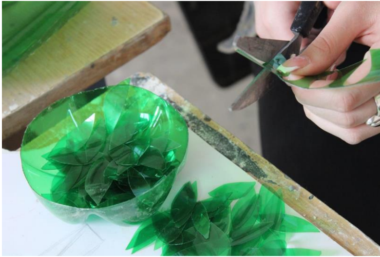
Slika 7: Druga faza izrade, rezanje plastike