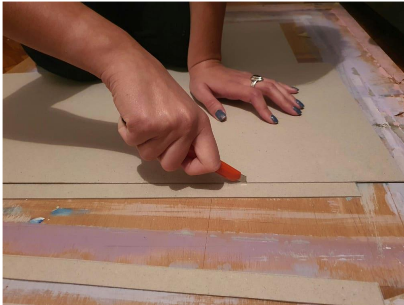
Slika 11: Druga faza izrade, rezanje kartona