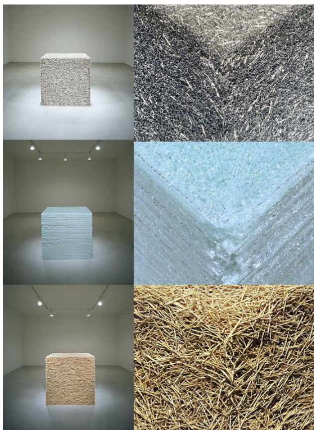
Slika 4: Tara Donovan, Bez naziva , 2004.