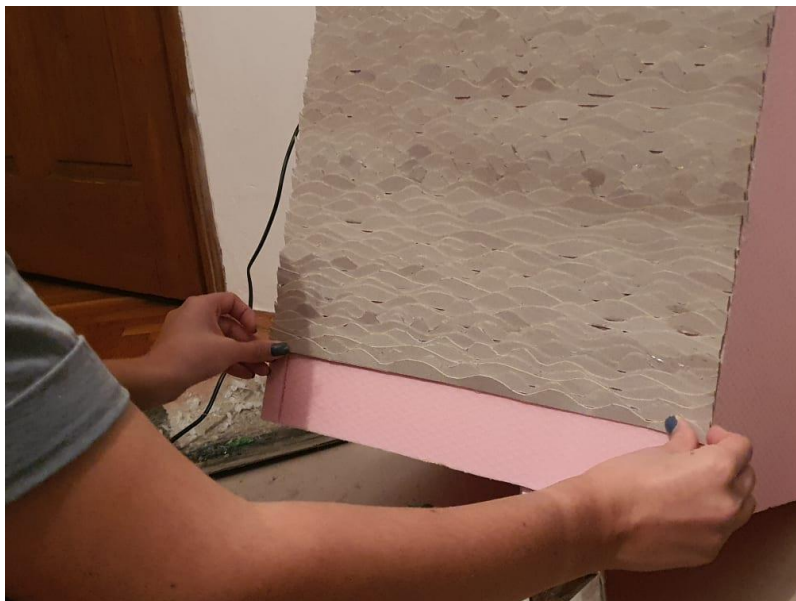
Slika 12: Druga faza izrade, lijepljenje kartona