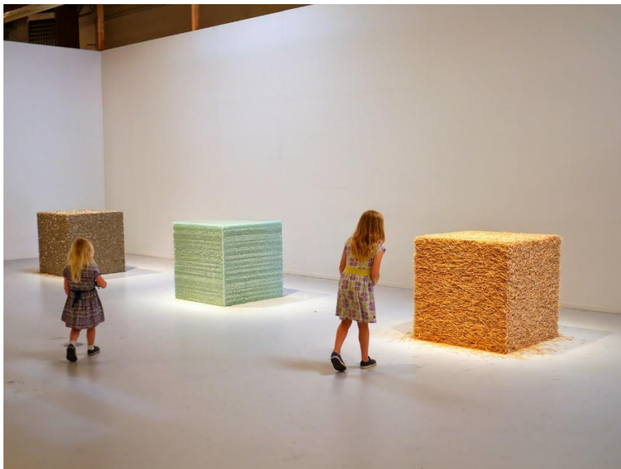
Slika 5: Tara Donovan, Bez naziva , 2004.