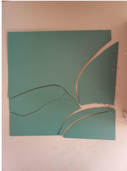
Slika 9: Druga faza izrade, razbijanje ogledala