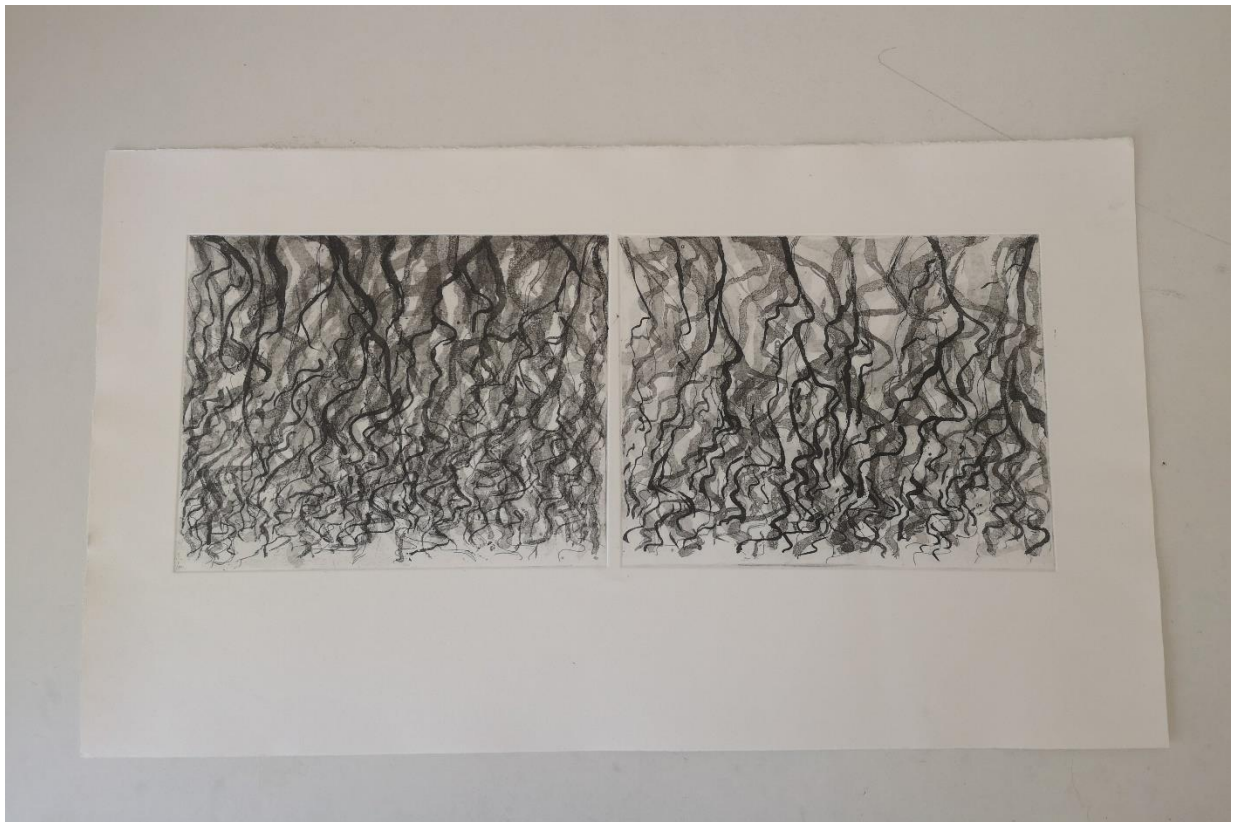
Slika 10, prvi otisak (matrice jedan i dva)

Završni rad sastoji se od tri otiska. Grafičkim tehnikama intervenirano je na šest matrica koje u paru po dvije čine jedan otisak na jednom papiru. Podnaslov povlači za sobom pitanja zašto brojevi šest i dva? Šest matrica odabrano je zbog ravnoteže cjelokupne serije radova. U paru po dvije matrice čine prvi rad serije te se zatim nastavljaju drugi i treći par radova što u konačnici predstavlja cjelinu. Parnim brojevima želja je bila postići ravnotežu, sklad te blažu inačicu matematičke čistoće, što u suprotnome sami prikaz rada ne odražava. Svaka od matrica predstavlja slobodnu igru linija dok ni jedna od matrica nije jednaka. Stoga svaka od njih označava pojam prirode; slobodna, raznolika te pomalo divlja.