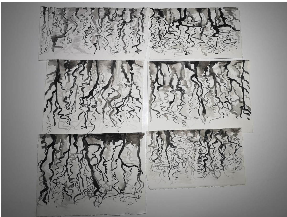
Slika 8, skice završnog rada