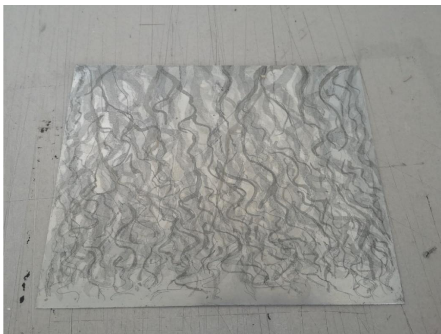
Slika 5, prikaz grafičkih tehnika na matrici

Suha igla kao tehnika prilično je slična bakropisu, bitna razlika je da ploča na kojoj je intervenirano iglom ne ide u kiselinu, drugim riječima ploča na koju je prenesen crtež s pomoću igle spremna je odmah za otiskivanje. Ujedno je to tehnika koja podrazumijeva mehaničku obradu ploče. U slučaju ovoga rada, suha igla korištena je na nekim matricama u blagoj, nježnoj formi tek da bi se dobilo na gustoći prikaza samog crteža.