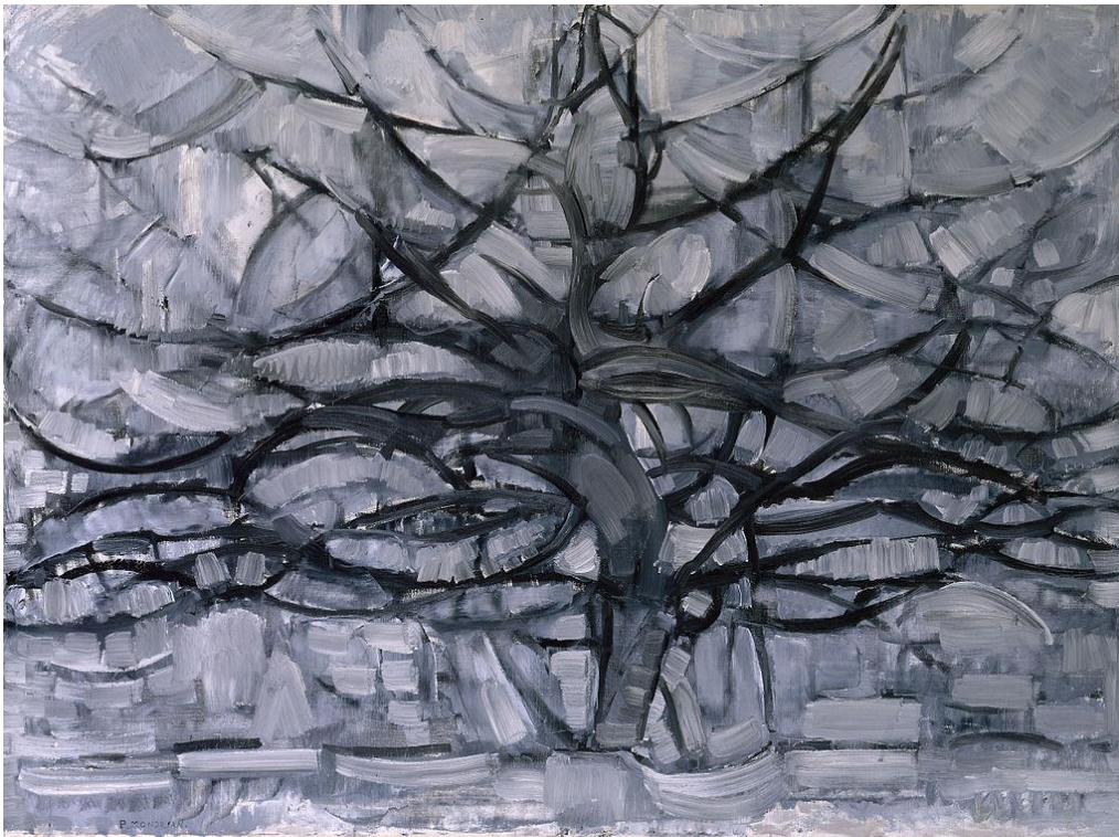
Slika 13, Piet Mondrian „Grey Tree“, 1911.

Nizozemski slikar Piet Mondrian apstraktni je slikar koji se razvio od pejzažnih slika do geometrijskih apstrakcija. 1914. razvio je apstraktni stil koristeći tri osnovne boje s okomitim i vodoravnim linijama. Njegova „Grey Tree“ uljana slika nastala je 1911. godine u vrijeme kada započinje eksperimente sa kubizmom. Ostavlja formu drveta, ali ga stilizira u svome stilu.