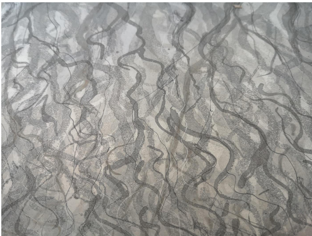
Slika 4, detalj matrice

Kako je već spomenuto završni rad nastao je tehnikama dubokog tiska. Prvi najvažniji i najveći segment koji ispunjava matrice je tehnika reservegea koja upravo svojim toniranjem i organskim prikazom igre linija omogućuje realiziranje ideje. Reservege kao tehnika dosta je vezan za aquatintu isključivo zbog spomenute gradacije tonova koji se dobivaju jetkanjem. Smjesa od šećera, vode, tempere i detedženta nanosi se na pripremljenu cinčanu ploču. Bitniji dio rada je priprema matrice. Treba biti dobro odmašćena kako bi se reservege čvrsto uhvatio za podlogu. Nanosi se uglavnom kistom, štapićem, ali mogu poslužiti i ostali pribori pa i prsti. Zatim puštamo da se nanoseni reservege osuši. Nakon što se nanos reservegea osuši površina ploče se prekriva tankim slojem grunda koji štiti ostatak ploče od kiseline. Prethodno nanoseni reservege otapamo u toploj vodi lagano ga skidajući kistom ili prstom. Nakon toga na matricu nanosimo auto-lak koji služi kao zamjena za kolofonijski prah za tehniku aquatinte. Kada se auto-lak nebi nanio, jetkanje bi bilo otvoreno. Poslije nanosa auto-laka matricu stavljamo u kiselinu na određeno vrijeme za postizanje željenih tonova.