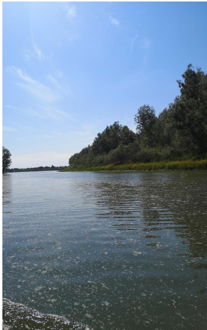
Slika 7, sjeme drveta topole na površini Dunava

Šuma predstavlja životnu zajednicu u kojoj glavnu ulogu ima drveće što i prikazuje završni rad kojim uz Dunav dominiraju upravo stabla odnosno njihov odraz na Dunavu. Mjesto koje se prikazuje okruženo je uglavnom bijelim topolama, bijelim vrbama i divljim bagremima. Vrsta koja prevladava u šumi koja se spominje je bijela topola. Kako je za pretpostaviti raste uz vlažna staništa, u ovom slučaju uz rijeku Dunav. Cvjeta u rano proljeće karakterističnim izgledom sjemenja; u teoriji čahure sadrže sjemenke obavijene sitnim dlačicama. Oprašuju se vjetrom, te početkom proljeća svaki i najmanji dio površine Dunava biva prekriven laganim slojem čupavih čahura.