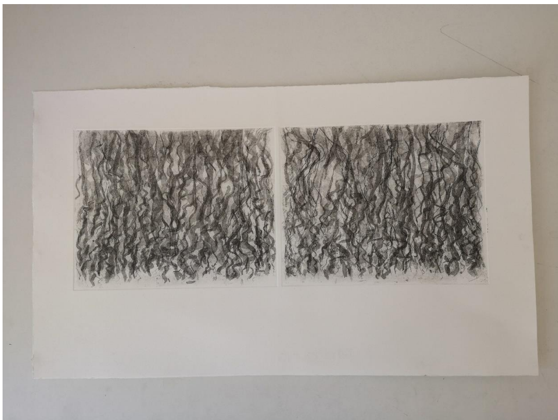
Slika 12, treći otisak (matrice pet i šest)