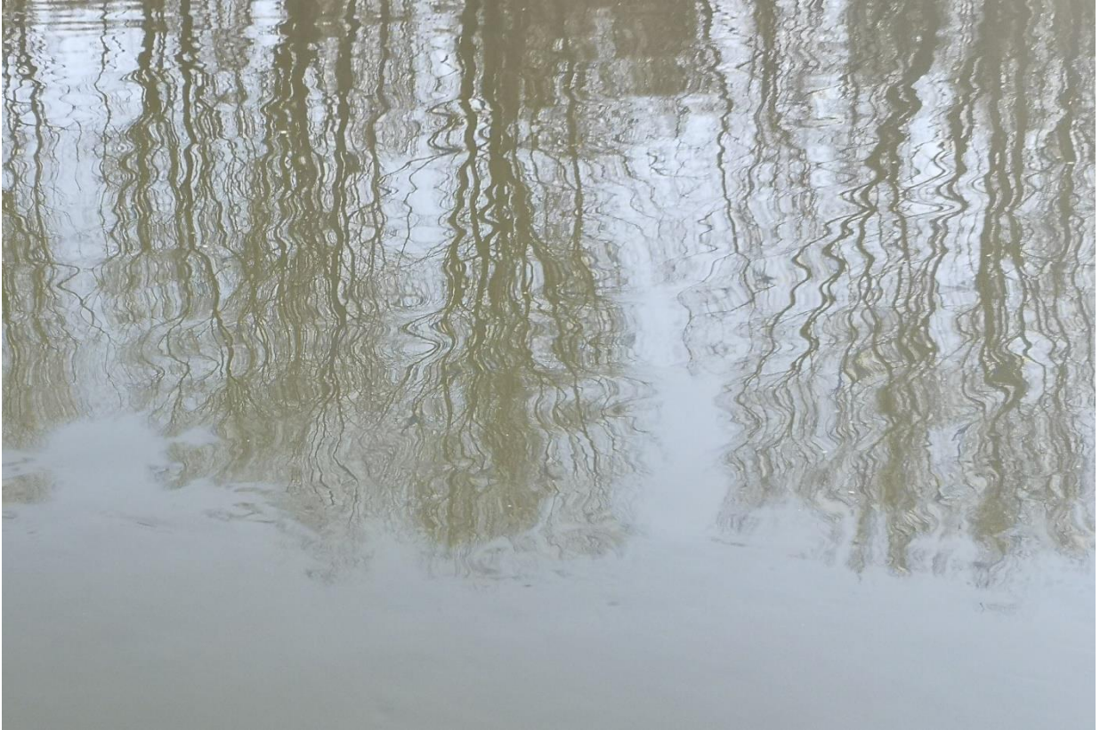
Slika 6, fotografija odraza šume na Dunavu