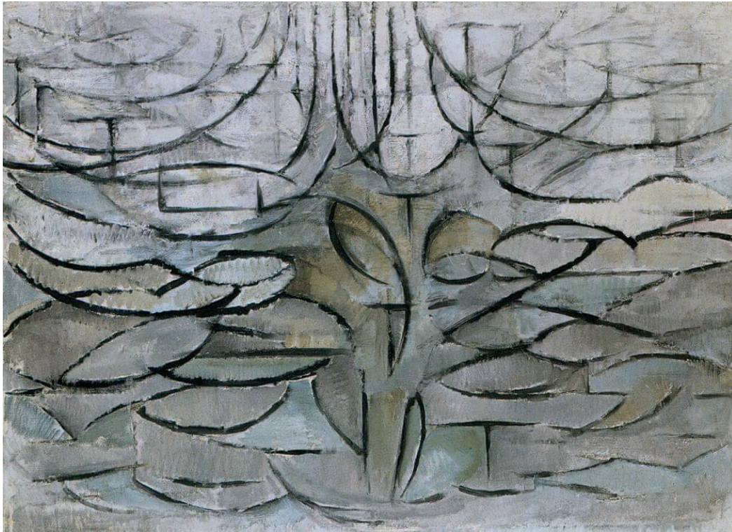
Slika 14, Piet Mondrian „Blooming Apple Tree“, 1912.

Mondrianovo djelo „The Flowering Apple Tree“ primjer je naglašene stilizacije gdje se gubi sva forma prikaza u ovom slučaju stabla jabuke. Rad je izložen u Nizozemskom muzeju Kunstmuseum Den Haag. Korištena je forma elipse kroz cijelo djelo koje se ponavljaju, a boje su jedva izražene. Dakle cilj nije preslikati postojanu formu iz prirode već je je ovdje riječ o umjetničkoj interpretaciji i njegovom viđenju stabla jabuke. To svakako mogu povezati sa završnim radom i stiliziranim minimalnim pokretima okomitih linija koje u suštini stvaraju prikaz odraza drveća na rijeci koja teče.