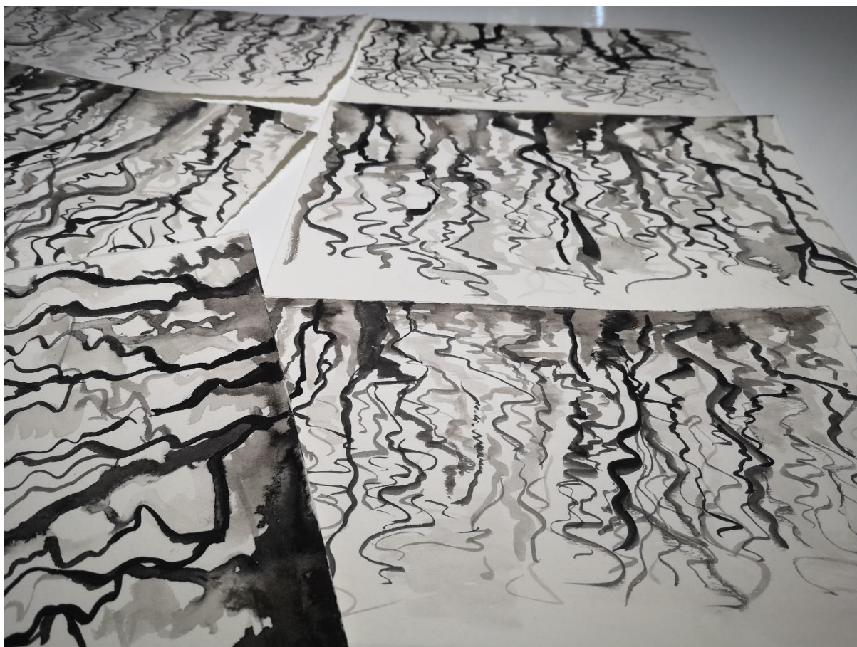
Slika 9, skice (detalj linije)