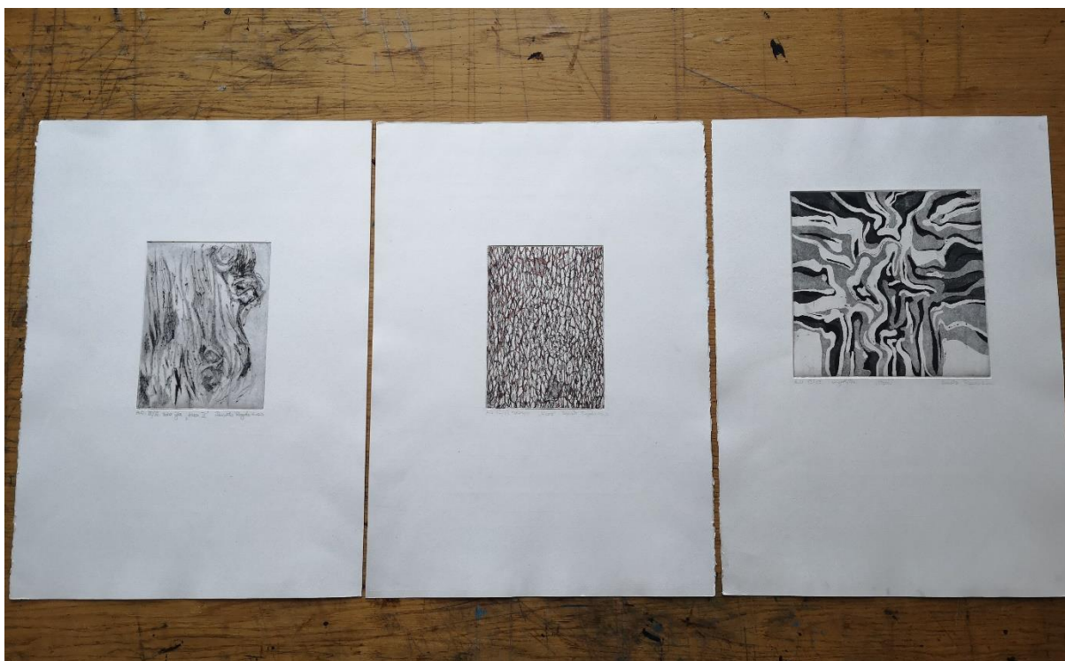
Slika 2, Suha igla, bakropis i akvatinta (detalji drveta), 2019. g