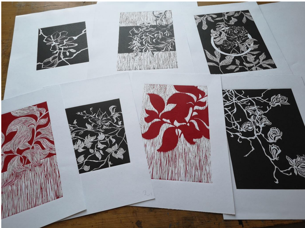
Slika 1, linorezi (motivi cvijeća), 2018.g

Na razvoj ideje potiču me vlastite misli i osjećaji, a kako su upravo oni bitni čimbenici za vlastito stvaranje nastavljam se fokusirati na prirodu. Priroda je oduvijek dio mojih radova, pa tako i ovaj put sama ideja proizlazi iz nje, odnosno promatranje i boravljenje u istoj. Naime, imam sreću da joj mogu biti blizu, pa se tako i sama ideja razvila dok sam boravila na tom mjestu koje prikazujem u svojem radu. S obzirom da je priroda prisutna kroz cijeli dosadašnji period stvaranja radova, a to prikazuju i radovi nastali tijekom fakultetskog obrazovanja, ovoga puta sve se realizira na kompleksnijem nivou. Dosadašnji radovi uvelike su utjecali na trenutni završni rad koji prezentira, između ostalog, dublje shvaćanje svega oko nas.