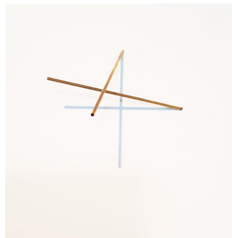
Prilog 6. Goran Petercol, Sjene , 1990.