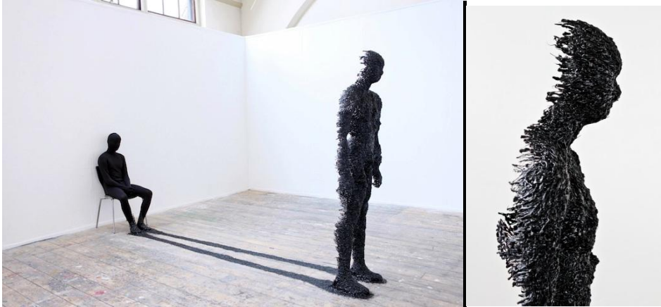
Prilog 4. Rook Floro, Sjena , crno ljepilo i žica, 2011.

Navest ću neke primjere umjetnika i umjetničkih djela koji su se bavili sjenom. Rook Floro je suvremeni umjetnik koji također crpi inspiraciju iz Jungovog koncepta sjene što se može isčitati iz njegove skulpture pod nazivom "Sjena".