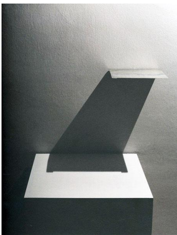
Prilog 5. Goran Petercol, Sjene , 2002.

Hrvatski suvremeni umjetnik Goran Petercol tretira sjenu kao formu koja implicira rubnost područja vidljivog i spoznatljivog. Uvidjeti znači znati, a da bi mogli uvidjeti određeni fenomen spoznaje potrebno ga je uvesti u proces rasvjetljivanja i osvijetliti. Spoznati cjelinu znači ukinuti rub, granicu, sjenu. U sjeni je upisana dijalektika čovjekovog spoznajnog procesa, ali i dijalektika Petercolove poetike koja stavlja naglasak na odnos spoznatljivog i nespoznatljivog, osvijetljenog i neosvijetljenog, materijalnog i nematerijalnog. ( https://hdlu-osijek.hr/news/izlozba-hijerarhije-goran-petercol )