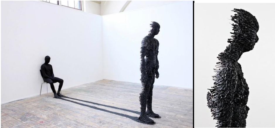
Prilog 4. Rook Floro, Sjena , crno ljepilo i žica, 2011.

Navest ću neke primjere umjetnika i umjetničkih djela koji su se bavili sjenom. Rook Floro je suvremeni umjetnik koji također crpi inspiraciju iz Jungovog koncepta sjene što se može isčitati iz njegove skulpture pod nazivom "Sjena".