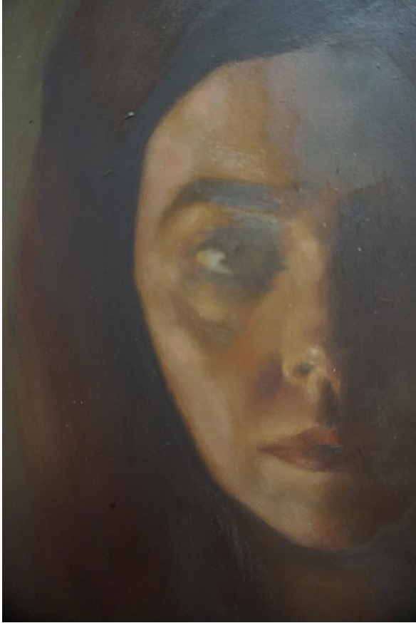
Prilog 2. Detalj: Autoportret 1