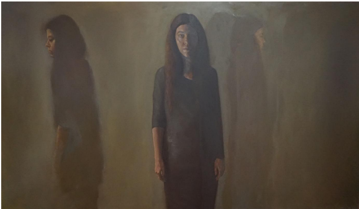
Prilog 1. Sjena kao tijelo , ulje na mediapanu, 200 x 115 cm, 2021.

U figurativnom slikarstvu i realističnom izričaju pronašla sam najveći potencijal za prenošenje ideja i razmišljanja. U mom slikarstvu dominira ljudski lik, najčešće vlastiti, koji mi je početna točka u umjetničkom istraživanju. Tijekom studija okušala sam se i u apstrakciji, no uvijek se na kraju vraćam tradiciji i realističkom figurativnom likovnom izrazu s ljudskim likom u prvom planu. Zaokupljena sam ljudskim likom u svom radu i osjećam potrebu da na njemu zadržim fokus. Na središnjem autoportretu lice je oblikovano bočnim izvorom svjetlosti koji čitavu polovicu glave ostavlja u sjeni i kao da ujedinjuje moju svjetlu i mračnu stranu u jednu cjelinu. Slika je lišena prostora kako bi se fokus stavio na figure. Neke figure sam naglašavala, a druge stapala s pozadinom dok nisam postigla željeni ritam i ravnotežu. Slikarski koncept proizašao je iz želje da vizualno predočim i prenesem sjene iz unutrašnjeg svijeta van na sliku te kroz motiv autoportreta uđem u najdublje aspekte sebe. Umjetnost je potreba koja mi daje smisao, jasniju sliku i odgovore na mnoga pitanja.