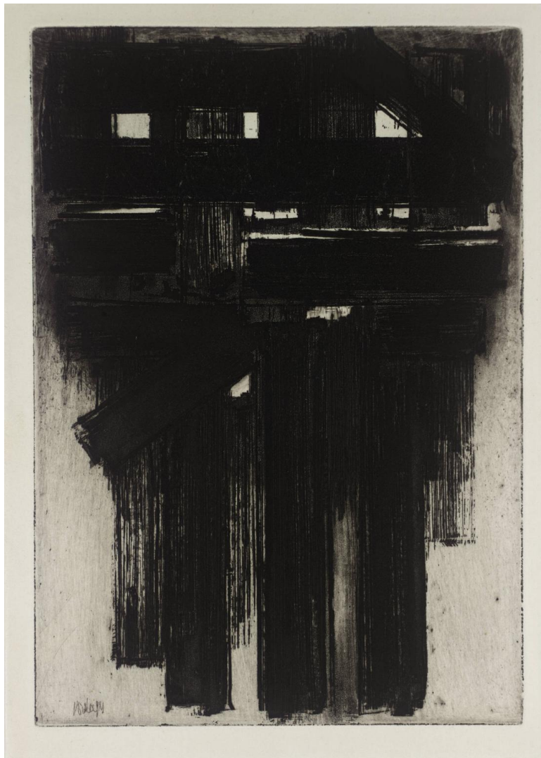
Slika 4 , Pierre Soulages, [bez naziva] 1956, intaglio otisak na papiru, Tate Britan

Pierre Soulages je umjetnik rođen 24. prosinca 1919. u Rodezu u Francuskoj, čiji su prepoznatljivi debeli crni potezi na svjetlijim pozadinama karakterizirali njegovu slikarsku praksu od kasnih 1940 -ih. Njegove gestualne slike isticale su se u apstraktnom ekspresionističkom pokretu koji se tada pojavio u Sjedinjenim Američkim Državama. Utjecaj na njegovu snažnu primjenu pigmenta u nereprezentativnim oblicima imala je pretpovijesna i romanička umjetnost. (Artnet, n.d.)