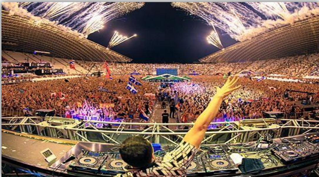
Slika 3. Stadion Poljud u Splitu u vrijeme održavanja festivala Ultra

https://www.t.ht.hr/drustvena-odgovornost/drustvena-odgovornost-aktivnosti/2236/Hrvatski-Telekom-i-Samsung-pokrovitelji-Ultra-Europe-Music-Festivala.html (05.08.2021.)