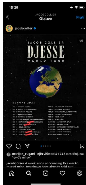
Slika 2 Instagram objava plakata koji sadži datume koncerata