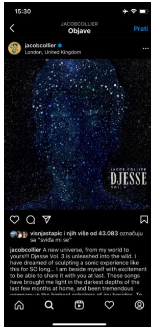
Slika 1 instagram objava plakata albuma