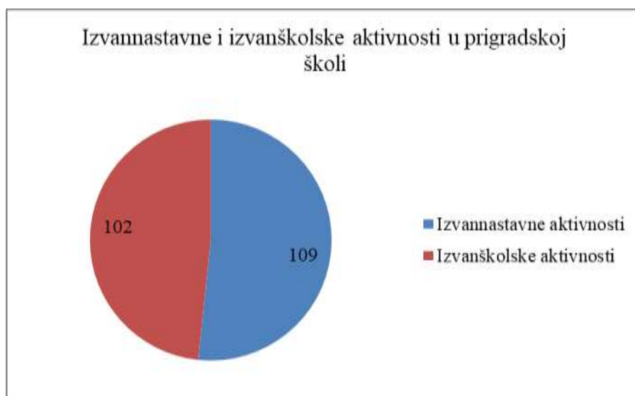
Grafikon 3. Usporedba izvannastavnih i izvanškolskih glazbenih aktivnosti u predgrađu

izvannastavne glazbene aktivnosti zastupljenije u predgrađu od izvanškolskih glazbenih aktivnosti? uspoređeni su odgovori ispitanika. Rezultati su vidljivi u Grafikonu 3.