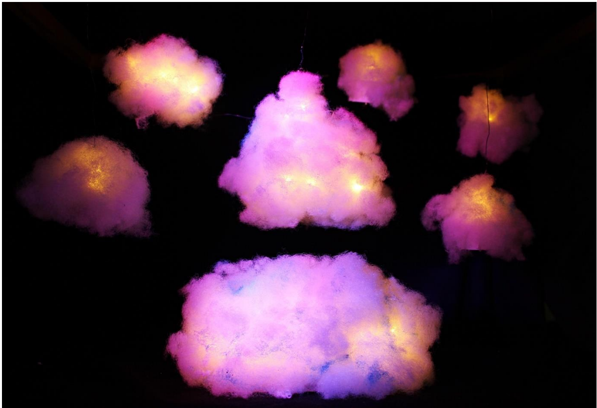
Slika XVIII., Scenografija, Beskrajno Kraljevstvo Oblaka noću