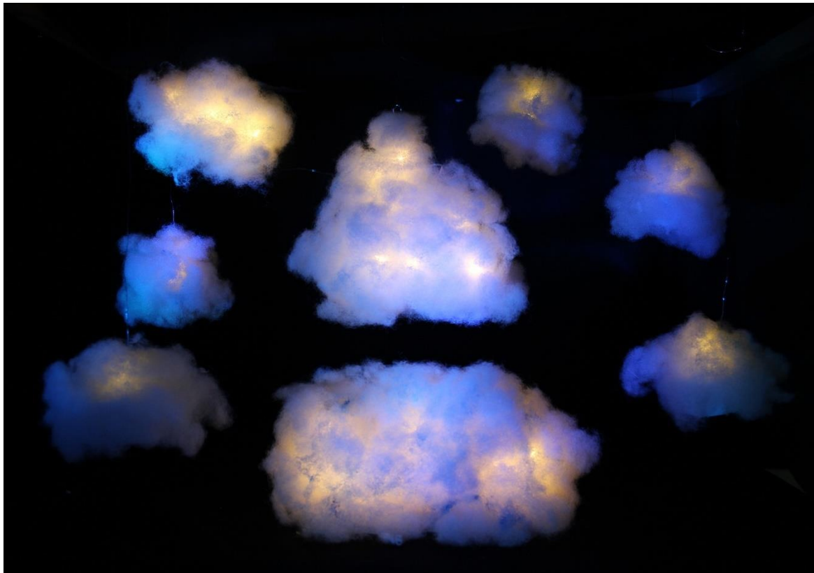
Slika XVII. Scenografija, Beskrajno Kraljevstvo Oblaka

potrebni animatori, primjerice, kada djevojčice promatraju razne oblike u oblacima, kada putuju u jednom od njih kao u čamcu... U tome je najveća čarolija lutkarstva, sve može biti živo, svakom predmetu se može udhanuti duša. Oblaci su izrađeni od mekog i podatnog bijelog vatelina koji najviše podsjeća na stvarne oblake, a kostur oblaka čini žičana konstrukcija na kojoj se nalaze lampice koje daju čarobnu, toplu svjetlost oblacima. Oblaci se nalaze na uzvlakama i smješteni su na različitim visinama i dubinama u pozornici. U službi stola, u Beskrajnom Kraljevstvu Oblaka nalazi se veliki oblak pod kojim se krije drvena konstrukcija.