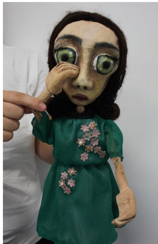
VIII. Evelinina majka u pokretu