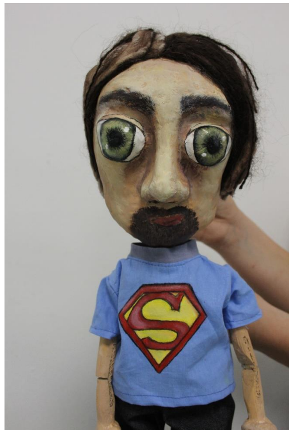
XI. Evelinin otac