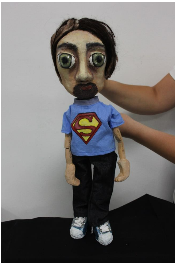
X. Evelinin otac

Za razliku od svoje žene, Evelinin otac unosi malo pozitivne energije u njihov dom. Dakako, svjestan je situacije u kojoj se nalaze, ali smatra da će olakšati svojoj kćeri ukoliko joj tu brigu i tugu ne pokazuje otvoreno i konstatno. Zbog toga on podupire njezinu igru i maštanje, smatrajući da će Evelinini dani biti ljepši ukoliko su ispunjeni smijehom, umjesto strahom. Osim po njegovom ponašanju, i po njegovom izgledu, odjeći i frizuri može se zaključiti da nije toliko uštogljen i dosadan kao majke.