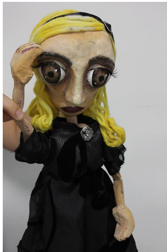
XIII. Astridina majka pokret