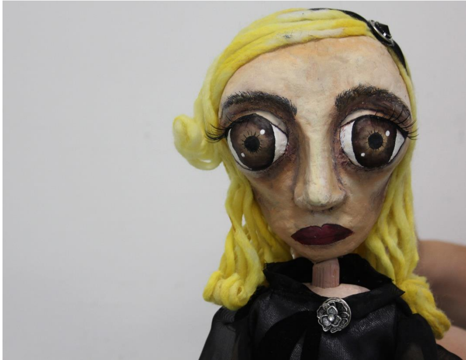
Slika XIV. Astridina majka, portret