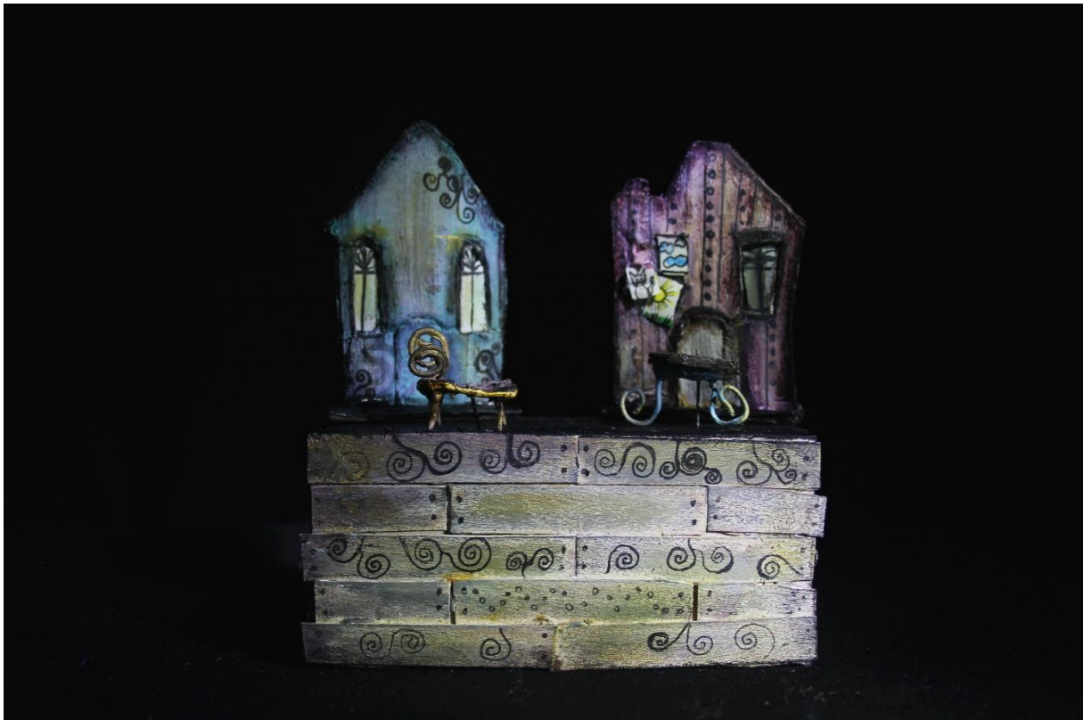
Slika XV., Scenografija, interijer

U stvarnom svijetu predstave postoje dva prostora, interijer koji prikazuje Astridinu sobu i eksterijer koji prikazuje prostor ispred Astridine i Evelinine kuće. Tehnološki, radi se o dva zida od drvenih ploča u ulozi kuća na stolu s kotačima, koji se po potrebi mijenjanja scene iz eksterijera u interijer i obrnuto samo okrene. Kuće imaju funkcionalna vrata i prozore kroz koje lutke izlaze i komuniciraju, naprimjer, kada Astrid dođe po Evelin, a mama i tata se raspravljaju preko prozora. Kada se stol okrene, oba zida predstavljaju Astridinu sobu koja ima krevet, policu s knjigama i igračkama, stolić, dječje crteže po zidovima... Boje eksterijera i interijera djeluju prigušeno i zatamnjeno, što se u potpunosti razlikuje od karaktera djevojčica koje u sebi nose posve suprotno. Razlog je, dakako, jasan, one ne pripadaju u dosadni zemaljski svijet, već u svoje Kraljevstvo. Pri promjeni prostora, iz Beskrajnog Kraljevstva u stvarni svijet i obrnuto, dolazi do promjene stola za igru, što je moguće učiniti vrlo brzo zbog kotačića koji se nalaze na stolu s kućicama, kao i na stolu koji se nalazi u Kraljevstvu.