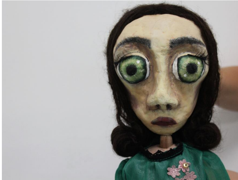
IX. Evelinina majka, portret