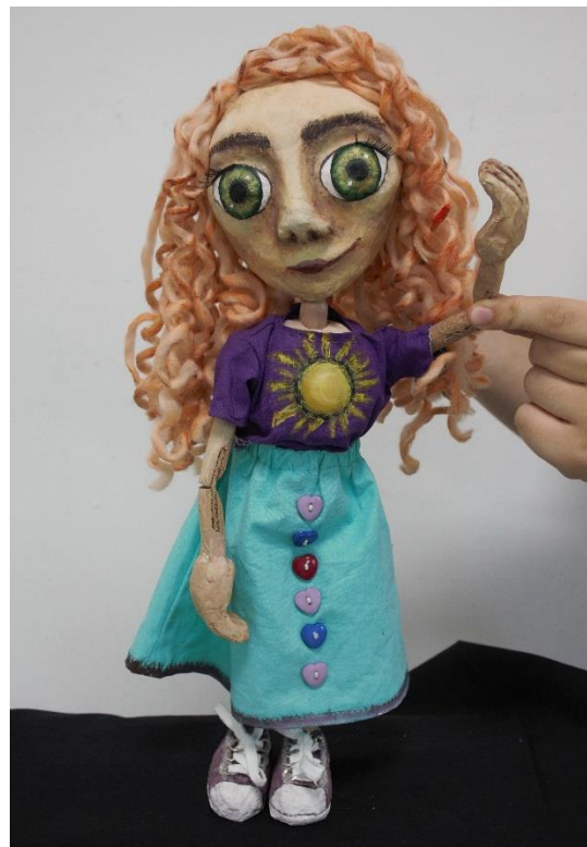
Slika V. Evelin