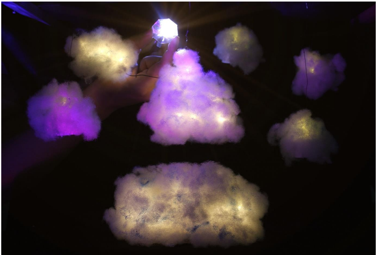
Slika XIV., Beskrajno Kraljevstvo Oblaka noću