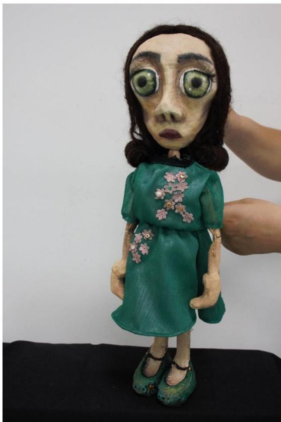
VII. Evelinina majka

Roditelji u procesu prilagodbe na bolest razmišljaju o budućnosti djeteta. Dolazi do promjena, a najuočljivija je rekonstrukcija slike o djetetu koje ima invaliditet. Najčešće brinu zbog sreće djeteta i posebno teško prihvaćaju trpljenje bolova, tjelesni ili duševni nedostatak, ili ograničenost slobode izbora. Kakav god je invaliditet u pitanju, najveću zabrinutost izazivaju pitanja koja se tiču budućnosti, a ne sadašnjosti. Roditelji mogu reagirati na različite načine i osjećati se često emocionalno istrošeno i zabrinuto za svoje dijete koje ima neki invaliditet te su zbog toga i nesretni, nervozni, ljuti i napeti.