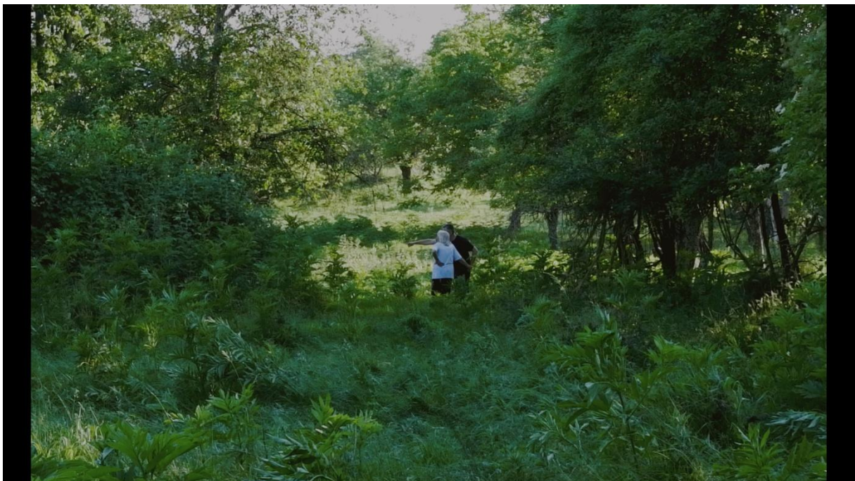
Slika 4, Entropija, 2021.

„Plan u kojemu se vidi cijeli prostor u kojemu se radnja zbiva, bez obzira na njegovu veličinu. Svejedno je da li se radi o totalu Biokova ili totalu telefonske kabine. Knjiga snimanja će ionako precizno označiti o kakvom je totalu riječ. Ukoliko u kadru ima osoba, ova naznaka ništa eksplicitno ne govori o njima, jer je jasno, da će u totalu Biokova osobe biti jedva zamjetljive, dok će u totalu telefonske kabine biti relativno krupne u kadru. To je dakle plan čiju veličinu ne određuju osobe u njemu, već prostor u kojemu se nalaze.“ ( Tanhofers, 1981:179 )