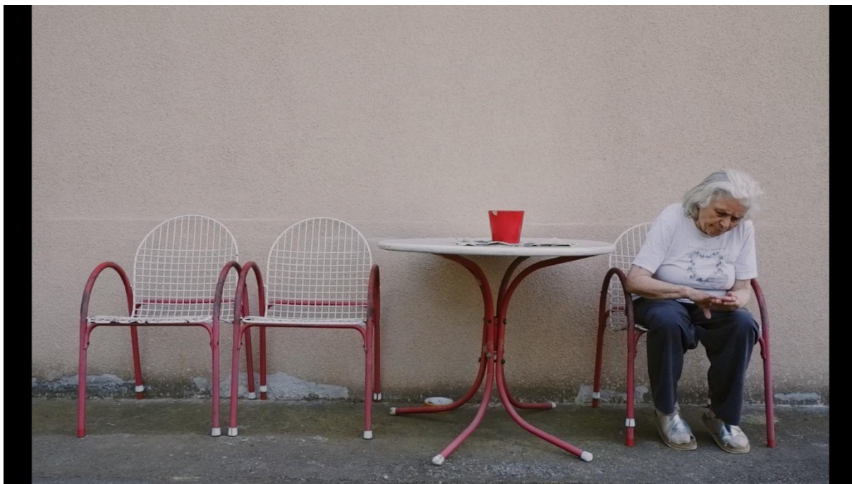
Slika 7, Entropija, 2021.

Primjer srednjeg plana možemo vidjeti na Slici 6. U kadru se nalaze dva subjekta obuhvaćeni od koljena pa naviše. Prostor je prostran i pregledan, a prisutni su i ostali vizualni elementi. U navedenom kadru baka i djed gledaju stare fotografije i razgovaraju o ljudima koje su prije poznavali. Zid je također ukrašen fotografijama i slikama, a kroz prozor se probija zraka sunca, stvarajući melankoličan i topao prizor.