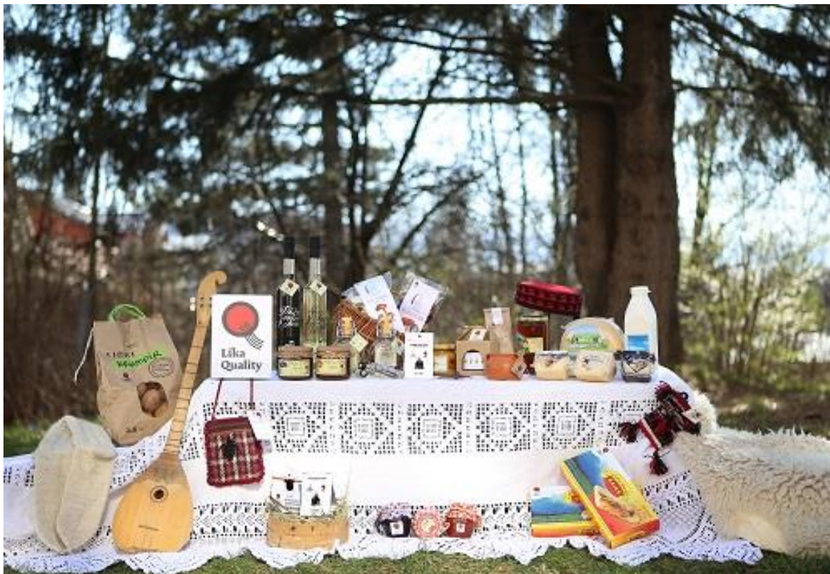
Slika 2. Proizvodi Lika Quality