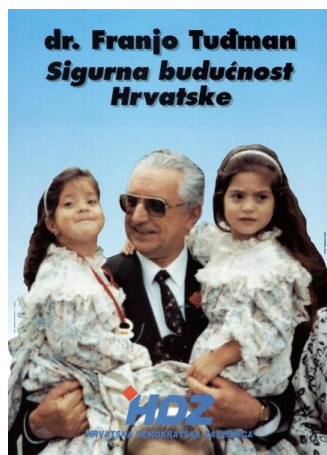
Slika 1: Predizborni plakat Franje Tuđmana iz 1992. godine

Dr. Franjo Tuđman prvi je put izabran za predsjednika nakon pobjede Hrvatske demokratske zajednice (HDZ) na prvim demokratskim izborima koji su se održali 30. svibnja 1990. godine. Tada je bio izabran za predsjednika Predsjedništva Socijalističke Republike Hrvatske. Međutim, plakati koji će se analizirati potječu iz 1992. godine kada je Tuđman proglašen predsjednikom Republike Hrvatske te je nakon toga obnašao dužnost od 1997. godine do svoje smrti 1999. godine.