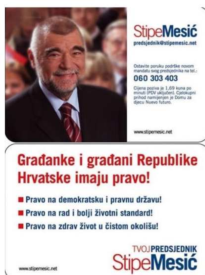
Slika 7: Predizborni plakat Stjepana Mesića iz 2005. godine