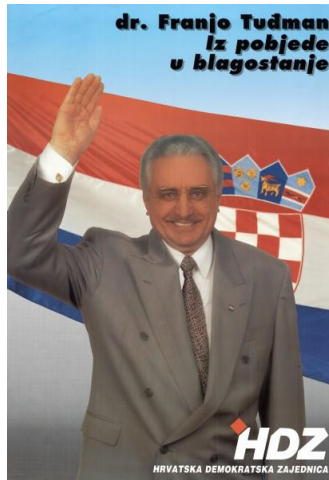
Slika 2: Predizborni plakat Franje Tuđmana iz 1992. godine