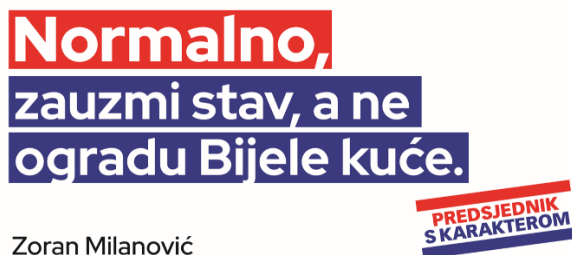
Slika 13: Predizborni plakat Zorana Milanovića

Zoran Milanović aktualni je predsjednik Republike Hrvatske koji svoju dužnost obnaša od 2019. godine.