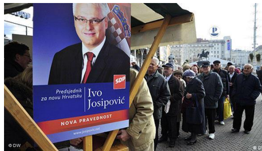
Slika 8: Predizborni plakat Ive Josipovića

Ivo Josipović bio je predsjednik Republike Hrvatske u razdoblju od siječnja 2010. godine do veljače 2005. godine.