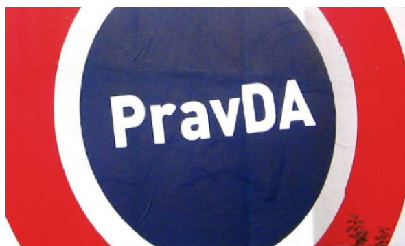
Slika 10: Logotip Ive Josipovića