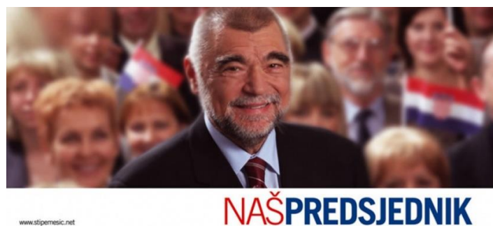
Slika 6: Predizborni plakat Stjepana Mesića iz 2005. godine