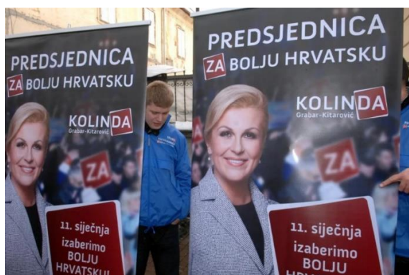
Slika 12: Predizborni plakat Kolinde Grabar Kitarović