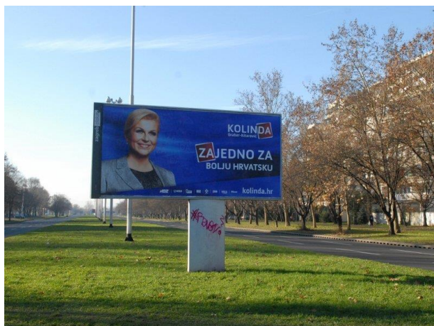
Slika 11: Predizborni plakat Kolinde Grabar Kitarović