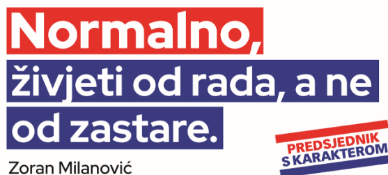
Slika 14: Predizborni plakat Zorana Milanovića