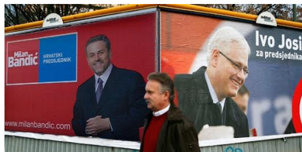
Slika 9: Predizborni plakat Ive Josipovića

(preuzeto: https://www.dw.com/hr/predsjednicki-kandidati-na-daljinsko-upravljanje/ )