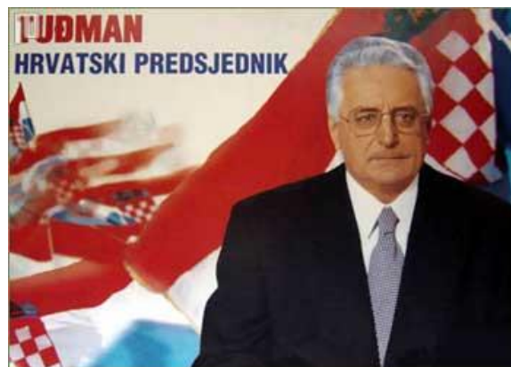
Slika 3: Predizborni plakat Franje Tuđmana iz 1997. godine