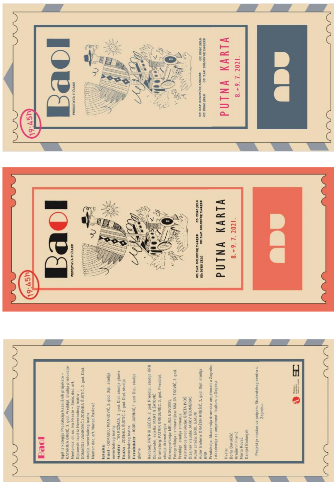
Slika 7: Programska knjižica u obliku putničkih karata