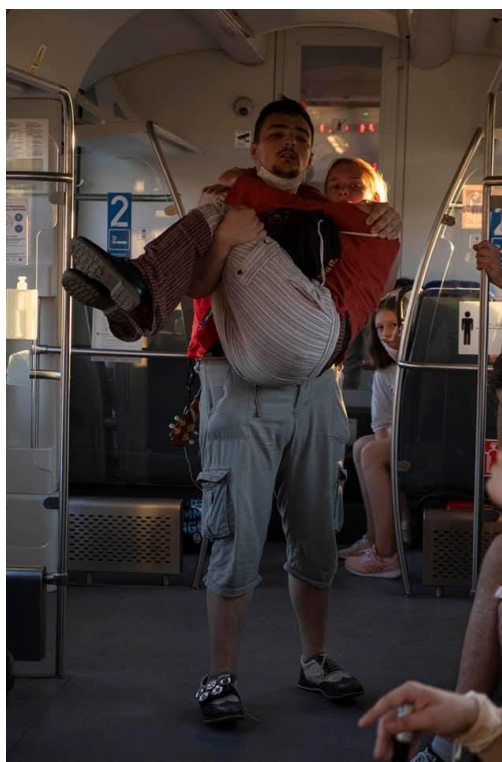
Slika 9: Partnerska podrška