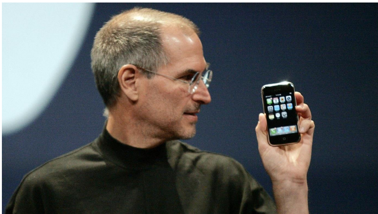
Slika 2: Steve Jobs prezentira prvi Iphone