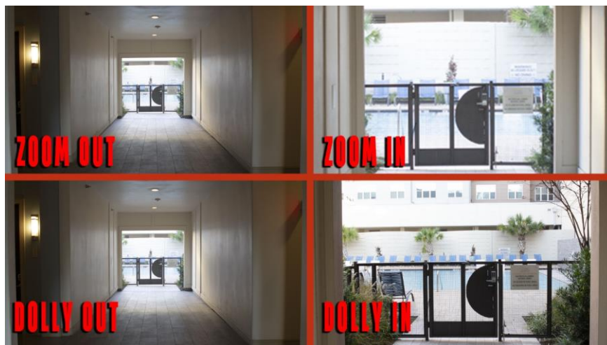
Slika 1: Prikaz Zoom in/ zoom out i Dolly in/ dolly out pokreta kamere

Dolly in/dolly out za razliku od zooma, pretjerano se ne oslanja na mogućnosti kamere već kolica na koja je kamera postavljena. Služi nam kako bismo kameru pomicali naprijed ili natrag.