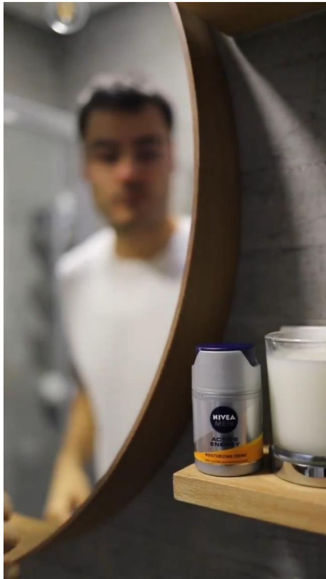
Slika 3: Isječak iz video kampanje autora @father_of_djordje za Nivea MEN active energy revitalizirajuću kremu za lice

promovira i mjesto u kojem se trenutno nalazi. Najnovija video reklama s profila odnosi se na Nivea MEN active energy revitalizirajuću kremu za lice koju uklapa u dio svoje novogodišnje jutarnje rutine. Proizvod je promišljeno uklopljen u prikaz njegova jutra, reklama ne postoji samo radi proizvoda nego vjerodostojno prikazuje proces jutra, od spavaće sobe, kuhinje i na kraju kupaonice gdje je proizvod korišten.