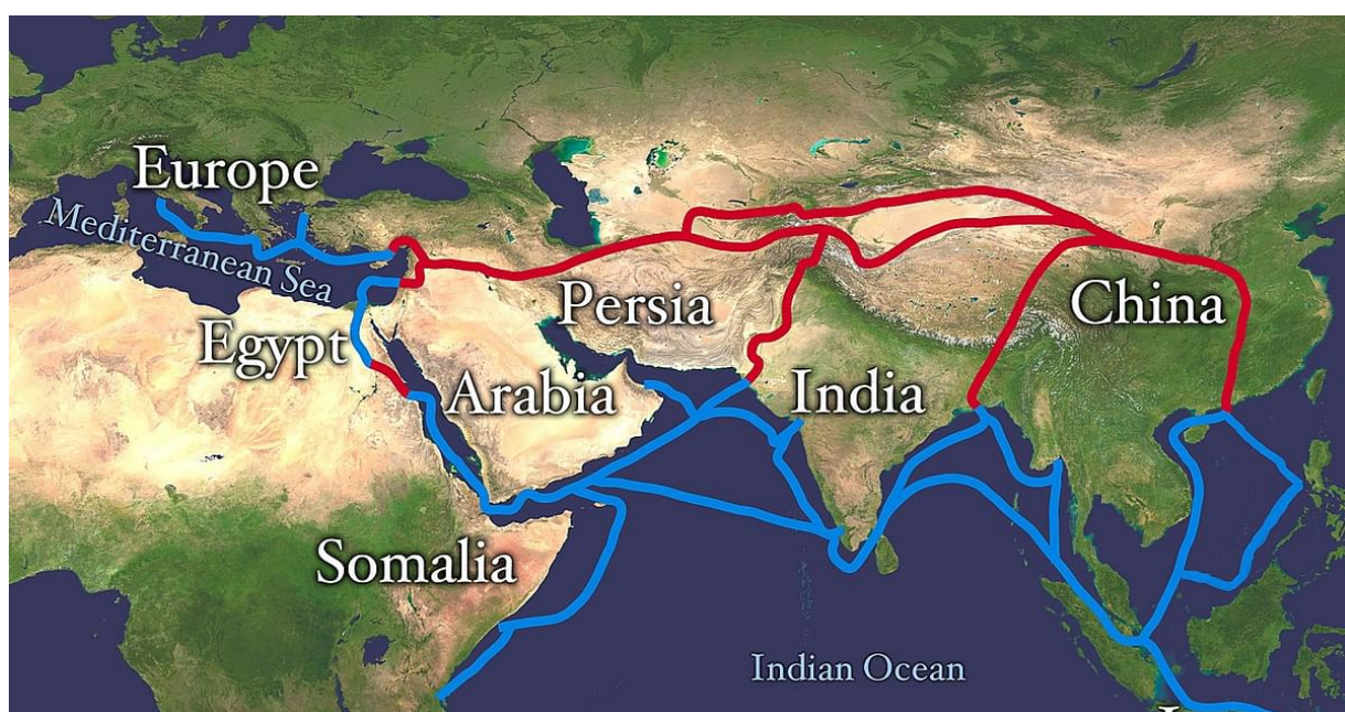
Slika 1 – Karta Puta svile (Mark, J.J., 2018)

primjer često se uzima put svile – trgovačka ruta koja je povezivala europsko Sredozemlje s Azijom. U procesu trgovačke razmjene, nedvojbeno je da su trgovci osim što su razmjenjivali svoje domaće proizvode koje čine njihovu kulturu, također širili i svoj jezik te upoznavali jezike drugih kultura, a kako bi olakšali procese robne razmjene i trgovine. Na slici 1 se vidi koliko je opsežna ta ruta bila te predočuje koliko kultura je bilo u spoju čak tisuću godina prije promišljanja o današnjim procesima globalizacije.