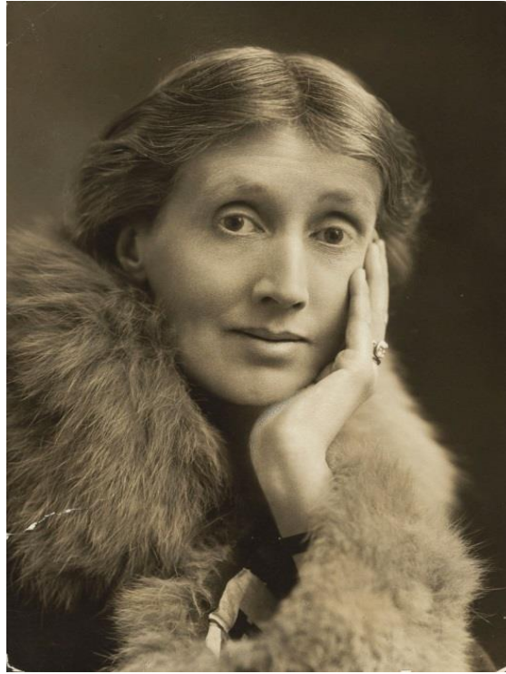
Slika 1. Virginia Woolf (1927.)

Adeline Virginia Stephen rođena je 25. siječnja 1882. godine kao šesto od osmero djece. Godine djetinjstva provodi u velikoj viktorijanskoj obitelji u londonskoj ulici Hyde Park Gate. U to vrijeme, školovanje djece nije bilo obavezno, stoga otac i ugledni intelektualac Leslie Stephen svoje dvije kćeri Virginiju i Vanessu školuje kod kuće. Time su sestre Stephen stekle veliko, ali neformalno obrazovanje te vrlo rano znale čime će se baviti ostatak života.