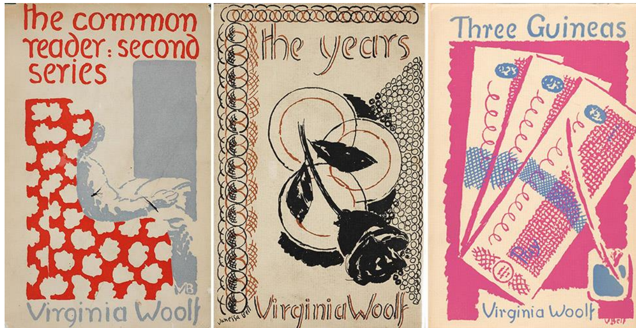
Slika 2. Naslovnice Vanesse Bell

Nekoliko godina prije udaje za Leonarda Woolfa, Virginia je počela raditi na svom prvom romanu. Nakon devet godina i bezbroj nacрта, objavljen je 1915. godine kao The Voyage Out . Dvije godine kasnije, bračni par Woolf kupuje tiskarski stroj i osniva Hogarth Press , vlastitu izdavačku kuću. Virginia u to doba intenzivno istražuje djela Sigmunda Freuda i psihoanalizu te objavljuju prve engleske prijevode njegovih tekstova te poeziju pjesnika T. S. Eliota. (Radmilo Derado, 2007:43) Vanessa Bell, sestra V. Woolf, oslikala je većinu naslovnica objavljenih u Hogarth Press-u .